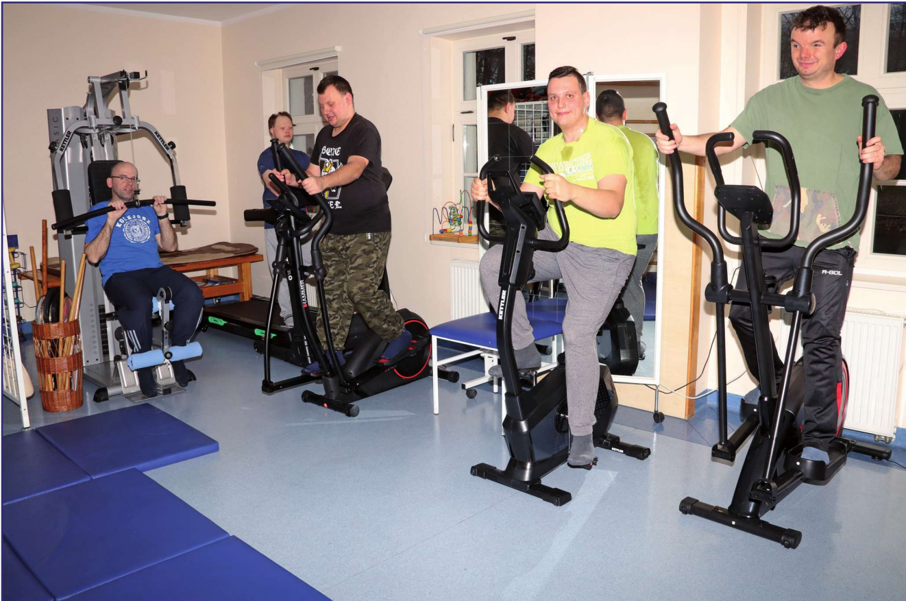
Warsztaty terapii zajęciowej w Górkach (gmina Kwidzyn) oraz w Ryjewie otrzymały pod koniec ubiegłego roku dofinansowanie do zakupu nowego sprzętu, w ramach Programu wyrównywania różnic między regionami III, realizowanego ze środków Państwowego Funduszu Rehabilitacji Osób Niepełnosprawnych. Na zdjęciu: rehabilitacja prowadzona w Warsztacie Terapii Zajęciowej w Górkach (gmina Kwidzyn).

Warsztaty terapii zajęciowej w Górkach (gmina Kwidzyn) oraz w Ryjewie otrzymały pod koniec ubiegłego roku dofinansowanie do zakupu nowego sprzętu, w ramach Programu wyrównywania różnic między regionami III, realizowanego ze środków Państwowego Funduszu Rehabilitacji Osób Niepełnosprawnych. Samorząd powiatu kwidzyńskiego uczestniczy w programie od początku jego uruchomienia w 2003 roku.