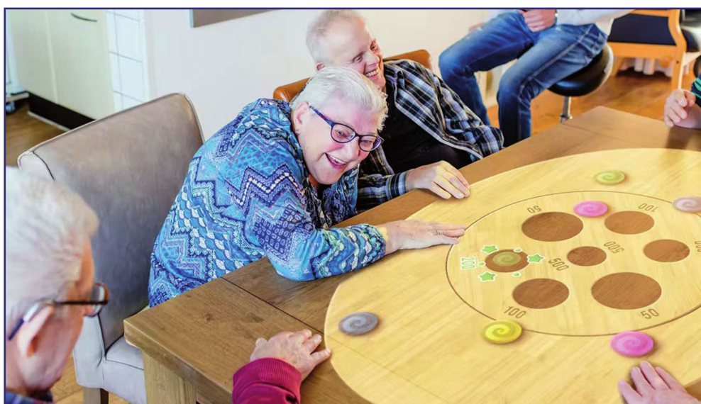
Holenderska firma Tover B.V. przedstawiła rozwiązanie umożliwiające osobom z niepełnosprawnościami intelektualnymi rehabilitację przez zabawę. Jest to Tovertafel – projektor, który wyświetla gry, w które można grać przy użyciu rąk.

Holenderska firma Tover B.V. przedstawiła rozwiązanie umożliwiające osobom z niepełnosprawnościami intelektualnymi rehabilitację przez zabawę. Jest to Tovertafel – projektor, który wyświetla gry, w które można