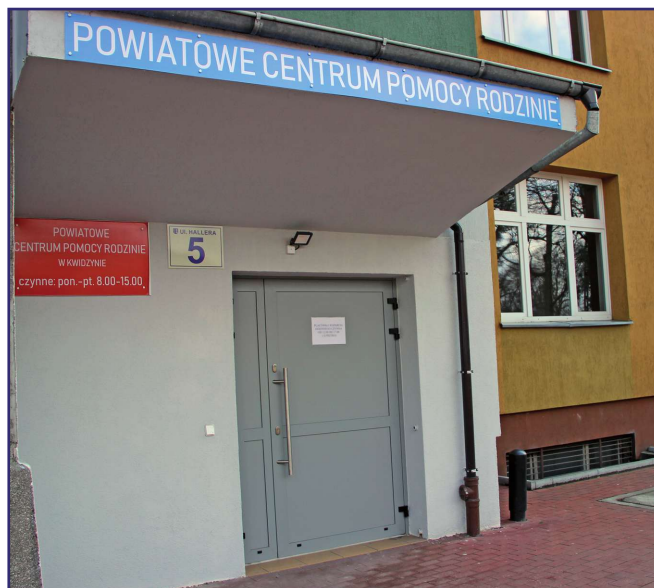
Do odbioru karty parkingowej i legitymacji osoby niepełnosprawnej można upoważnić kierownika Powiatowego Centrum Pomocy Rodzinie w Kwidzynie.

Zaliczenie do znacznego stopnia niepełnosprawności