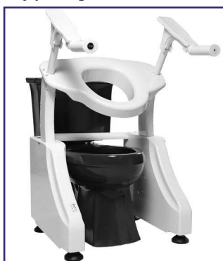
Podnośnik toaletowy.

czemu jest ono wyjątkowo dyskretne oraz certyfikat IPX7, który oznacza, że aparat słuchowy można zanurzyć w wodzie o głębokości do jednego metra na maksymalnie 30 minut. Eargo 6 działa na jednym ładowaniu do 16 godzin, a dołączone etui ładujące zapewnia dodatkowe