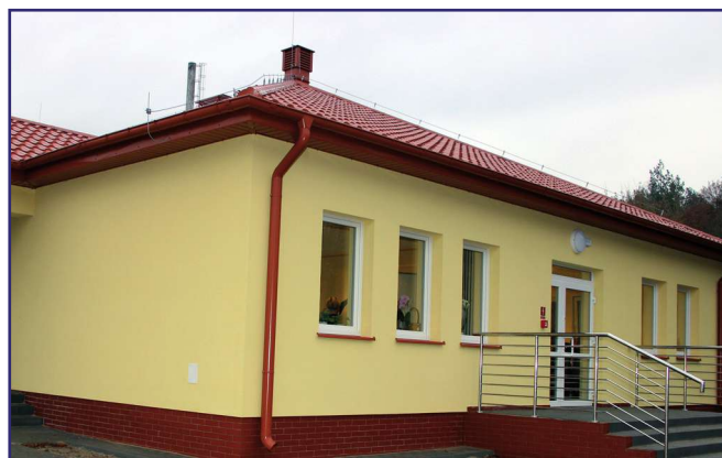
Warsztat Terapii Zajęciowej w Ryjewie, prowadzony przez Stowarzyszenie Pomocy Społecznej „Słoneczne Wzgórze” w styczniu 2020 roku zaczął funkcjonować w nowym budynku

wej w Ryjewie, prowadzony przez Stowarzyszenie Pomocy Społecznej „Słoneczne Wzgórze” uzyskał dofinansowanie z PFRON w kwocie ponad 11 tys. zł. Środki własne stowarzyszenia to ok. 2,9 tys. zł. Od stycznia 2020 roku WZ w Ryjewie działa w nowym budynku użyczonym stowarzyszeniu przez samorząd gminy. Pieniądze zostały przeznaczone na zakup dalszego wyposażenia warsztatu. Warsztat Terapii Zajęcio-