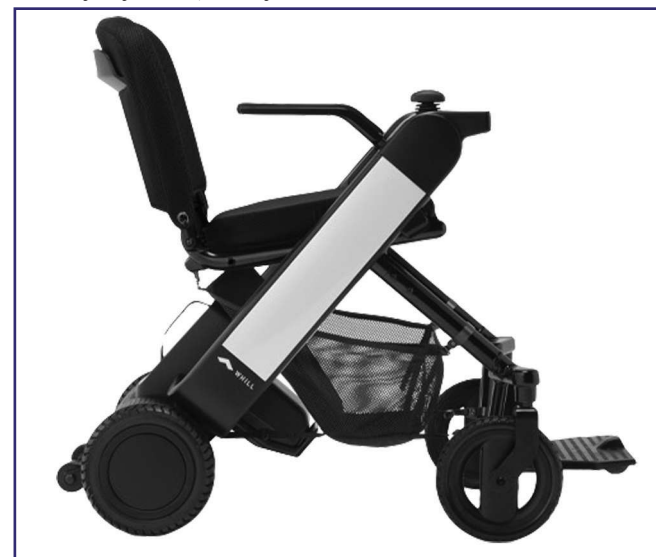
Elektryczny wózek inwalidzki Whill Model Fi.