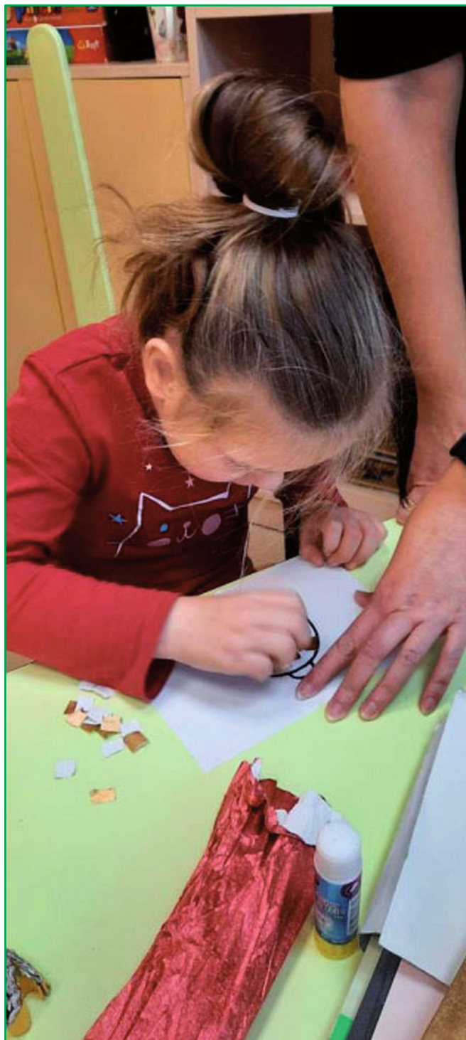
Projekt „Krok w przyszłość - wsparcie dzieci z niepełnosprawnościami z terenu powiatu kwidzyńskiego” samorządu powiatu i SOSW w Barcicach wprawdzie nagrody nie otrzymał, ale jak podkreślił organizatorzy, wszyscy, którzy zostali nominowani i nagrodzeni, zmieniają otoczenie i cały region na lepsze.

niezbędne meble oraz pomoce dydaktyczne. Zakupiony i zamontowany został też plac zabaw dla wychowanków. Ośmiu nauczycieli uzyskało wsparcie w postaci szkoleń i kursów niezbędnych do prowadzenia zajęć z dziećmi niepełnosprawnymi. Celem szkoleń było także podniesienie kwalifikacji i kom-