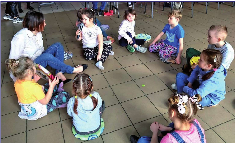
W zajęciach zorganizowanych przez Powiatowe Centrum Pomocy Rodzinie w Kwidzynie uczestniczyło 30 dzieci i młodzieży z rodzinnej pieczy zastępczej oraz 10 rodziców i opiekunów prawnych.

„Wyrażam siebie poprzez sztukę i ruch. Warsztaty teatralne i taneczne. Forma redukcji negatywnych skutków pandemii” to temat warsztatów, które odbyły się w ramach projektu „Pomorskie dzieciom”. Projekt będzie realizowany w powiecie kwidzyńskim do końca marca 2023 roku. Jego celem jest łagodzenie skutków epidemii COVID-19 oraz przeciwdziałanie jej negatywnym skutkom w rodzinach zastępczych oraz w instytucjonalnej pieczy zastępczej.