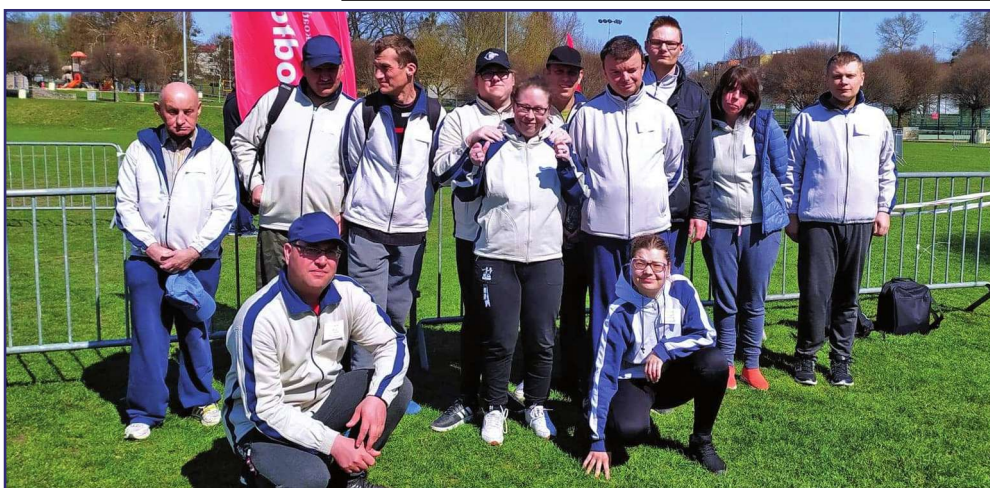
W biegu wzięli udział zawodnicy reprezentujący Warsztat Terapii Zajęciowej w Górkach, prowadzony przez Fundację „Misericordia”.