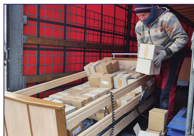
Rozładunek darów, które przyjechały z Niemiec.

kowym dworku w Górkach, siedzibie Warsztatu Terapii Zajęciowej, prowadzonego przez fundację. W wypożyczalni znajdują się wózki inwalidzkie, kule, balkoniki oraz specjalne łóżka do opieki nad obłożnie chorymi. Z powodu bardzo dużego zainteresowania nie zawsze określony sprzęt jest dostępny w danym dniu.