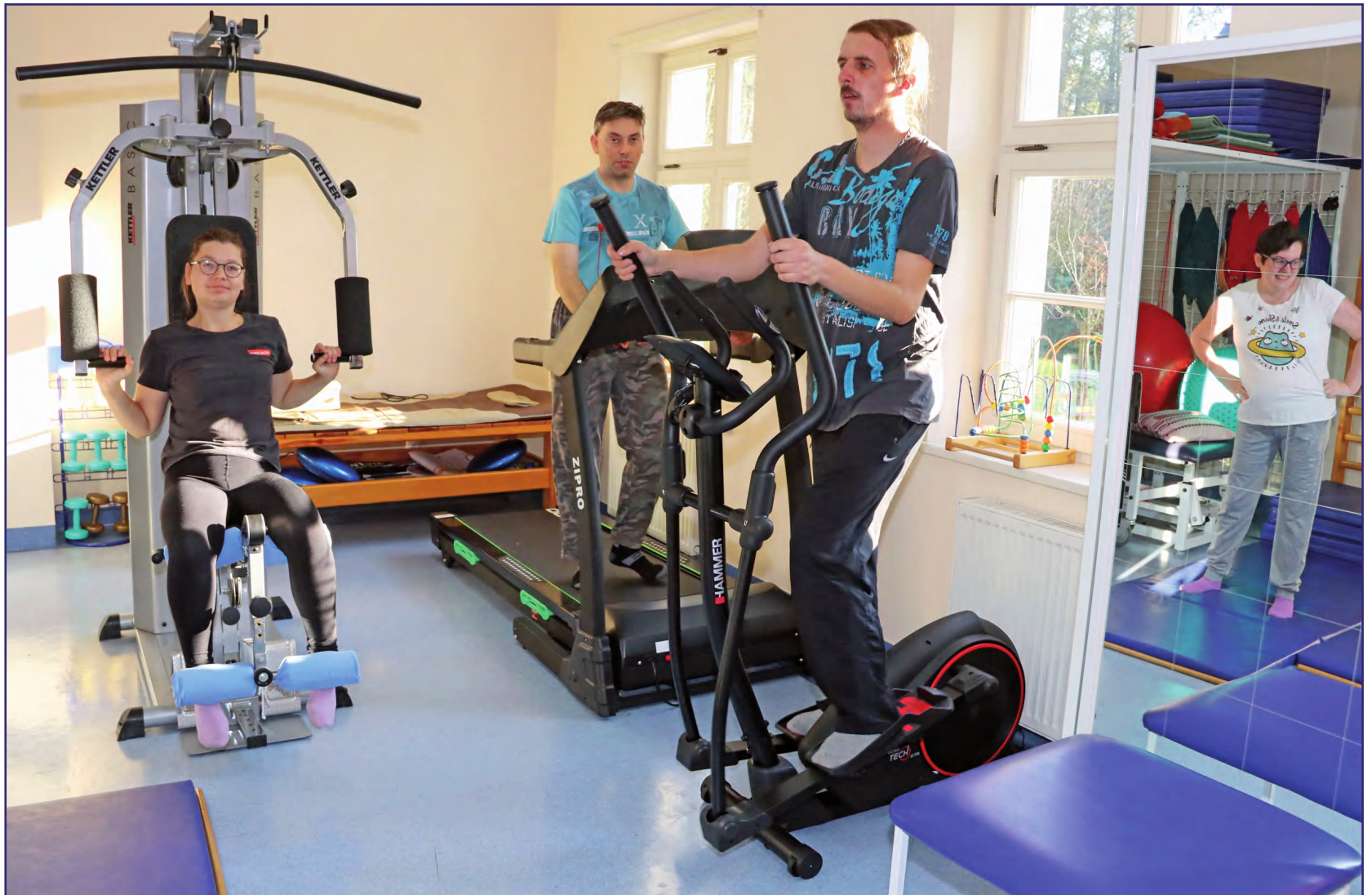
Ponad 3,3 mln zł trafiło w tym roku do powiatu kwidzyńskiego z Państwowego Funduszu Rehabilitacji Osób Niepełnosprawnych. Samorząd powiatu podzielił już pieniądze na poszczególne zadania. Na dofinansowanie kosztów działania dwóch warsztatów terapii zajęciowej w Górkach i Ryjewie przeznaczono ponad 2,2 mln zł.

Zgodnie z wnioskiem dyrektora Powiatowego Urzędu Pracy w Kwidzynie na realizację zadań z zakresu rehabilitacji zawodowej przeznaczono w tym roku 130 tys. zł. Pieniądze te zostaną przeznaczone na zwrot kosztów wyposażenia stanowiska pracy osoby niepełnosprawnej, podjęcie działalności gospodarczej lub rolniczej albo wniesienie wkładu do spółdzielni