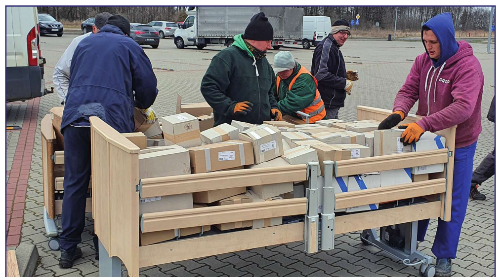
Wśród darów są także komplety naczyń ceramicznych, które zostaną przekazane dla domów pomocy społecznej w Kwidzynie i Ryjewie.