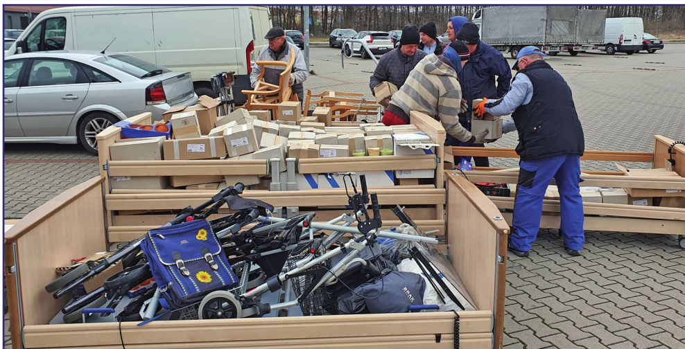
Wypożyczalnia sprzętu rehabilitacyjnego, do której trafiły dary, prowadzona jest przez fundację od 1992 roku.