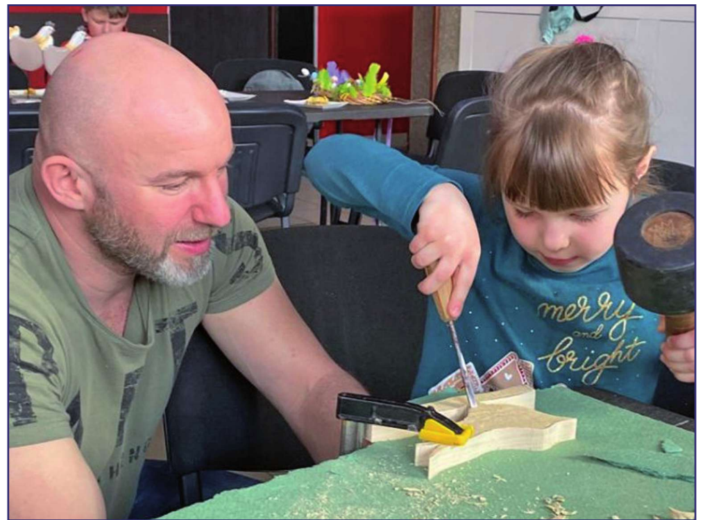
Sztuka florystyczna, rysunek i rzeźba pozwoliły uczestnikom zajęć wyrazić swoje emocje.

stii Powiatowego Centrum Pomocy Rodzinie. W zajęciach zorganizowanych przez PCPR uczestniczyło 30 dzieci i młodzieży z rodzinnej pieczy zastępczej oraz 10 rodziców i opiekunów prawnych. Sztuka florystyczna, rysunek i rzeź-