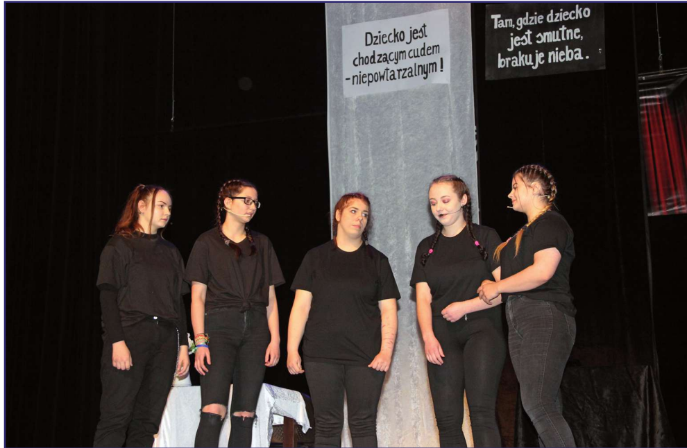
19 maja na deskach kwidzyńskiego teatru zaprezentują się młodzi aktorzy z placówek kształcenia specjalnego.

Na deskach kwidzyńskiego teatru zaprezentują się młodzi aktorzy z placówek kształcenia specjalnego z kilku województw. Po dwóch latach przerwy spowodowanej pandemią zorganizowane zostanie Kwidzyńskie Forum Teatralne Placówek Kształcenia Specjalnego.