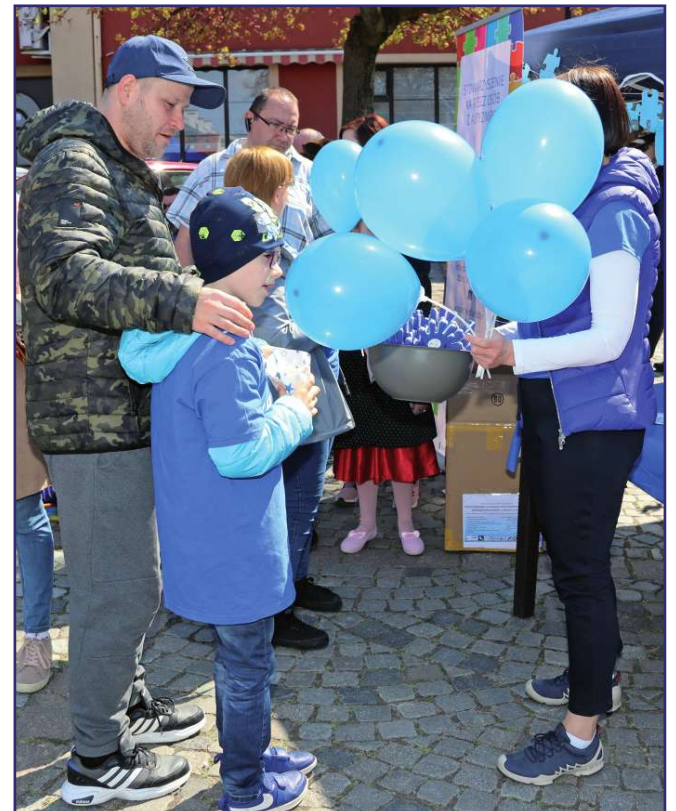
To pierwsza impreza stowarzyszenia po długiej przerwie spowodowanej pandemią.