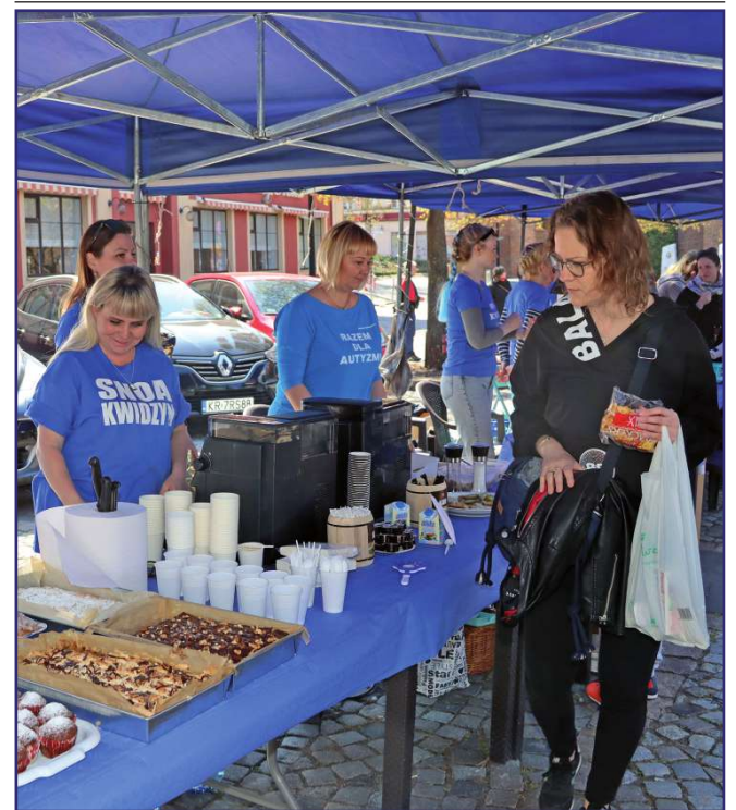
Podczas festynu można było skorzystać z poczęstunku w kawiarence przygotowanej przez organizatora.