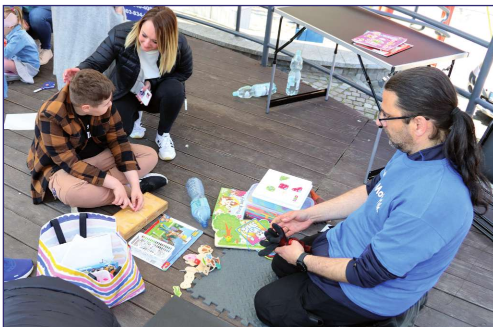
Podczas festynu zorganizowane zostały różnego rodzaju warsztaty z których mogli skorzystać rodzice wraz z dziećmi.

Podczas festynu nie brakowało dobrej zabawy. Odbył się też pokaz przygotowany przez strażaków. Można było wejść do strażackiego wozu i poznać sprzęt wykorzystywany w akcjach ratowniczo-gaśniczych. Zorganizowano