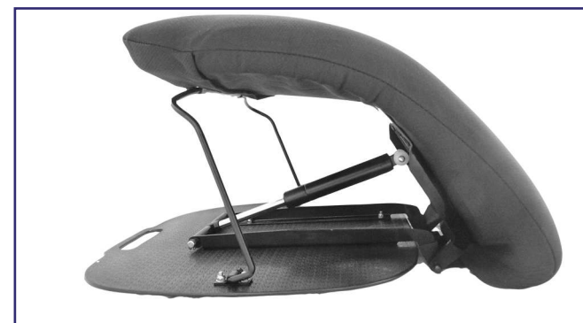
Poduszka Lift Up ułatwiająca wstawanie.