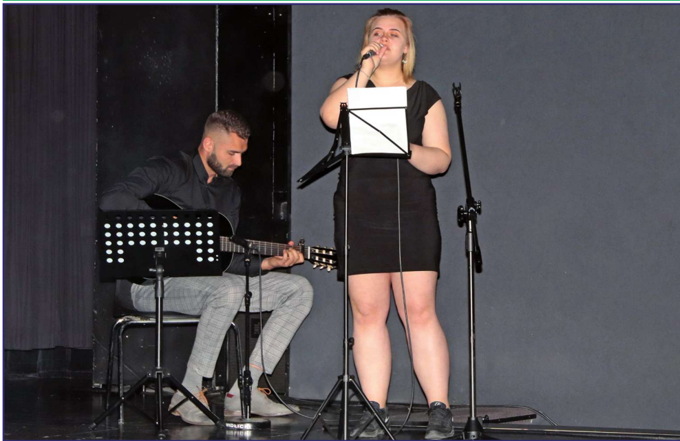
Swoje przedstawienia zaprezentowało dziesięć grup teatralnych. Na scenie gospodarze forum.

chowawczego w Okrągłej Łące, Specjalnego Ośrodka Szkolno-Wychowawczego w Uśnicach, Specjalnego Ośrodka Szkolno-Wychowawczego w Szymanowie, Domu im. Janusza Korczaka Regionalnej Placówce Opiekuńczo-Terapeutycznej w Gdańsku i Młodzieżowego Ośrodka Wychowawczego w Malborku.