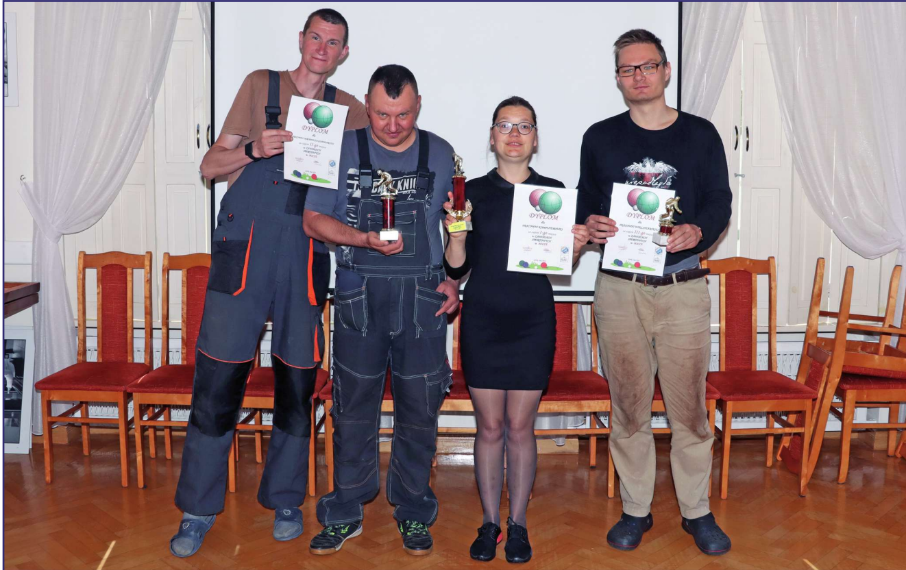
Pierwsze miejsce zajęła reprezentacja pracowni komputerowej, drugie uczestnicy pracowni ogrodniczo-gospodarczej, a trzecie miejsce zajęli reprezentanci pracowni wikliniarskiej.

Uczestnicy Warsztatu Terapii Zajęciowej w Górkach, prowadzonego przez Fundację „Misericordia”, przez ponad tydzień rywalizowali w turnieju bocce. To już drugi turniej w tym roku. Tym razem jednak, korzystając z cofnięcia niemal wszystkich obostrzeń związanych z pandemią, zawody rozegrano na zewnątrz, w sąsiedztwie zabytkowego dworku, który jest siedzibą warsztatu.