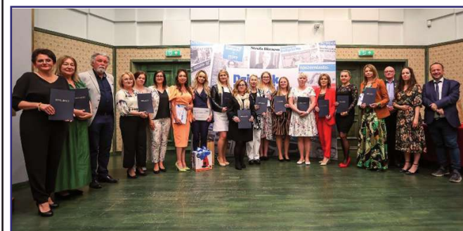
Uroczysta gala, podczas której wręczono wyróżnienie w kategorii Przedszkole Roku 2021, odbyła się w Polskiej Filharmonii Bałtyckiej w Gdańsku.