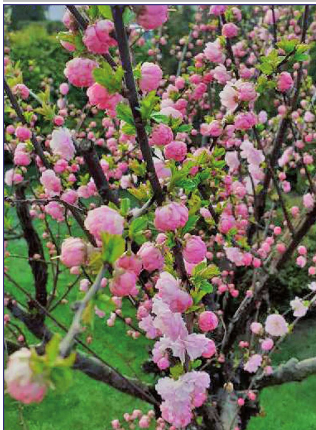
Wyróżniona fotografia wykonana przez Krzysztofa Lecha.