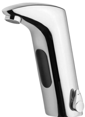
Bezdotykowa bateria umywalkowa.

Korzystanie z baterii umywalkowych może sprawiać problemy osobom o ograniczonej sprawności ruchowej – niektóre rodzaje niepełnosprawności mogą utrudnić odkręcenie i zakręcenie wody. W takim przypadku alternatywą może być zastosowanie baterii bezdotykowych, do których wy-