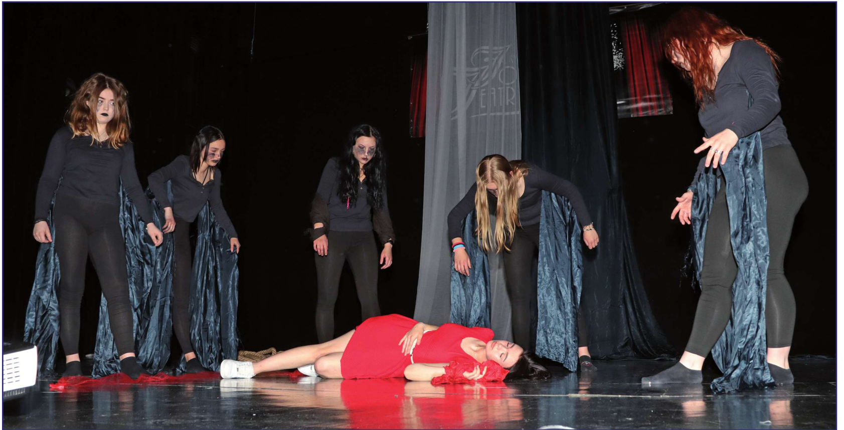
Po dwóch latach przerwy spowodowanej pandemią w kwidzyńskim teatrze odbyło się Kwidzyńskie Forum Teatralne Placówek Kształcenia Specjalnego. Swoje przedstawienia zaprezentowało dziesięć grup teatralnych z województw pomorskiego i warmińsko-mazurskiego. Pomysłodawcą i organizatorem imprezy jest Młodzieżowy Ośrodek Wychowawczy im. Janusza Korczaka w Kwidzynie. Na zdjęciu: przedstawienie grupy teatralnej z MOW w Kwidzynie.

- Po dwóch latach przerwy spotykamy się w teatrze. Z powodu pandemii dwa lata temu forum się nie odbyło, ale w ubiegłym roku zorganizowaliśmy je w formie online. Zwykle nasza impreza trwała dwa dni, ale w tym roku zdecydowaliśmy, że będzie trwała tylko jeden dzień. Na nasze zaproszenie odpowiedziało dziesięć zespołów. Mam nadzieję, że w przyszłym roku wrócimy już do starej formuły i forum potrwa dwa dni. Razem z tym, które odbyło się w ubiegłym roku w formie online, będzie to