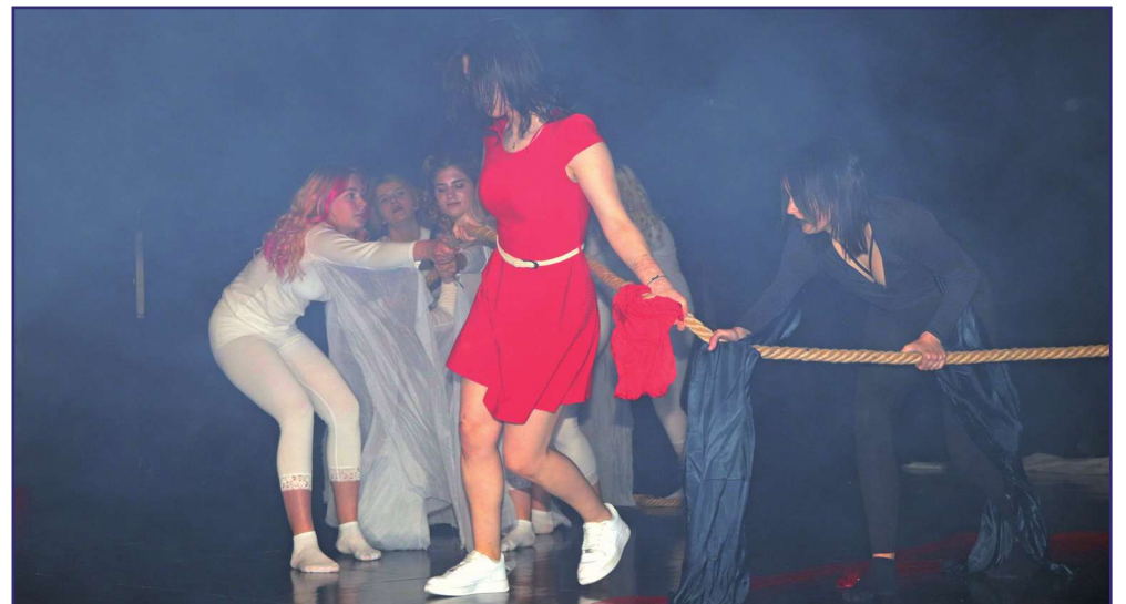
Grupa teatralna z Młodzieżowego Ośrodka Wychowawczego im. Janusza Korczaka w Kwidzynie zaprezentowała spektakl „Cisza...”.