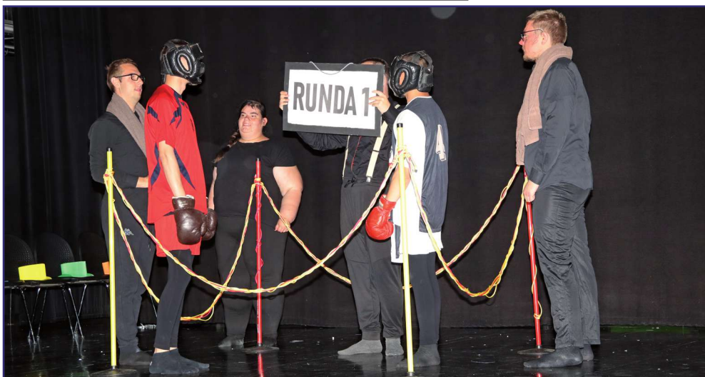
Na scenie młodzi aktorzy ze Szkoły Specjalnej Przystosowującej do Pracy w Kwidzynie,

Przedszkole z Oddziałami Integracyjnymi placówką roku