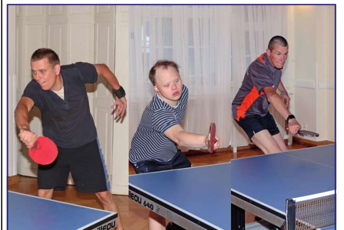
Najlepsza trójka tenisistów turnieju.