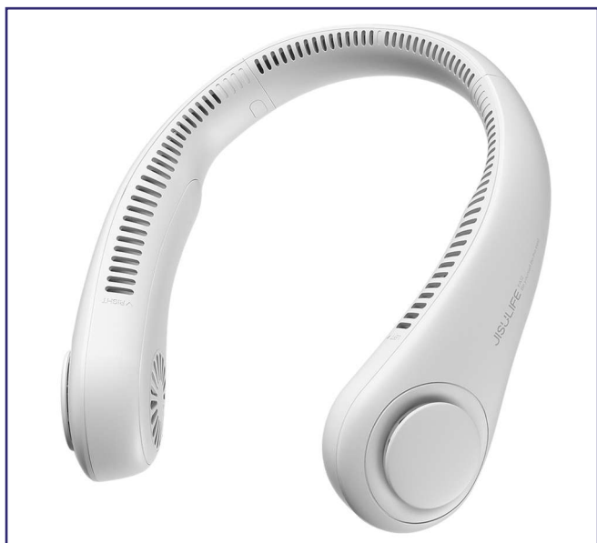
Wentylator na szyję.

picia wody. Istnieją jednak różne aplikacje mobilne, które przypominają o picia wody i umożliwiają śledzenie ilości