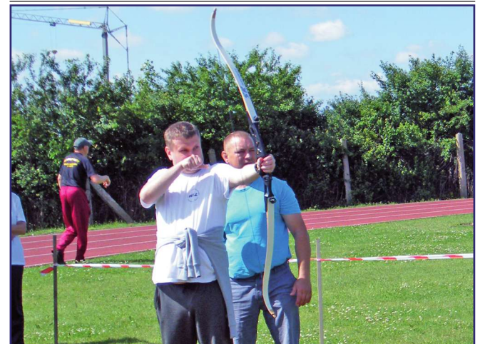
Jedną z konkurencji indywidualnych było strzelanie z łuku.