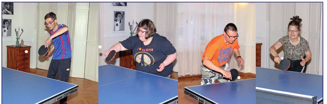
Niepełnosprawni tenisiści walczyli o Puchar Kierownika Warsztatu Terapii Zajęciowej.