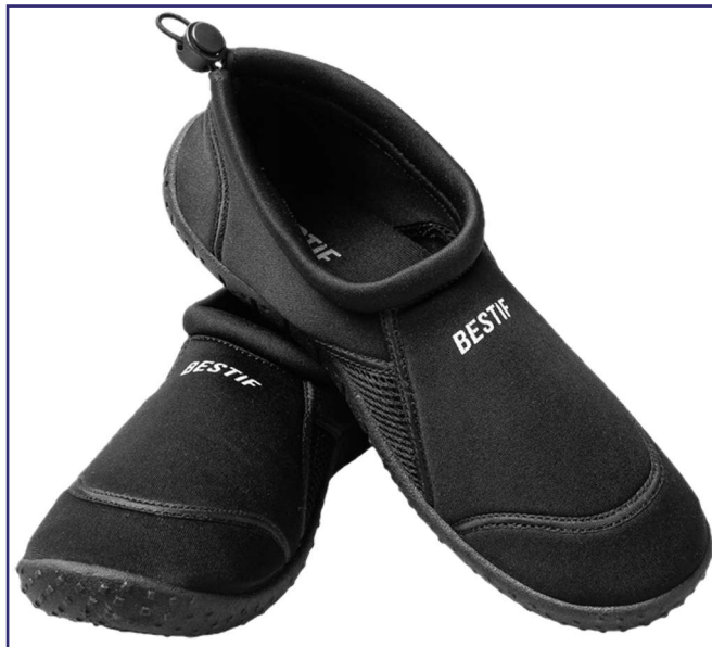
Buty do wody.