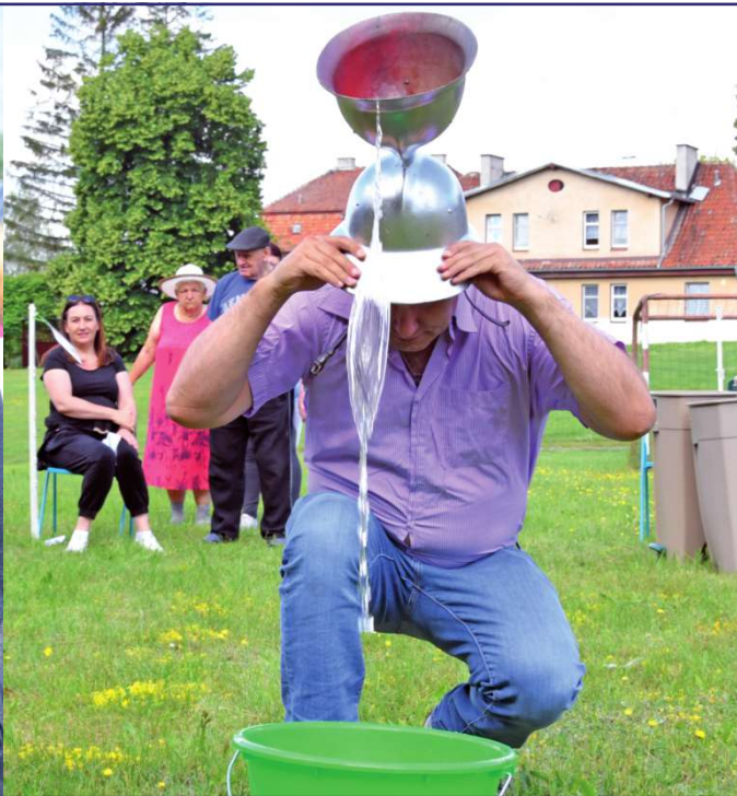
Mokra robota, sikawka, slalom z piłką to tylko niektóre z konkurencji, w których startowali mieszkańcy Domu Pomocy Społecznej „Słoneczne Wzgórze” w Ryjewie podczas pikniku sportowo – rekreacyjnego „Dzień Sportu”.