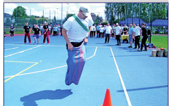
Oprócz konkurencji indywidualnych, rozegrano również cztery konkurencje drużynowe, w których o wyniku decydował czas ukończenia konkurencji.