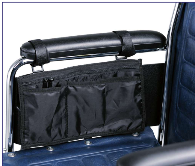
Torba mocowana do podłokietnika wózka inwalidzkiego