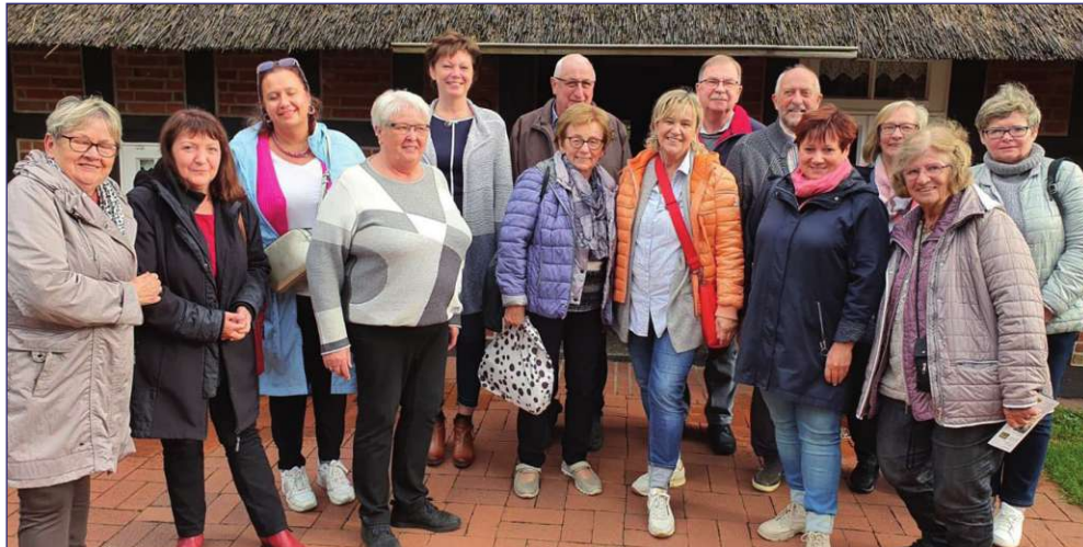
Przedstawiciele instytucji, placówek oraz organizacji pozarządowych zajmujących się wspieraniem osób niepełnosprawnych oraz seniorów z gospodarzami delegacji powiatu kwidzyńskiego w partnerskim powiecie Osterholz.

- Podczas pierwszego dnia wizyty spotkaliśmy się z przedstawicielami Gminnej oraz Powiatowej Rady Seniorów Powiatu Osterholz. W drugim dniu w Lilienthal odbyła się konferencja niemiecko-polska, poświęcona wsparciu seniorów i osób wykluczonych w powiecie kwidzyńskim. Nasza delegacja wysłuchała wystąpień osób zajmujących się wsparciem seniorów i osób z niepełnosprawnościami z powiatu Osterholz. Przedstawiona została też działalność organizacji pozarządowych działających na rzecz osób potrzebujących wsparcia oraz niepełnosprawnych. Nasi