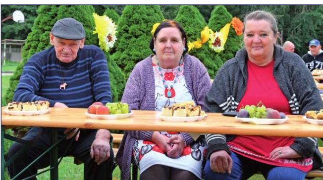
Na stołach nie zabrakło słodkich wypieków i owoców.