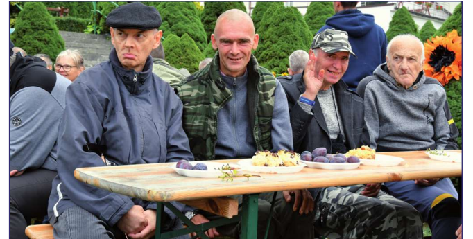
Podczas imprezy mieszkańcy domu mogli wspólnie biesiadować.