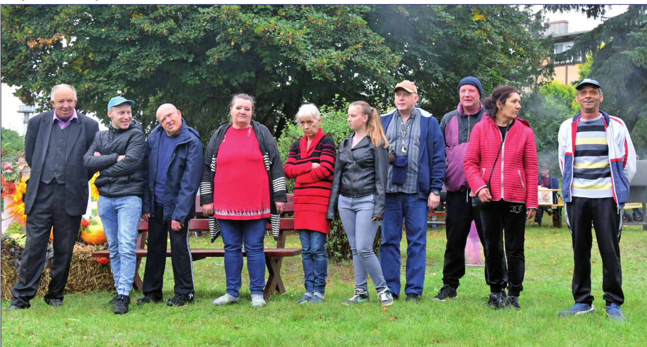
W tym roku upływał termin kadencji dotychczasowej rady. W drodze głosowania, powołano Radę Mieszkańców na kolejne cztery lata.

jaki jest stopień naszej sprawności, z jakimi trudnościami się borykamy, mamy takie samo prawo do szczęścia. Do miłości stamtąd i stąd. (jk)