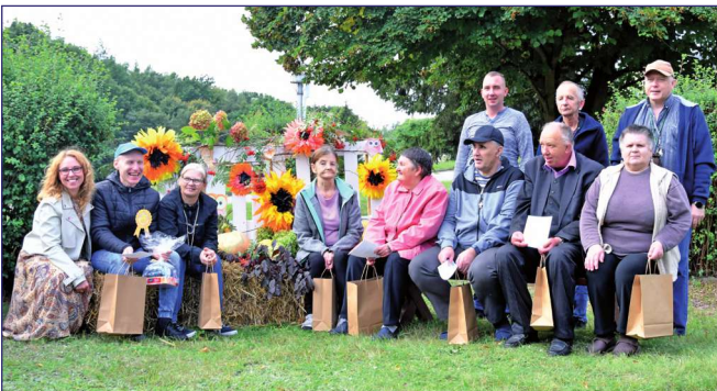
Mieszkańcy pierwszego piętra budynku B wyróżnieni za aktywny udział w zajęciach rehabilitacji społecznej.