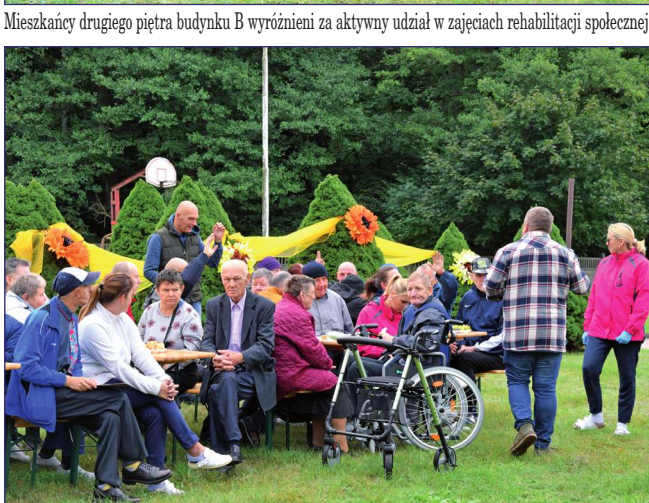
Liczenie głosów podczas wyboru składu Rady Mieszkańców.