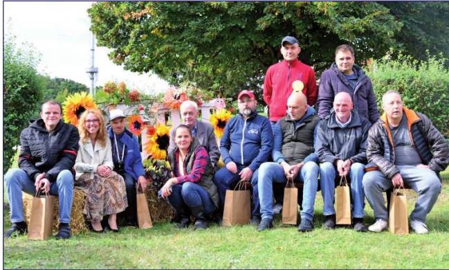
Mieszkańcy budynku E wyróżnieni za aktywny udział w zajęciach rehabilitacji społecznej.