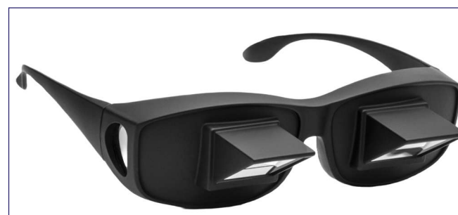
Okulary do czytania na leżąco.