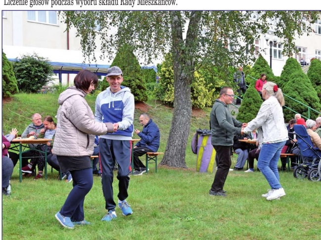
Podczas Święta Nagród nie zabrakło dobrej zabawy.