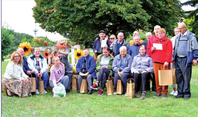
Mieszkańcy budynku C wyróżnieni za aktywny udział w zajęciach rehabilitacji społecznej.