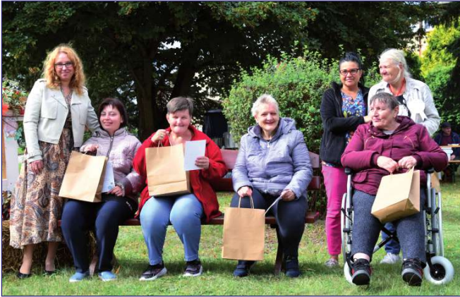
Mieszkaniczki budynku D wyróżnione za aktywny udział w zajęciach rehabilitacji społecznej.