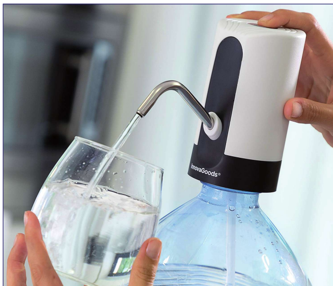
Automatyczny dozownik wody.

To urządzenie, które zapewnia całodobową ochronę osobom starszym, niepełnosprawnym i innym, które mogą potrzebować stałego monitorowania stanu zdrowia. Urządzenie jest bardzo łatwe w obsłudze – w razie wypadku lub nagłego pogorszenia stanu zdrowia wystarczy przytrzymać przycisk przez dwie sekundy, aby połączyć się z centrum ratunkowym. Aby jeszcze bardziej zwiększyć bezpieczeństwo użytkownika, opaska jest wyposażona również w czujnik upadku – jeśli użytkownik się przewróci i pozostanie w bezruchu, opaska automatycznie wezwie pomoc. Urządzenie monitoruje również tętno oraz poziom nasycenia krwi tlenem i w momencie wezwania pomocy wysyła te dane do centrum ratunkowego wraz z lokalizacją użytkownika. Oprócz tego opaska monitoruje aktywność fizyczną użytkownika i może przypominać o zażyciu leków. Użytkownik ma do dyspozycji również bezpłatną aplikację mobilną