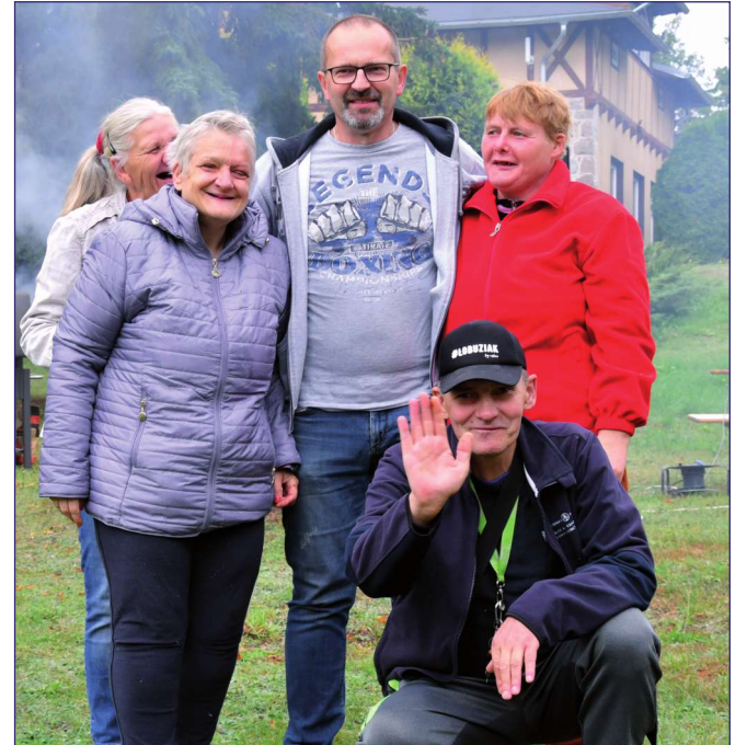
Mieszkańcy domu angażują się w życie domu, aktywnie uczestniczą w różnego rodzaju zawodach sportowo-rekreacyjnych oraz wydarzeniach.