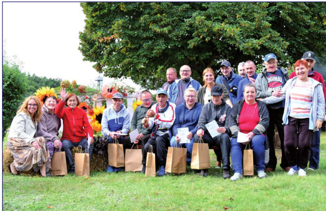
Mieszkańcy drugiego piętra budynku B wyróżnieni za aktywny udział w zajęciach rehabilitacji społecznej.