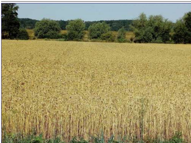
Wyróżnione zdjęcie Arkadiusza Wąsika.