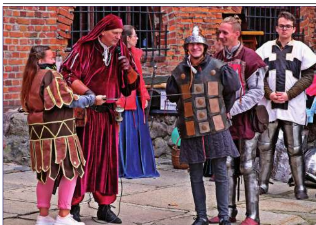
Jak podkreślają organizatorzy wydarzenia inscenizacja przeniosła uczestników, w tym młodzież z niepełnosprawnościami, do epoki średniowiecza.