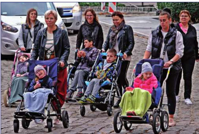
Adresaci projektu to uczniowie Szkoły Podstawowej nr 6, Szkoły Specjalnej Przesposabiającej do Pracy w Kwidzynie oraz Specjalnego Ośrodka Szkolno-Wychowawczego w Barcicach.