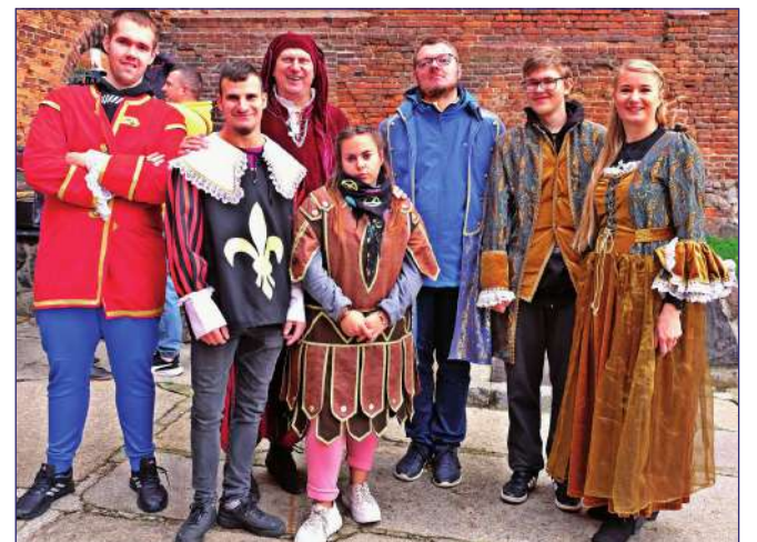
Na dziedzińcu kwidzyńskiego zamku odbyła się inscenizacja historyczna przygotowana przez grupę rekonstrukcyjną „Apis” z Gniewa.