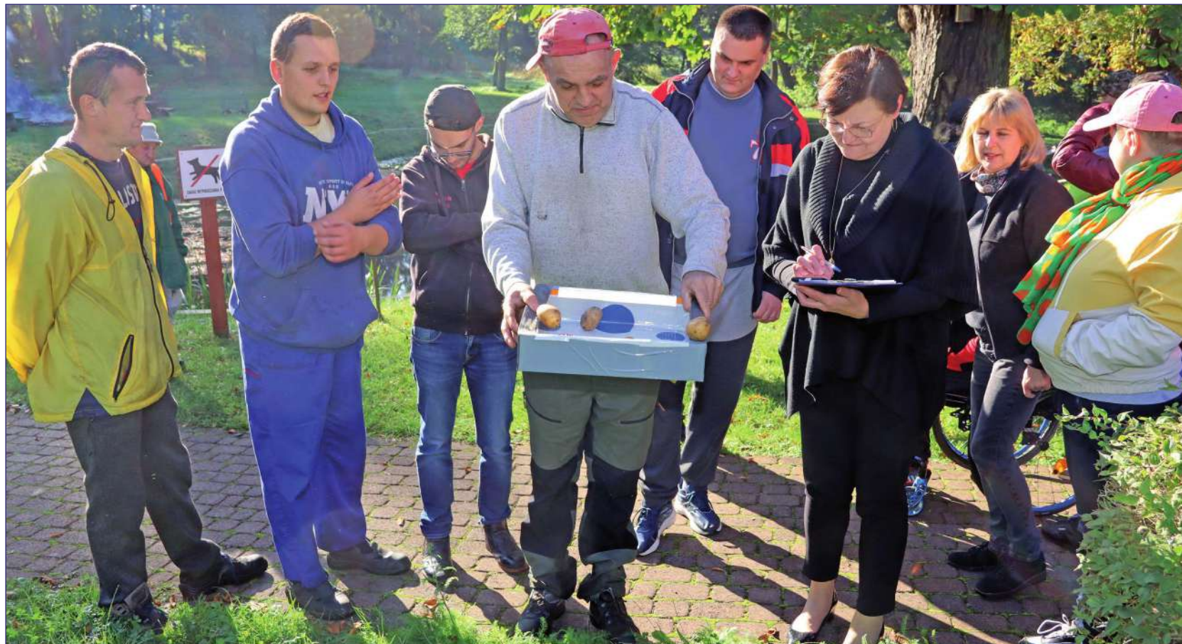
Niepełnosprawni uczestnicy Warsztatu Terapii Zajęciowej w Górkach, prowadzonego przez Fundację „Misericordia”, bawili się podczas Dnia Pieczonego Ziemniaka. Podczas imprezy odbyły się także konkursy sprawnościowe, w których główną rolę odgrywał ziemniak.