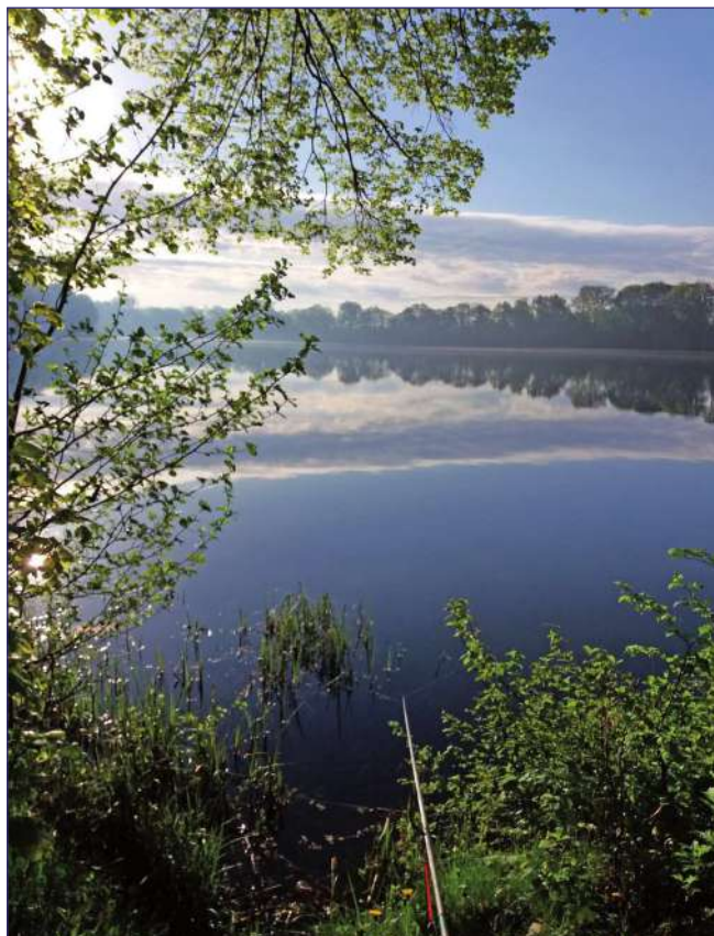
Fotografia Michała Wiącka - pierwsze miejsce w konkursie.