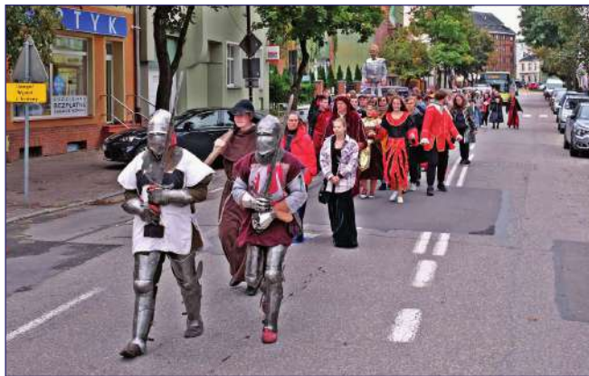
Przemarsz uczestników projektu „Żywa lekcja historii - historia Kwidzyna” ulicami miasta.