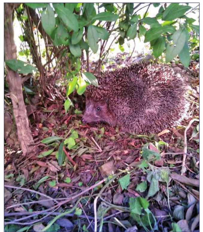
drugie miejsce w konkursie.