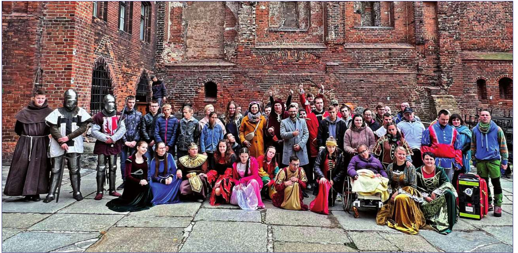
„Żywa lekcja historii - historia Kwidzyna” to projekt zrealizowany przez Szkołę Specjalną Przesposabiającą do Pracy. Na zdjęciu: uczestnicy i realizatorzy projektu.

Na dziedzińcu kwidzyńskiego zamku odbyła się inscenizacja historyczna przygotowana przez grupę rekonstrukcyjną „Apis” z Gniewa, która promuje między innymi wiedzę o historii średniowiecznego Kwidzyna. Jak podkreślają organizatorzy wydarzenia inscenizacja przeniosła uczestników, w tym młodzież z niepełnosprawnościami, do epoki średniowiecza i ułatwiła zrozumienie kultury, zwyczajów oraz codzienności i mentalności ludzi żyjących