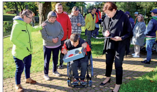
Do końca listopada Powiatowe Centrum Pomocy Rodzinie w Kwidzynie przyjmuje wnioski na dofinansowanie sportu, kultury, rekreacji i turystyki osób niepełnosprawnych na 2023 rok. Zdjęcie ilustracyjne.

- O dofinansowanie mogą ubiegać się osoby prawne i jednostki organizacyjne nieposiadające osobowości prawnej, jeżeli prowadzą działalność na rzecz osób niepełnosprawnych przez okres co najmniej 2 lat przed dniem złożenia wniosku, udokumentują zapewnienie odpowiednich do potrzeb osób niepełnosprawnych warunków technicznych i lokalowych do realizacji zadania, udokumentują posiadanie środków własnych lub pozyskanych z innych źródeł na sfinansowanie przedsięwzięcia w wysokości nieobjętej dofinansowaniem ze środków PFRON – wyjaśnia Renata