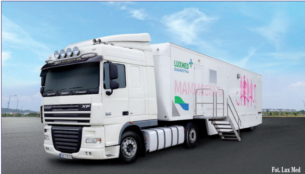
Fot. Lux Med

Mieszkanke powiatu kwidzyńskiego w wieku od 50 do 59 lat będą mogły skorzystać z bezpłatnych badań mammograficznych. Badania prowadzi Lux Med Diagnostyka. Ich finansowanie zapewnił Narodowy Fundusz Zdrowia w ramach Programu Profilaktyki Raka Piersi. Badanie można wykonać w dowolnej lokalizacji, niezależnie od miejsca zamieszkania i bez skierowania lekarskiego.