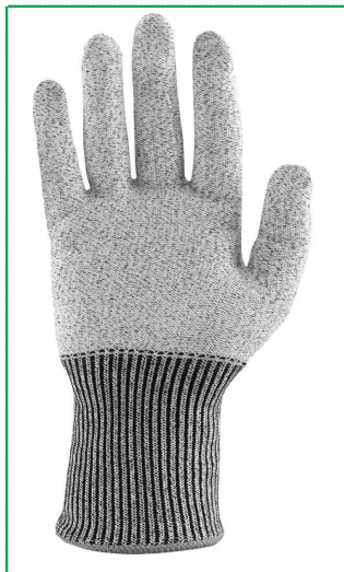
Rękawica chroniąca przed skaleczeniem.

chronią dłoń przed skaleczeniami. Umożliwiają bez-