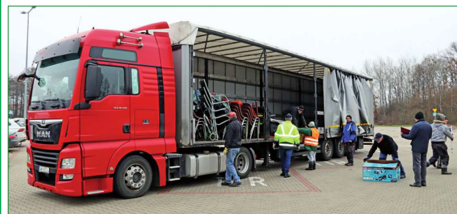
Wózki inwalidzkie, chodziki oraz łóżka elektryczne dla obłożnie chorych, a także innego rodzaju sprzęt przyjechał z Niemiec do Kwidzyna. To dar Zakonu Joannitów.