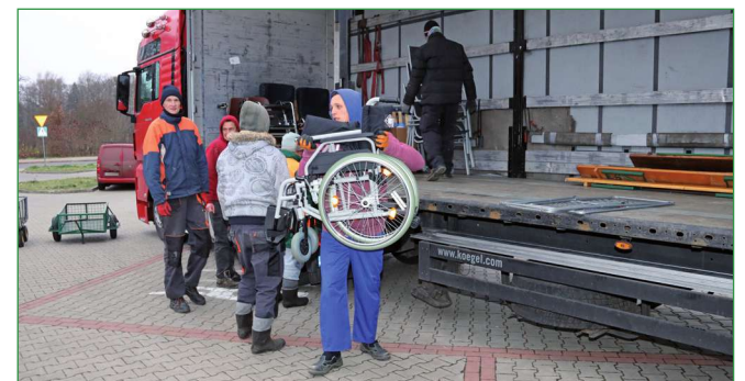
Dary trafią do wypożyczalni sprzętu rehabilitacyjnego, prowadzonego przez Fundację „Misericordia” w Górkach, w gminie Kwidzyn.