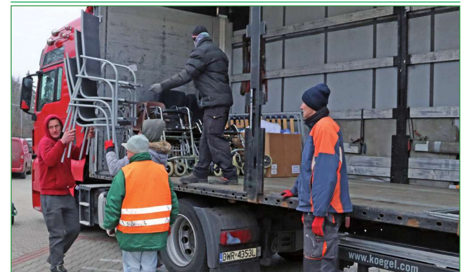
Część darów trafiła już do Domu Pomocy Społecznej w Kwidzynie.