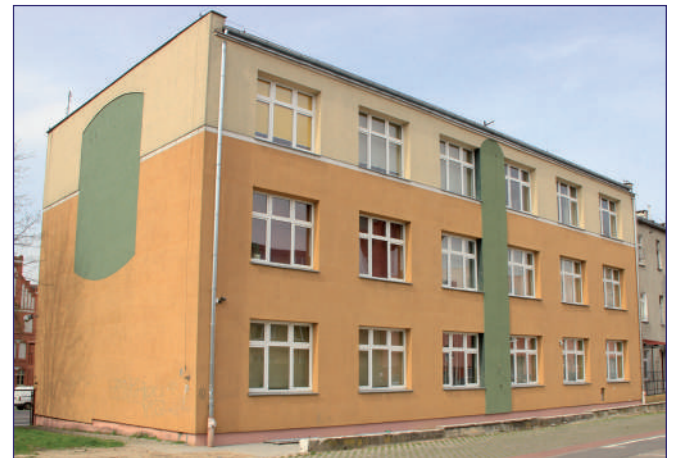
Samorząd powiatu otrzymał dofinansowanie na realizację programów „Opieka wytchnieniowa” oraz „Asystent osobisty osoby niepełnosprawnej”. Ich realizatorem w powiecie kwidzyńskim kolejny rok będzie Powiatowe Centrum Pomocy Rodzinie w Kwidzynie.

Pieniądze na realizację programów pochodzą ze środków Funduszu Solidarnościowego, który ma na celu między innymi wsparcie społeczne, zawodowe, zdrowotne oraz finansowe osób niepełnosprawnych. Programy przygotowało Ministerstwo Rodziny i Polityki Społecznej, a ich realizatorem w powiecie kwidzyńskim kolejny rok będzie Powiatowe Centrum Pomocy Rodzinie w Kwidzynie. Obecnie przygotowywane są dokumenty dotyczące naboru osób niepełnosprawnych do realizacji obu programów oraz wykonawców czyli asystentów osób niepełnosprawnych i osób świadczących pomoc w ramach opieki wytchnieniowej. Realizacja programów ma rozpocząć się w marcu. W ramach programu „Asystent osobisty osoby niepełnosprawnej” wsparcie otrzyma 19 osób niepełnosprawnych z powiatu kwidzyńskiego. Na jego realizację powiat otrzymał środki w wysokości ponad 397 tys. zł. Program ma między innymi zapewnić możliwość skorzystania przez osoby niepełnosprawne z pomocy asystenta osobistego przy wykonywaniu codziennych czynności i funkcjonowaniu w życiu społecznym, takimi jak wyjście do kina, parku, urzędu czy dotarcie na rehabilitację. Usługa asystenta osobistego