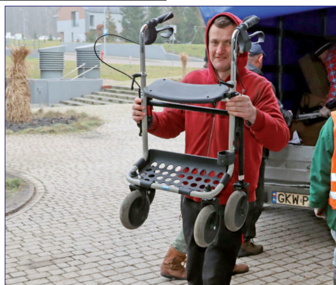
Wśród przekazanych darów jest również sprzęt rehabilitacyjny, który trafił do wypożyczalni sprzętu rehabilitacyjnego, prowadzonego przez Fundację „Misericordia”.