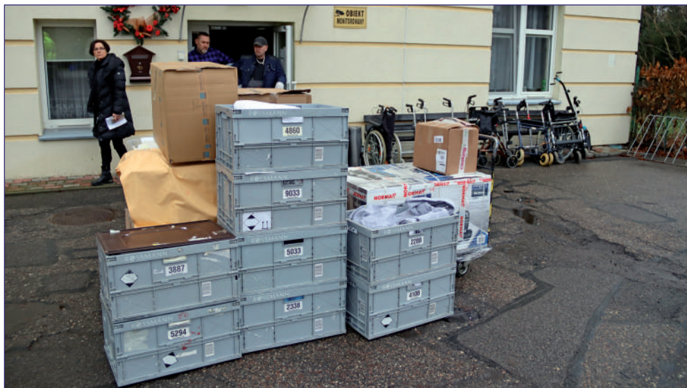
Do Domu Pomocy Społecznej w Kwidzynie trafiły podkłady wielorazowego użytku, prześcieradła, śliniaki dla osób dorosłych i ręczniki.