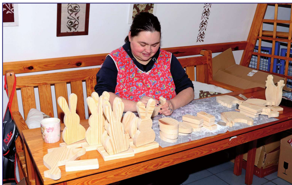
Niepełnosprawni uczestnicy Warsztatu Terapii Zajęciowej w Górkach już przygotowują wyroby, które zapelnia stoiska podczas tradycyjnego, przedświątecznego, wielkanocnego kiermaszu.

Niepełnosprawni uczestnicy Warsztatu Terapii Zajęciowej w Górkach już przygotowują wyroby, które zapelnia stoiska podczas tradycyjnego, przedświątecznego, wielkanocnego kiermaszu. Kiermasz rozpocznie się 20 marca i zakończy 1 kwietnia w zabytkowym dworku w Górkach, siedzibie Warsztatu Terapii Zajęciowej. Świąteczne ozdoby będzie można kupować od poniedziałku do soboty.