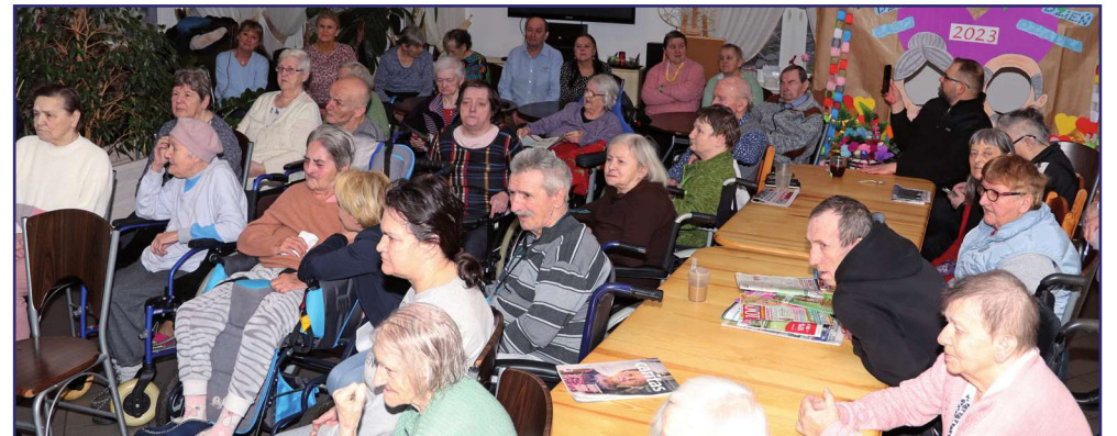
Mieszkańcy Domu Pomocy Społecznej w Kwidzynie po trudnym okresie izolacji związanym z pandemią mogą aktywnie uczestniczyć w spotkaniach