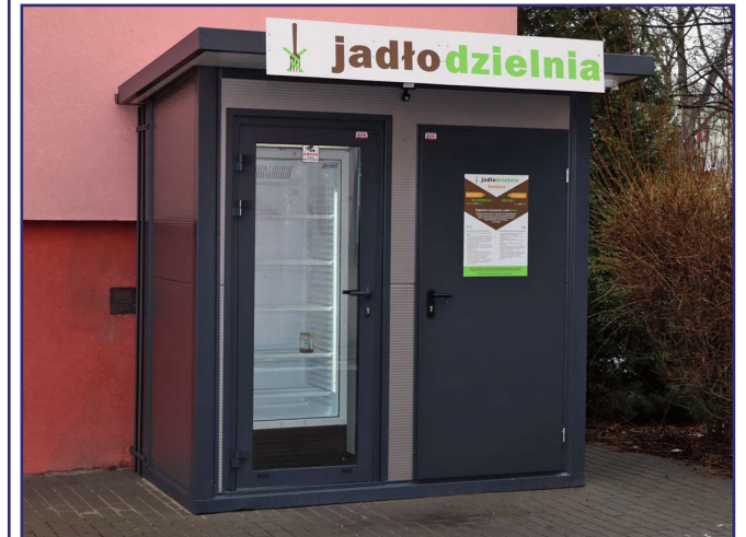
Kwidzyńska Jadłodzielnia znajduje się przy budynku Miejskiego Ośrodka Pomocy Społecznej przy ul. Grudziądzkiej.

Każdy, kto zastanawia się co zrobić z nadmiarem żywności, może już dzisiaj zdecydować o umieszczeniu produktów w Kwidzyńskiej Jadłodzielni, znajdującej się przy budynku Miejskiego Ośrodka Pomocy Społecznej przy ul. Grudziądzkiej. To projekt mieszkańców miasta zrealizowany w ramach Kwidzyńskiego Budżetu Obywatelskiego.