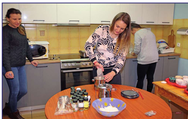
Świece sojowe tworzone od podstaw na bazie naturalnych produktów, w tym zapachowych olejków.