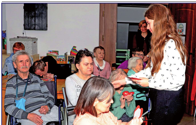
Uczniowie wręczyli mieszkańcom domu serduszka z życzeniami.