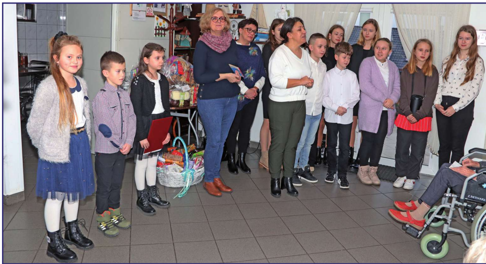
Noworoczne życzenia i podarunki przywieźli uczniowie Szkoły Podstawowej w Korzeniewie dla mieszkańców Domu Pomocy Społecznej w Kwidzynie.

- Pandemia nie pozwalała nam odwiedzać mieszkańców domu i bardzo się cieszę, że możemy być tutaj ponownie. Samotność to coś, co najbardziej doskwiera wielu mieszkańcom, dlatego nasi uczniowie starają się dzielić z osobami samotnymi swoją radością. Uczniowie, którzy wystąpili przed mieszkańcami domu odwiedzili mieszkańców Domu Pomocy Społecznej, gdy uczęszczali do trzeciej klasy. Wtedy dzwoniłmy do rodziców i dosłownie w jeden dzień zebraliśmy podarunki dla mieszkańców domu. Podobnie było także teraz, rodzice bardzo szybko zareagowali na nasz apel i w krótkim czasie zebraliśmy podarunki dla mieszkańców domu. Całe życie pracuję na wsi i uważam,