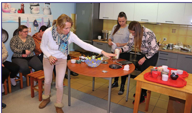
Zdobyte wiedza i umiejętności posłużą do tworzenia unikalnych świec, które pojawią się podczas tradycyjnego, wielkanocnego kermasu, organizowanego przez Warsztat Terapii Zajęciowej w Górkach.