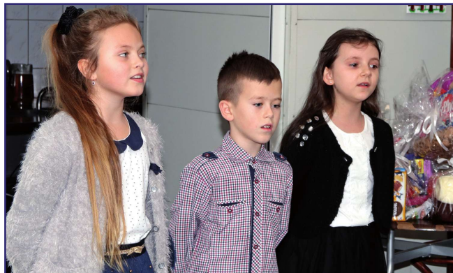
Uczniowie zaśpiewali pastorałki dla mieszkańców domu.