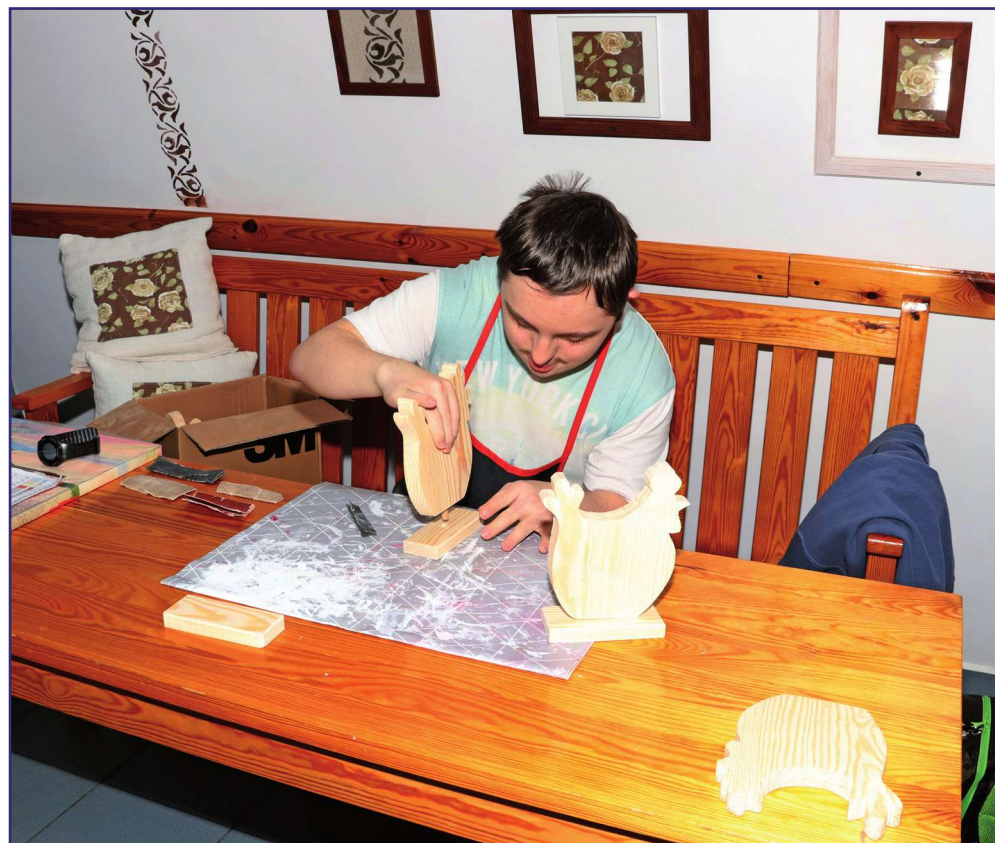
Kiermasz rozpocznie się 20 marca i zakończy 1 kwietnia w zabytkowym dworku w Górkach, siedzibie Warsztatu Terapii Zajęciowej.

życia codziennego, plastyczna, ceramiczna, artystyczna, edukacyjno-stolarska, komputerowa, wiklinarska, redakcyjna, ogrodniczogospodarcza oraz gabinet rehabilitacji. Obecnie w zajęciach terapeutycznych uczestniczy 47 niepełnosprawnych osób. Warsztat Terapii Zajęciowej funkcjonuje od poniedziałku do piątku, w godz. 7.00-15.00.