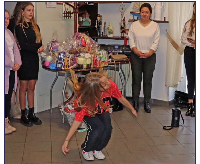
Jedna z uczennic Szkoły Podstawowej w Korzeniewie przygotowała pokaz taneczny.