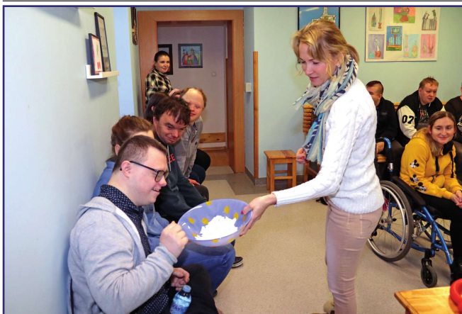
Uczestnicy warsztatów mogli poznać wszystkie etapy tworzenia świec.