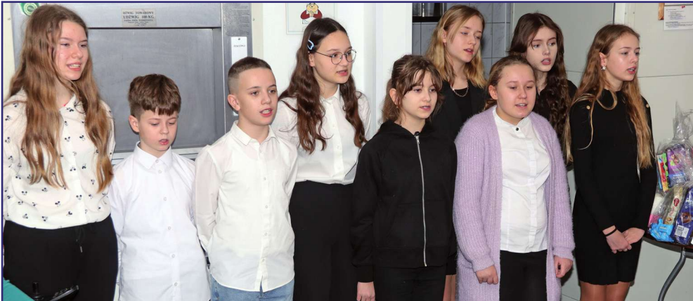
Uczniowie odwiedzili mieszkańców po ponad dwuletniej przerwie spowodowanej pandemią koronawirusa.