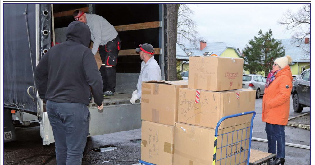
Część darów przekazana została także do innych placówek, w tym do Hospicjum im. Św. Wojciecha w Kwidzynie, Domu Pomocy Społecznej „Słoneczne Wzgórze” w Ryjewie oraz Centrum Domów dla Dzieci w Kwidzynie.