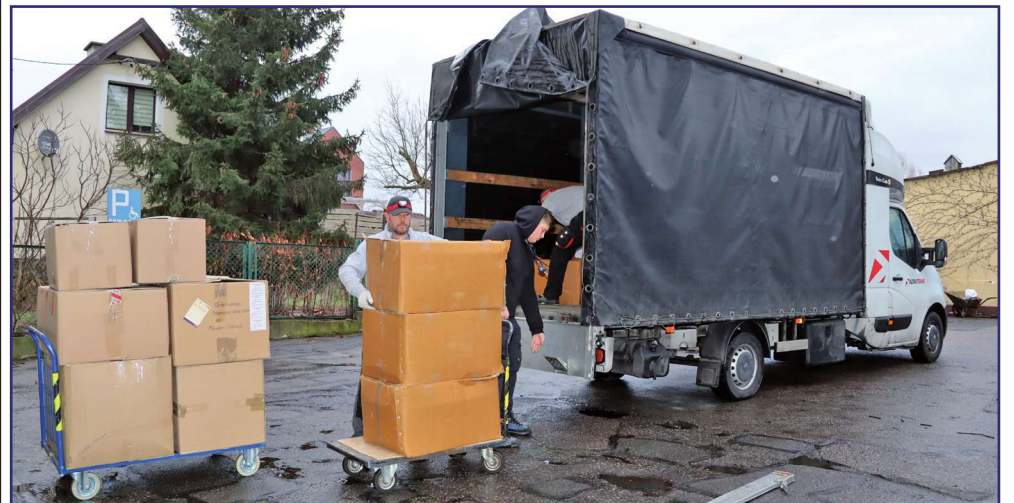
Nowe ręczniki, pościel, kołdry, poduszki oraz odzież robocza to dary Zakonu Joannitów, które dotarły do Domu Pomocy Społecznej w Kwidzynie.