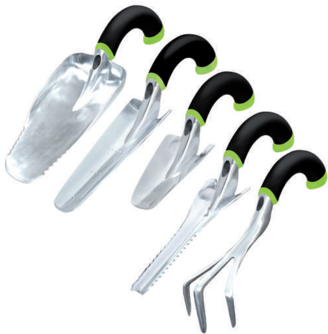
Zestaw ergonomicznych narzędzi ogrodniczych.

genów. Większość aplikacji pogodowych jest darmowa i może wyświetlać reklamy, aby generować dochody dla ich autorów. Są też aplikacje płatne oraz takie, które można pobrać za darmo i opcjonalnie wnieść jednorazową lub cykliczną opłatę,