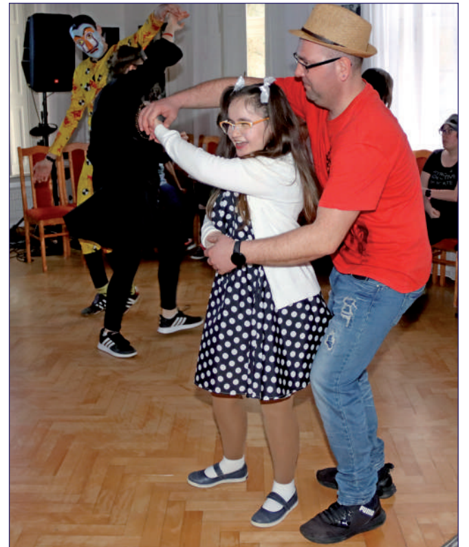
Uczestnicy Warsztatu Terapii Zajęciowej w Górkach bawili się podczas zabawy karnawałowej.