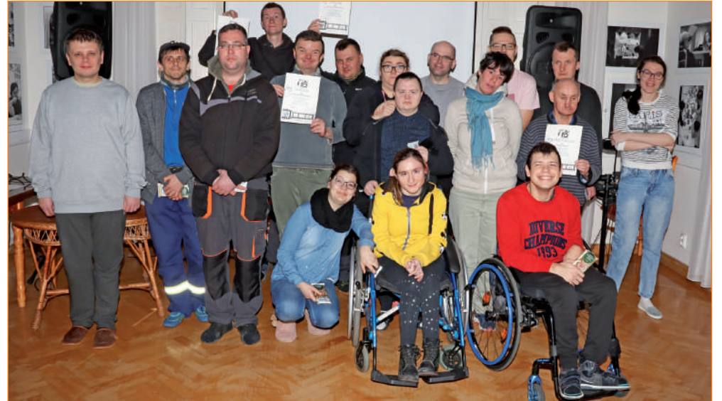
Uczestnicy konkursu fotograficznego organizowanego w Warsztacie Terapii Zajęciowej w Górkach, który prowadzi Fundacja „Misericordia”.