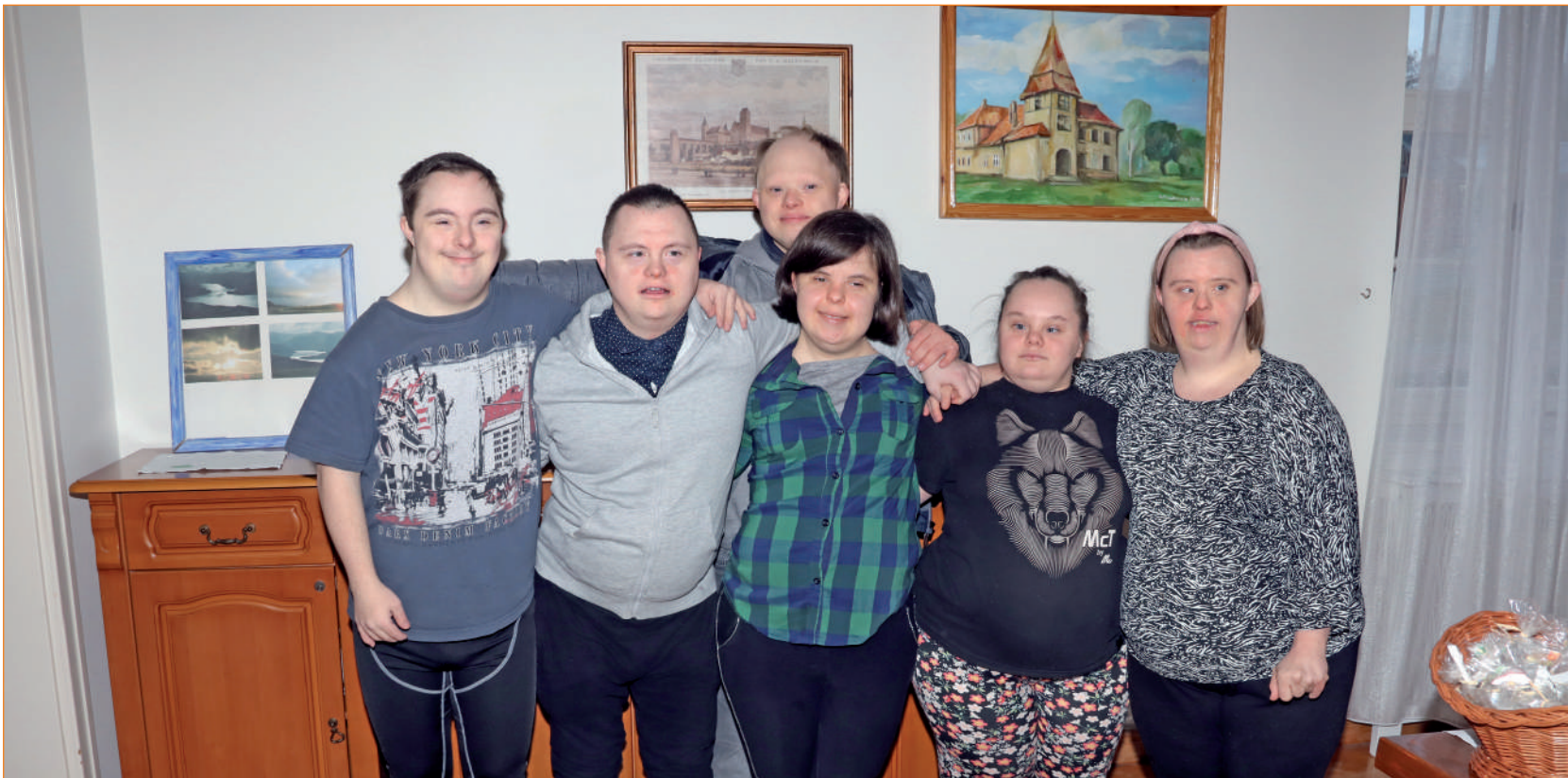
21 marca obchodzono Światowy Dzień Zespołu Downa, podczas którego przypomina się, że osoby z zespołem Downa są tak samo czujące i dążące do samodzielności jak każdy i nikt nie ma prawa spychać ich na margines życia.