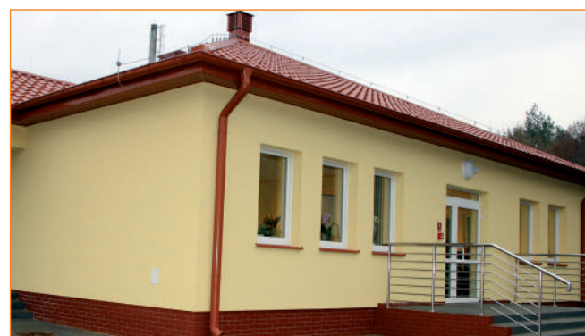
Stowarzyszenie Pomocy Społecznej „Słoneczne Wzgórze” prowadzi Warsztat Terapii Zajęciowej w Ryjewie.

- Przekazanie nam 1,5% Twojego podatku nie kosztuje, a nam pozwoli lepiej wspierać osoby niepełnosprawne. Przy rozliczaniu PIT podaj nr KRS 0000202357