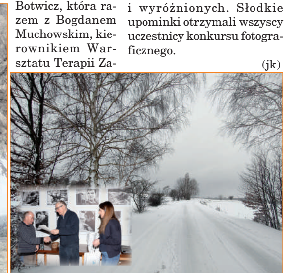
Piotr Baran wykonał zimową fotografię, która została wyróżniona przez jury.