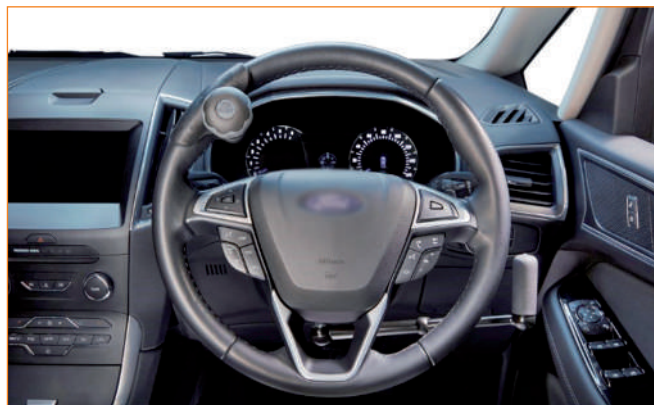
Gałka na kierownicy.

Dźwignię wystarczy pociągnąć do tyłu, aby przyspieszyć lub do przodu, aby zahamować.