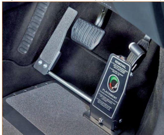
Urządzenie umożliwiające obsługę pedału gazu lewą stopą.

Rozmieszczenie przełączników do obsługi elementów wyposażenia samochodu takich jak światła, kierunkowskazy i wycieraczki może utrudniać