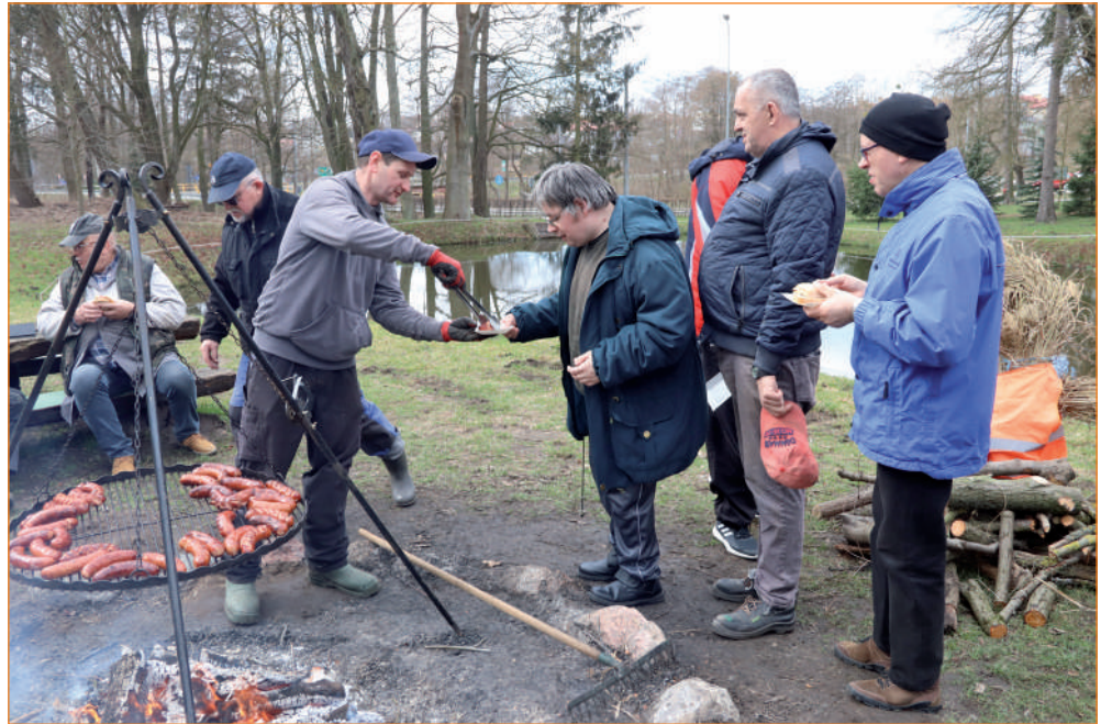
Uczestnicy Warsztatu Terapii Zajęciowej w Górkach, prowadzonego przez Fundację „Misericordia” powitali wiosnę przy ognisku.

Uczestnicy Warsztatu Terapii Zajęciowej w Górkach, prowadzonego przez Fundację „Misericordia” powitali wiosnę przy ognisku. Marzanna wprawdzie została przygotowana, ale zaniechano tradycyjnego topienia. Nie zabrakło pieczonych kiełbasek i dobrego humoru.