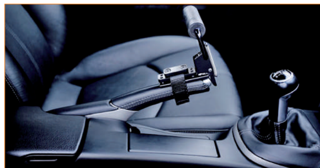
Uchwyt na dźwignię hamulca ręcznego.

Urządzenie umożliwia również obsługę kierunkowskazów, dzięki czemu kierowca może