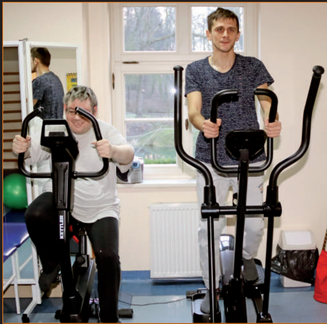
Ponad 2,5 mln zł to kwota, która przeznaczona zostanie na funkcjonowanie warsztatów terapii zajęciowej w Górkach i Ryjewie.

Zgodnie z wnioskiem dyrektora Powiatowego Urzędu Pracy w Kwidzynie na realizację zadań z zakresu rehabilitacji zawodowej przeznaczona zostanie kwota 100 tys. zł, w tym 50 tys. zł proponuje się przeznaczyć na zwrot kosztów wyposażenia stanowiska pracy osoby niepełnosprawnej oraz 50 tys. zł na podjęcie działalności gospodarczej lub rolniczej albo wniesienie wkładu do spółdzielni socjalnej. Po uwzględnieniu kwoty ponad 2 mln 583 tys. zł na dofinansowanie warsztatów terapii zajęciowej oraz 100 tys. zł na rehabilitację zawodową, na pozostałe zadania powiatu z zakresu rehabilitacji społecznej przeznaczona zostanie kwota ponad 1 mln 292 tys. zł. Podział środków został omówiony z Powiatową Społeczną Radą ds. Osób Nie-