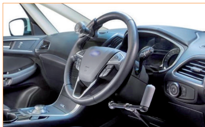
Urządzenie do obsługi pedałów ręką.