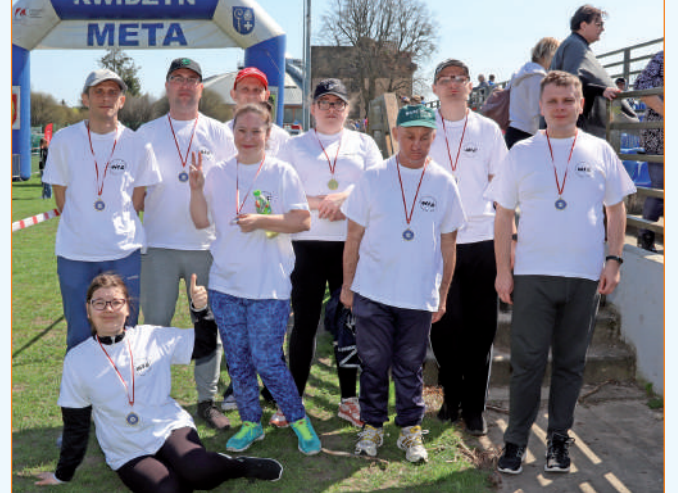
Po raz osiemnasty w biegu dla niepełnosprawnych uczestniczyła reprezentacja Warsztatu Terapii Zajęciowej w Górkach (gmina Kwidzyn) prowadzonego przez Fundację „Misericordia”.