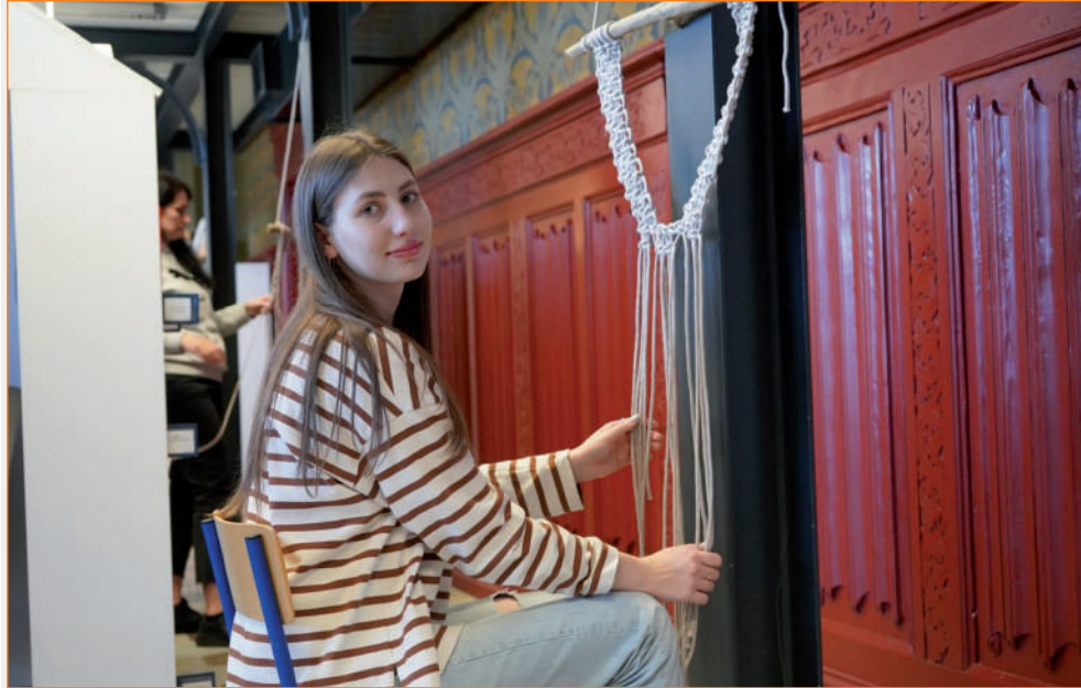
W Bibliotece Miejsko-Powiatowej w Kwidzynie odbyły się warsztaty rękodzielnicze. To jedno z wielu przedsięwzięć, realizowanych w ramach projektu „Pomorskie z Ukrainą, Powiat Kwidzyński z Ukrainą”.

W Bibliotece Miejsko-Powiatowej w Kwidzynie odbyły się Warsztaty rękodzielnicze. To jedno z wielu przedsięwzięć, realizowanych w ramach projektu „Pomorskie z Ukrainą, Powiat Kwidzyński z Ukrainą”.