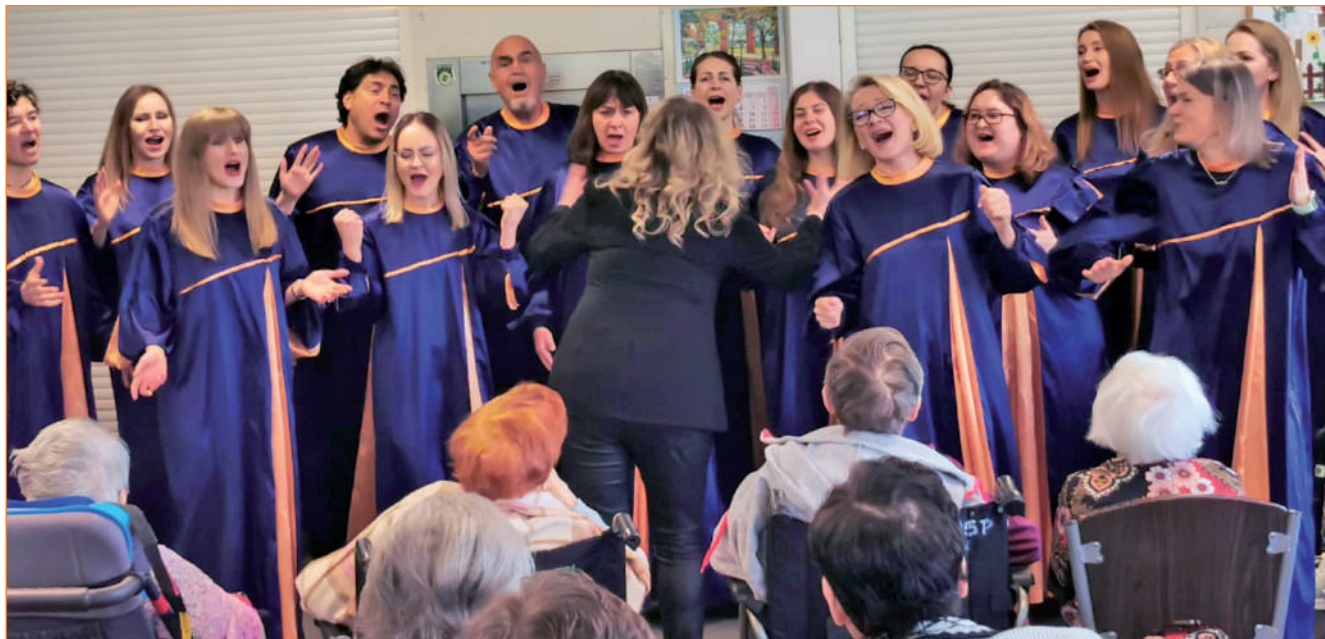
Chór Grace Gospel Choir z Sopotu wystąpił dla mieszkańców Domu Pomocy Społecznej oraz pacjentów Hospicjum im. Św. Wojciecha w Kwidzynie.