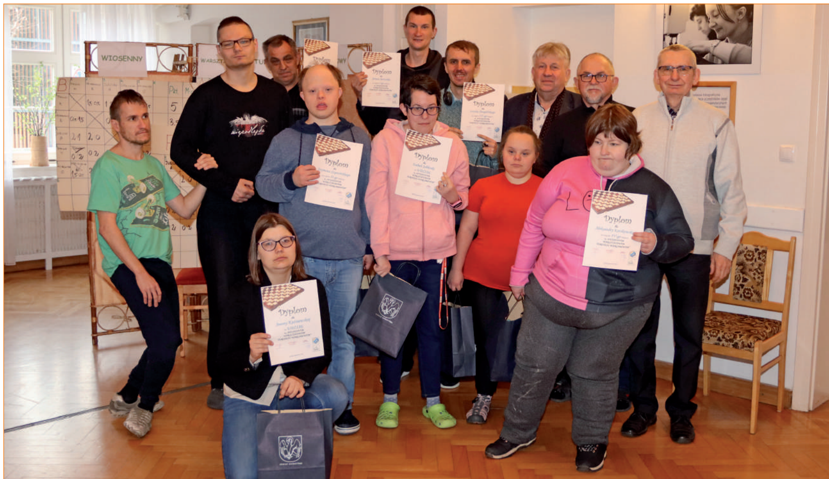
Uczestnicy i organizatorzy Wiosennego Warsztatowego Turnieju Warcabowego, który odbył się w zabytkowym dworku w Górkach, siedzibie Warsztatu Terapii Zajęciowej.