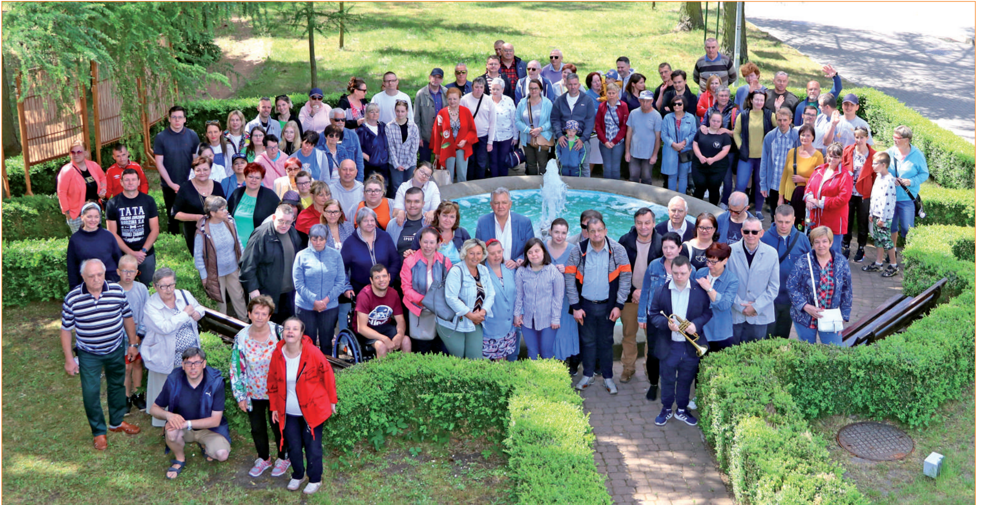
Uczestnicy Warsztatu Terapii Zajęciowej w Górkach, w gminie Kwidzyn, bawili się wraz ze swoimi rodzinami podczas pikniku, który odbył się w parku przy zabytkowym dworku. Dworek jest siedzibą warsztatu, prowadzonego przez Fundację „Misericordia”.