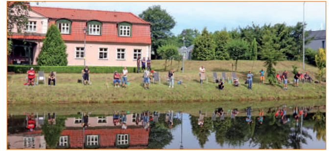
Po złowieniu i policzeniu ryby wróciły do stawu.