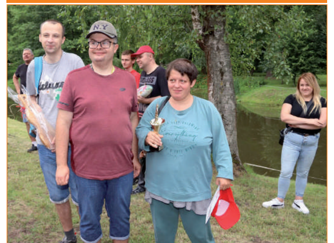
Drugie miejsce zajęli wędkarze z Koniecwałdu (powiat sztumski).