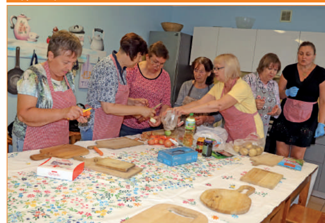
Grupa Ukraińek przygotowuje składniki potrzebne do ugotowania zupy.