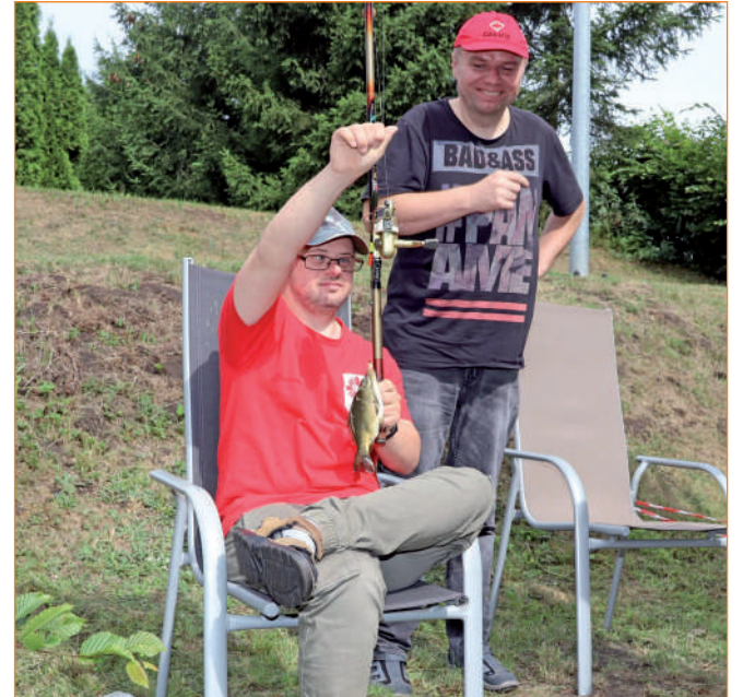
Rywalizacja polegała na złowieniu jak największej liczby ryb w ciągu dwóch godzin.