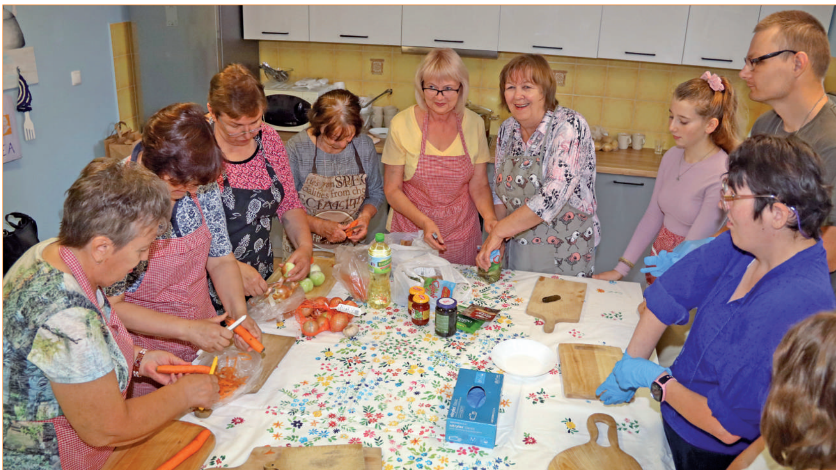
Ukraińki postanowiły ugotować soliankę, zupę popularną w niektórych regionach Ukrainy. W przygotowaniu składników potrzebnych do ugotowania zupy pomagali niepełnosprawni uczestnicy Warsztatu Terapii Zajęciowej w Górkach.