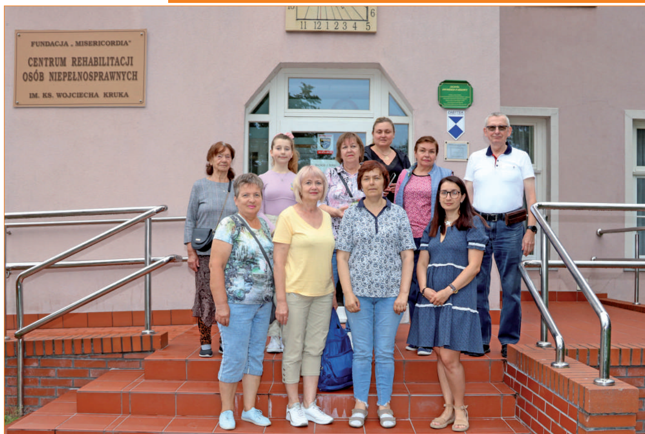
Grupa Ukraińek, które przebywają w powiecie kwidzyńskim z powodu napaści Rosji na Ukrainę odwiedziła Warsztat Terapii Zajęciowej w Górkach, prowadzony przez Fundację „Misericordia”. Ukraińki od ponad roku uczestniczą w wielu różnych projektach, realizowanych przez Fundację M.A.P.A. Obywatelska. Na zdjęciu z gospodarzami obiektu.