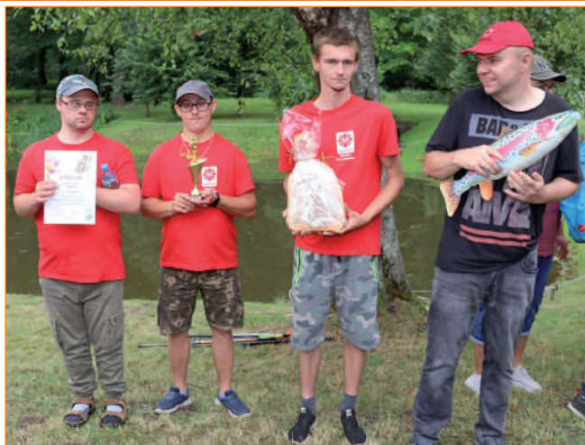
Na trzecim stopniu podium stanęli wędkarze ze Skórcza (powiat starogardzki).