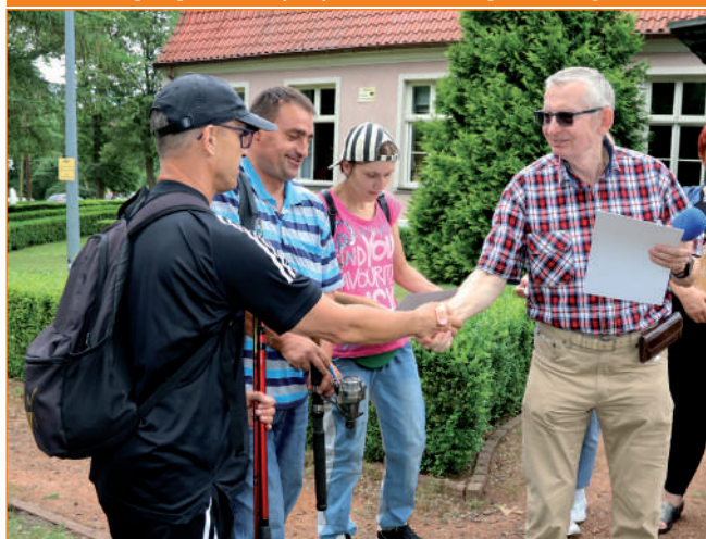
Wędkarze z WTZ w Ryjewie zajęli czwarte miejsce.