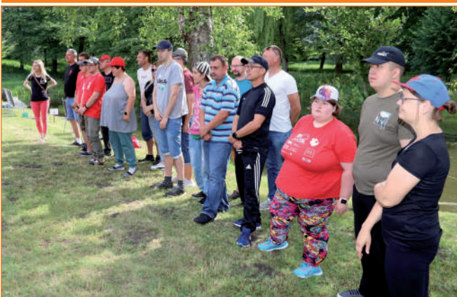
W zawodach wzięły udział reprezentacje warsztatów z powiatów sztumskiego, starogardzkiego i kwidzyńskiego.