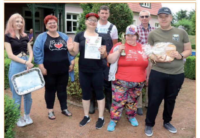
Najwięcej ryb udało się złowić reprezentacji WTZ w Górkach. Na zdjęciu z organizatorami zawodów i wolontariuszami.