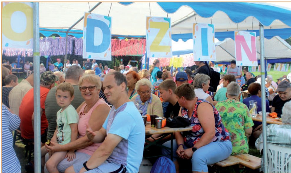
To już dwudzieste szóste Spotkanie Rodzin Mieszkańców Domu Pomocy Społecznej „Słoneczne Wzgórze” w Ryjewie.

- Syn jednej z mieszkanki naszego domu po raz pierwszy od czasu wczesnego dzieciństwa spotkał się z mamą. Wichry rodzinnej historii tak zamieszały w