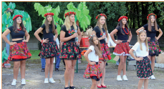
Spotkanie uświetnił występ zespołu wokально-tanecznego „Świetliki”.