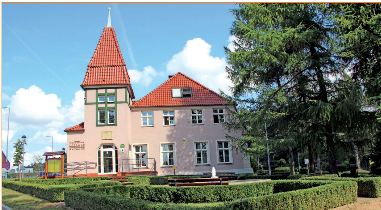
„30 lat działalności WTZ w Kwidzynie - kierunki rozwoju i nowe wyzwania” – pod takim tytułem 29 września w zabytkowym dworku w Górkach odbędzie się konferencja, podczas której podsumowana zostanie dotychczasowa działalność warsztatu. Dworek w gminie Kwidzyn od 2004 jest siedzibą WTZ.