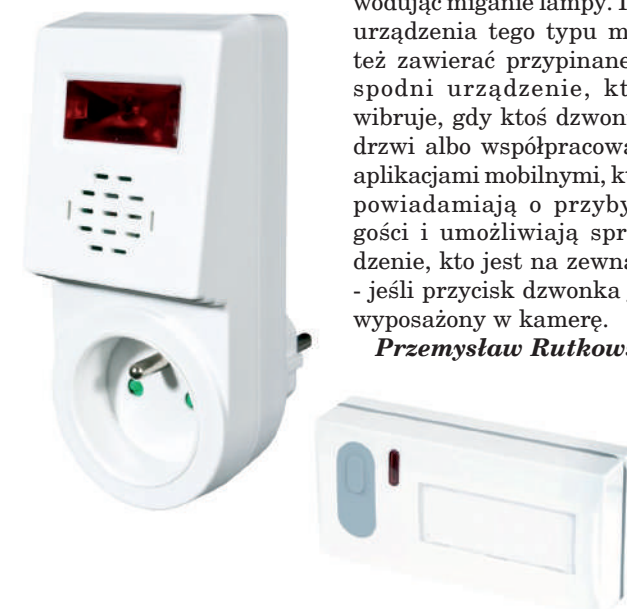
Dzwonek do drzwi dla osób niesłyszących BZ3-1S.