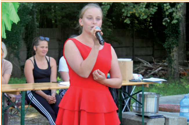
Podczas imprezy nie zabrakło wokalnych występów i dobrej zabawy.