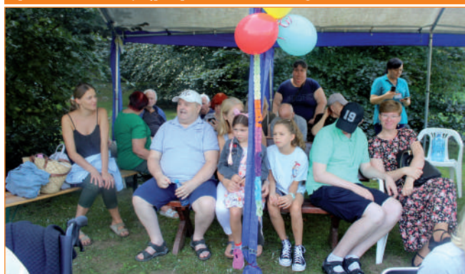
Na spotkanie licznie przybyli bliscy, krewni, przyjaciele i znajomi mieszkańców domu.