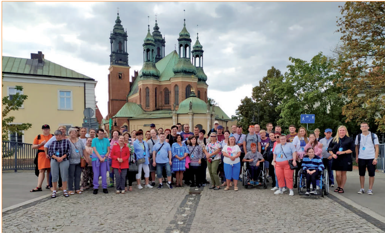
Uczestnicy Warsztatu Terapii Zajęciowej w Górkach, prowadzonego przez Fundację „Misericordia”, wyjechali na dwudniową wycieczkę do Poznania. Wyjazd ten pozwolił im poznać nowe ciekawe miejsca w Polsce i oderwać się od codziennej rutyny.

Uczestnicy Warsztatu Terapii Zajęciowej w Górkach, prowadzonego przez Fundację „Misericordia”, wyjechali na dwudniową wycieczkę do Poznania. Wyjazd ten pozwolił im poznać nowe ciekawe miejsca w Polsce i oderwać się od codziennej rutyny. Po drodze uczestnicy odwiedzili pałac w Rogalinie, w którym zostali oprowadzeni przez przewodnika i spędzili czas w pałacowym ogrodzie.