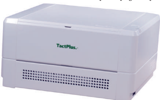
Drukarka brajlowska TactPlus.

Aby poprawić jakość życia osobom niewidomym i niedowidzącym, firma Kanematsu USA stworzyła nowoczesną drukarkę