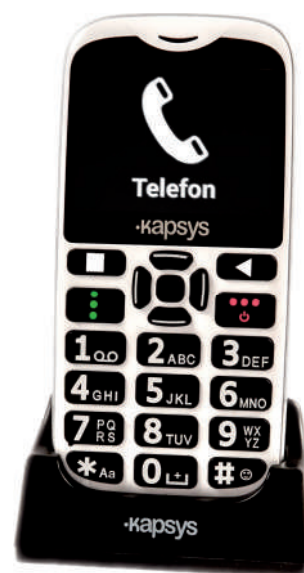
Telefon MiniVision2.

notatnik, kalkulator, radio FM i prognoza pogody, ale ma także kilka innych funkcji ułatwiających codzienne życie osobom niewidomym i niedowidzącym - rozpoznawanie natężenia światła, kolorów i banknotów oraz funkcję „Gdzie jestem?”, która podaje adres, pod którym znajduje się użytkownik. Oprócz klawiatury do obsługi urządzenia można wykorzystywać komendy głosowe - wymaga to jednak połączenia z internetem. Z tyłu telefonu znajduje się przycisk SOS, który uruchamia dźwięk alarmowy oraz wykonuje połączenia telefoniczne i wysyła SMS-y z informacją o położeniu