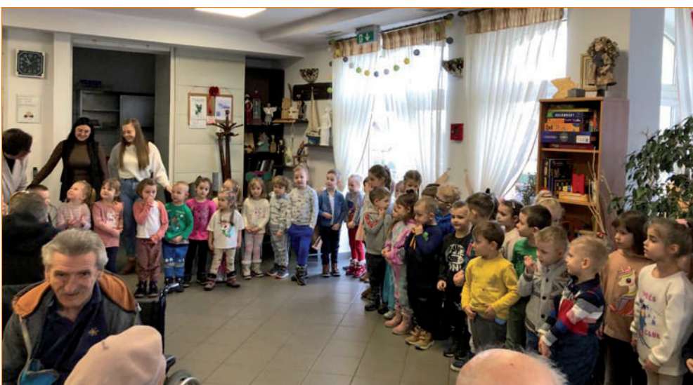
Przedszkolaki z Przedszkola „Smyk” z wizytą u mieszkańców domu.