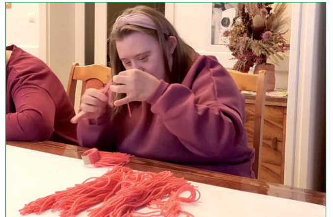
Trwa przygotowywanie różnych wyrobów, które będzie można kupić podczas kiermaszu.