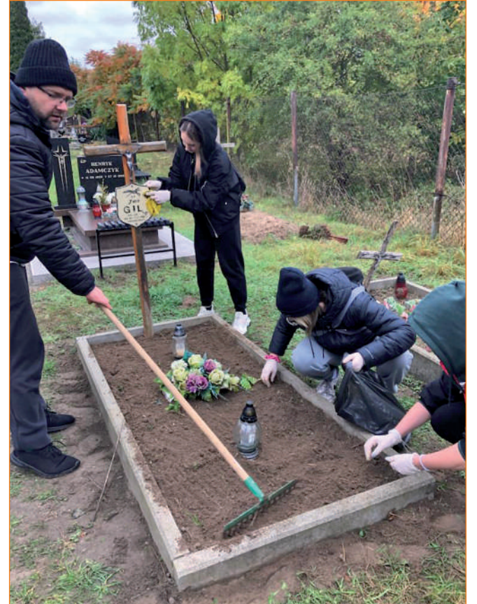
Wolontariusze z Zespołu Szkół nr 2 im. Marii Skłodowskiej Curie w Kwidzynie pomagali posprzątać groby mieszkańców DPS, którzy odeszli.