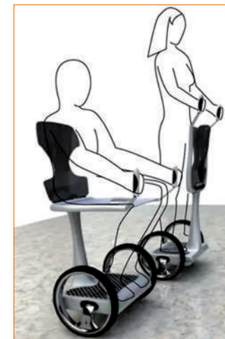
EAZ Disabled Mobility Device

na krótko skierować na niego wiązkę lasera. Czas reakcji na wskaźnik laserowy można skonfigurować. Ergonomiczny układ Lucy4 sprawia, że korzystanie z niej jest łatwe i poradzą