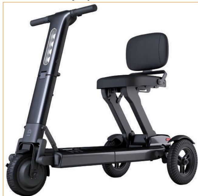
Relync to składany skuter inwalidzki, który zajmuje niewiele miejsca.

To skuter inwalidzki. Jego główne zalety to, że jest składany i zajmuje niewiele miejsca. Sprawia to, że urządzenie można z łatwością zabrać w podróż. Tradycyjne skutery inwalidzkie ważą ponad 100 kilogramów – Relync natomiast waży jedynie 27,5 kilograma wraz z akumulatorami. Kontrola nad pojazdem jest ułatwiona przez czujnik żyroskopowy. Relync porusza się z maksymalną prędkością 6,4 km/h i może pokonywać wzniesienia o maksymalnym kącie 6 stopni. Dwa akumulatory umożliwiają przejechanie do 30 kilometrów na jednym