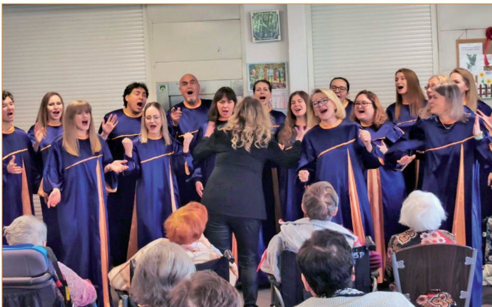
Występ chóru Chór Grace Gospel Choir z Sopotu w Domu Pomocy Społecznej w Kwidzynie

- Obchodzący w tym roku jubileusz 65-lecia działalności ośrodek może być dumny ze swoich wychowanek. To kolejny już rok kiedy można liczyć na ich wsparcie. Seniorów odwiedzali także wolontariuszki z Centrum Aktywności Kreatywnej,