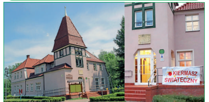
W zabytkowym dworku w Górkach, w gminie Kwidzyn, odbędzie się doroczny kiermasz świąteczny organizowany przez Warsztat Terapii Zajęciowej. Od 28 listopada do 16 grudnia, także w soboty, w godz. 7.30 - 14.30, będzie można kupować oryginalne ozdoby świąteczne.