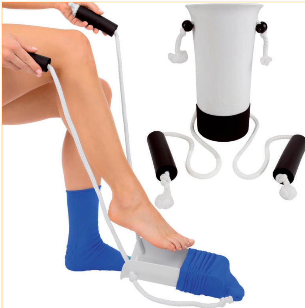
Aksesoria ułatwiające zakładanie skarpet.