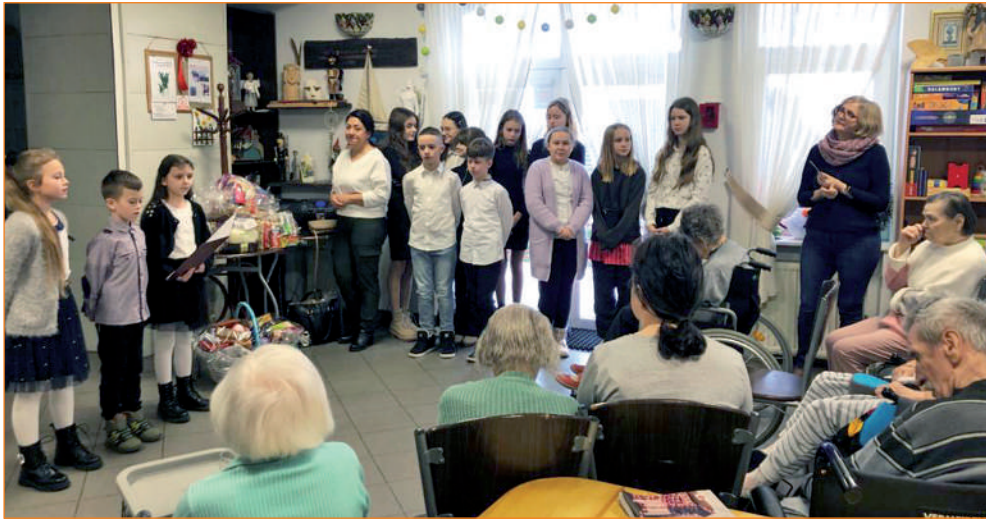
Występ uczniów ze Szkoły Podstawowej w Korzeniewie dla mieszkańców domu.