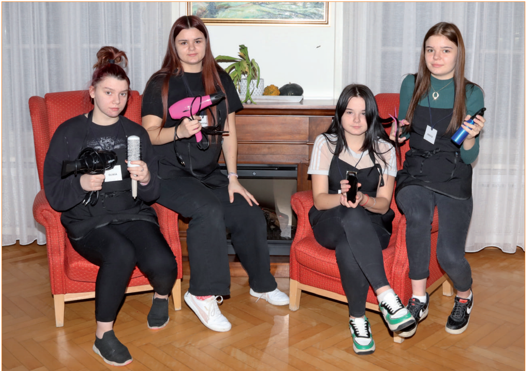
Mobilne Fryzjerki to projekt wychowanek Młodzieżowego Ośrodka Wychowawczego im. Janusza Korczaka w Kwidzynie.

Fryzjerki z MOW rozpoczęły realizację swojego projektu we współpracy z Warsztatem Terapii Zajęciowej w Górkach, prowadzonym przez Fundację „Misericordia”. Przed rozpoczęciem projektu musiały sobie zapewnić odpowiednie narzędzia pracy. Wychowanki ośrodka wzięły udział w Kwidzyńskim Funduszu Inicjatyw Młodzieżowych organizowanym przez Stowarzyszenie Akwedukt i otrzymały dofinansowanie z Urzędu Miasta Kwidzyna oraz Europejskiego Korpusu Solidarności (programu Unii Europejskiej) na zakup niezbędnych przyborów i narzędzi do pracy. Adeptki sztuki fryzjerskiej zaproponowały niepełnosprawnym uczestniczkom i uczestnikom WTZ w Górkach strzyżenie, uczesanie i upięcie włosów, a także farbowanie i pasemka. W ramach projektu wychowanki planują przeprowadzenie ośmiu lub dziewięciu warsztatów fryzjerskich. Cztery z nich zostaną wzbogacone wykładami na temat higieny, pielęgnacji, doboru fryzur i wizażu. Projekt to także sprawdzenie możliwości świadczenia usług poza salonem fryzjerskim. To ostatni rok nauki wychowanek i ostatni rok pobytu w ośrodku. W bieżącym roku szkolnym przyszłe fryzjerki