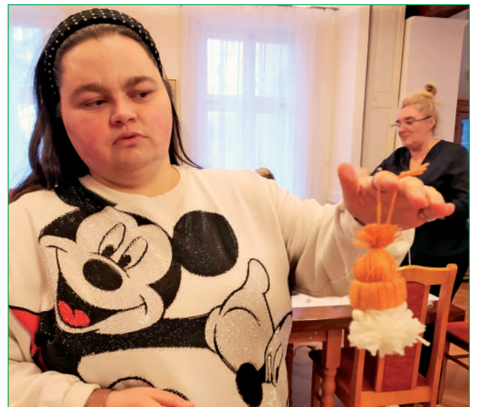
W przygotowaniach do kiermaszu biorą udział uczestnicy WTZ.