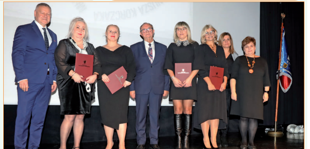
Podczas uroczystości pracownikom ośrodka, w tym wychowawcom i dyrektorowi, wręczone zostały nagrody przyznane przez marszałka województwa pomorskiego.