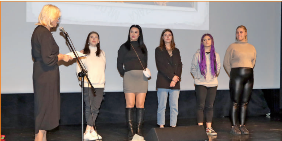
Na uroczystość przybyły także były wychowanki ośrodka, które nie kryły wzruszenia i dziękowały swoim dawnym wychowawcom między innymi za pokazanie właściwej drogi, która doprowadziła je do samodzielności.