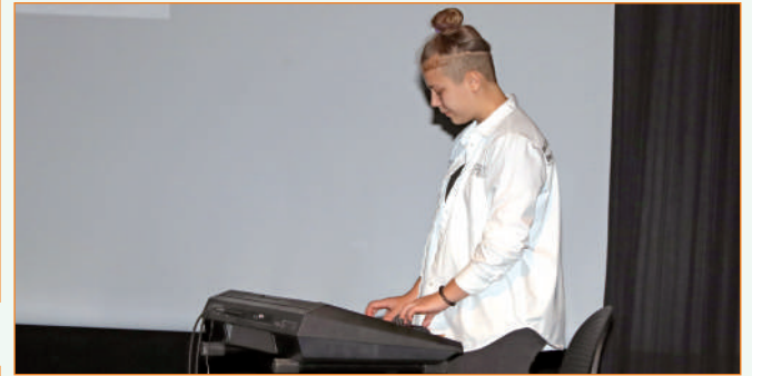
Twórcza resocjalizacja pozwala między innymi rozwijać talenty wychowanków.