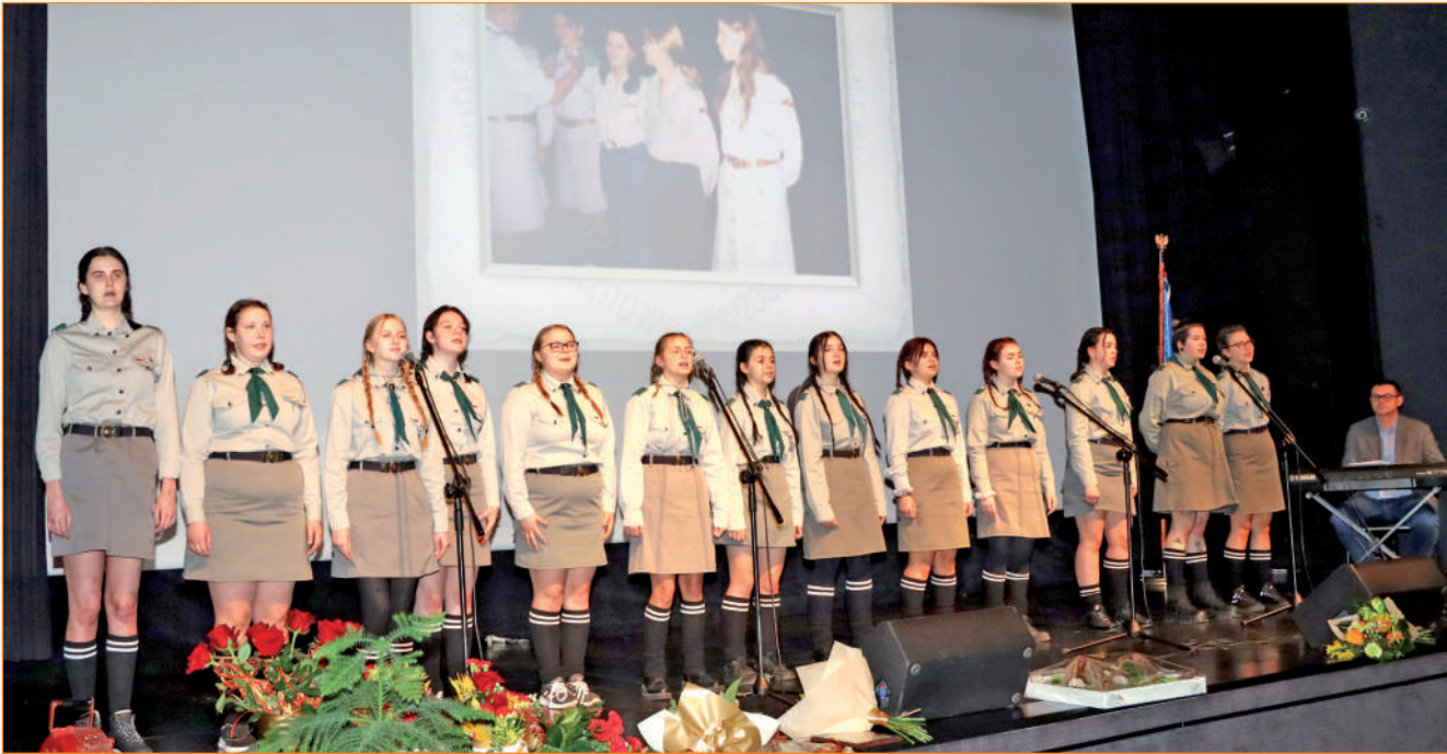
Występ 68 Drużyny Harcerskiej „Wesołe Włóczęgi”. Harcerstwo to jedna z licznych form działalności, w których aktywny udział biorą wychowanki ośrodka.