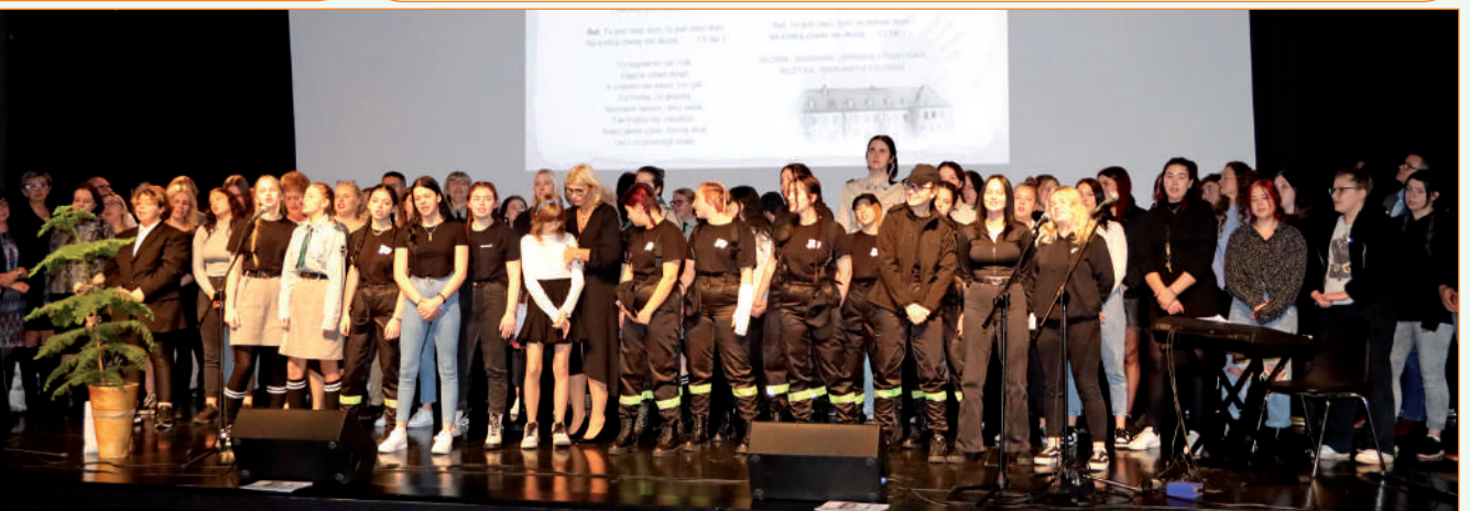
Pracownicy i wychowanki ośrodka na zakończenie gali jubileuszowej zakończyli wspólnym odśpiewaniem hymnu ośrodka.