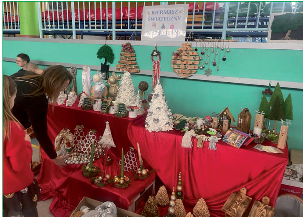
Warsztat Terapii Zajęciowej w Ryjewie uczestniczył w Przeglądzie Potraw i Ozdób Bożonarodzeniowych.

Warsztat Terapii Zajęciowej w Ryjewie uczestniczył w Przeglądzie Potraw i Ozdób Bożonarodzeniowych. Świąteczny kermasz połączony z wigilią gminną odbył się w hali sportowej przy Szkole Podstawowej w Ryjewie.