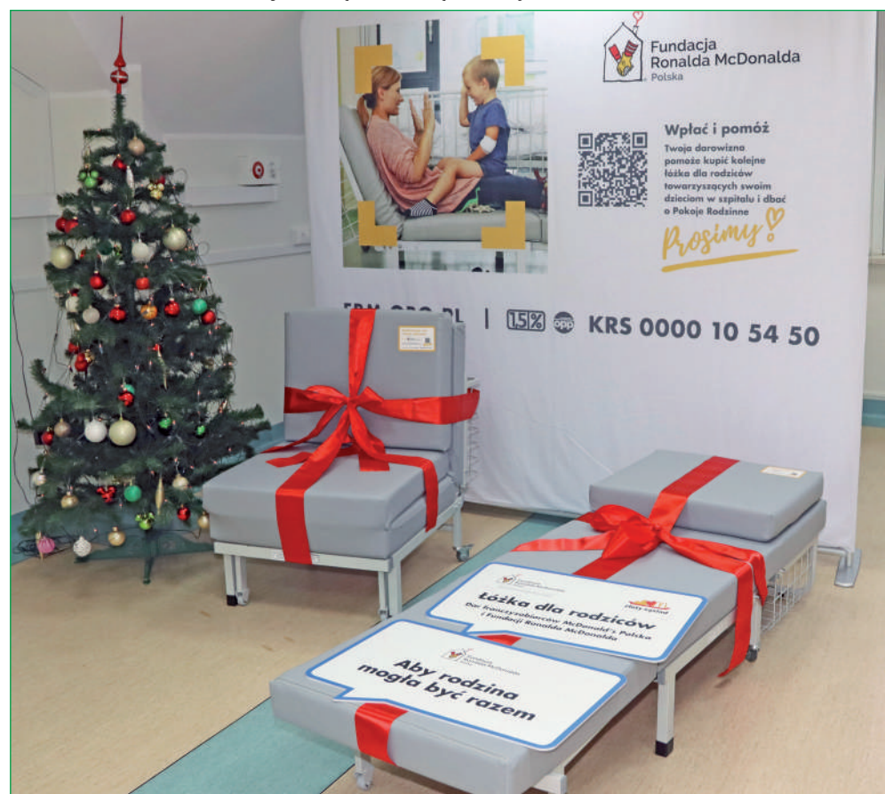
Rodzice, których dzieci trafiły na oddział pediatryczny w kwidzińskim szpitalu, będą mogli korzystać z łóżek podarowanych przez franczyzobiorców McDonald's Polska i Fundację Ronalda McDonalda.