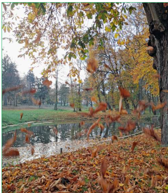
Fotografia Magdaleny Kuter (drugie miejsce w konkursie).