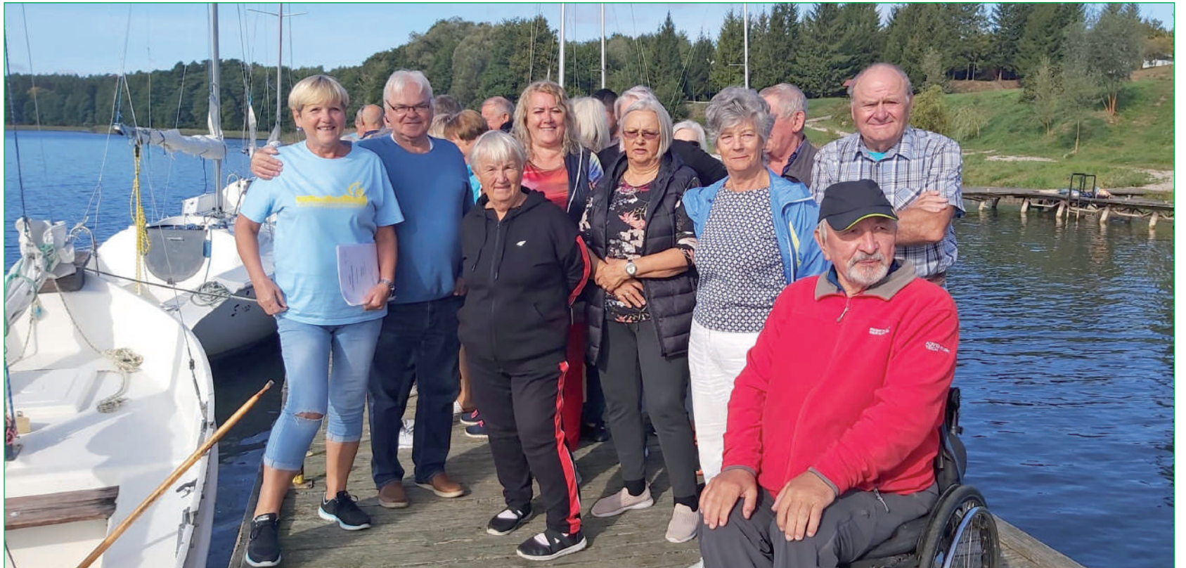
Pomorskie Stowarzyszenie Żeglarzy Niepełnosprawnych w Kwidzynie w mijającym roku było organizatorem warsztatów żeglarskich, które odbyły się w Chorwacji oraz w miejscowości Ryn.

W miejscowości Ryn odbyły się „Warsztaty Żeglarskie i Motorowodne dla osób z niepełnosprawnością”. Ich uczestnicy przebywali w Ośrodku Młodzieżowym „Zofiówka” położonym nad jeziorem Ryn. W warsztatach