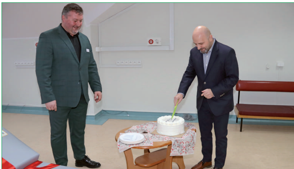
Słodkie podziękowanie szpitala za podarowane przez franczyzobiorców McDonald's Polska i Fundację Ronalda McDonalda.

Przypomniał także, że Fundacja Ronalda McDonalda buduje w bezpośrednim sąsiedztwie szpitali domy, które są bezpłatnymi hotelami dla rodziców hospitalizowanych dzieci. W Polsce funkcjonują dwa Domy Ronalda McDonalda: przy Uniwersyteckim Szpitalu Dziecięcym w Krakowie i Dziecięcym Szpitalu Klinicznym UCK WUM w Warszawie. W tym roku rozpoczęła się budowa trzeciego Domu Ronalda McDonalda przy Instytucie „Pomnik-Centrum Zdrowia Dziecka”. Domy budowane są, prowadzone i w całości finansowane przez Fundację Ronalda McDonalda. Obecnie na całym świecie działa ponad 380 takich domów. Każdego roku fundacja pomaga ok. 9 mln dzieci oraz ich rodzinom na całym świecie. (jk)