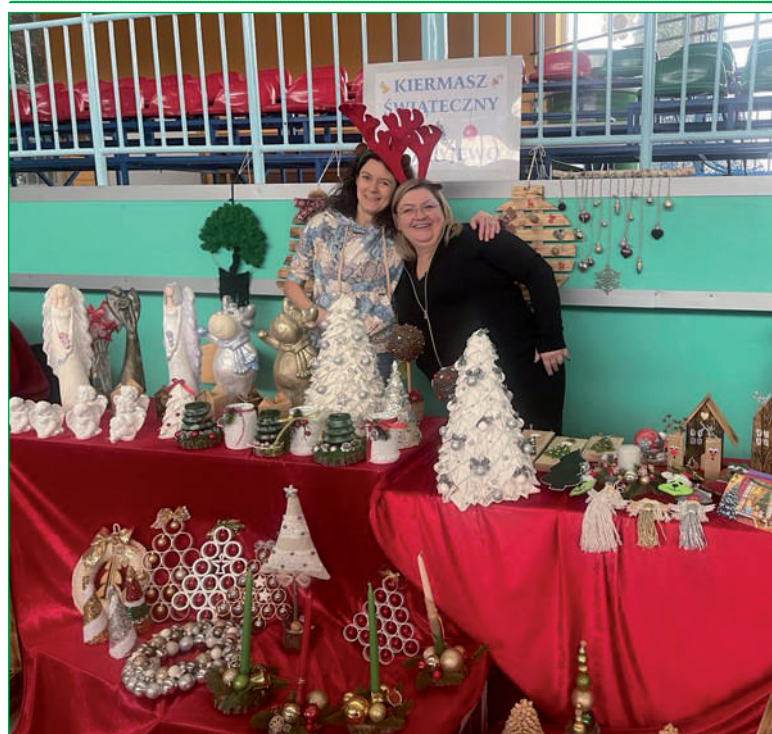
Świąteczny kermasz odbył się w hali sportowej przy Szkole Podstawowej w Ryjewie.

Podczas wydarzenia można było kupić nie tylko ozdoby świąteczne, ale także wypieki i potrawy świąteczne. W kermaszu, oprócz WTZ w Ryjewie, prowadzonym przez Stowarzyszenie Pomocy Społecznej „Słoneczne Wzgórze”, uczestniczyli: Koło Gospodyń Wiejskich z Małowskich Pastwisk, Koło Gospodyń Wiejskich „Ryjewianki” z Ryjewa, Koło Gospodyń Wiejskich z Trzciana, Koło Gospodyń Wiejskich „Rudniczanki” z Rudnik i Koło Gospodyń Wiejskich „Renawa” z Benowa, Niepubliczne Przedszkole „Pod Dębusiem” w Ryjewie oraz Stowarzyszenie na rzecz Bezdomnych Dom Modlitwy „Agape” w Borowym Młynie. Swoje wyroby zaprezentowały również osoby indywidualne. Organizatorzy kermaszu to Gminny Ośrodek Kultury w Ryjewie, Urząd Gminy Ryjewo, Niezależny Klub Samorządowy Rady Gminy Ryjewo, Soltys i Rada Sołecka Sołectwa Ryjewo.