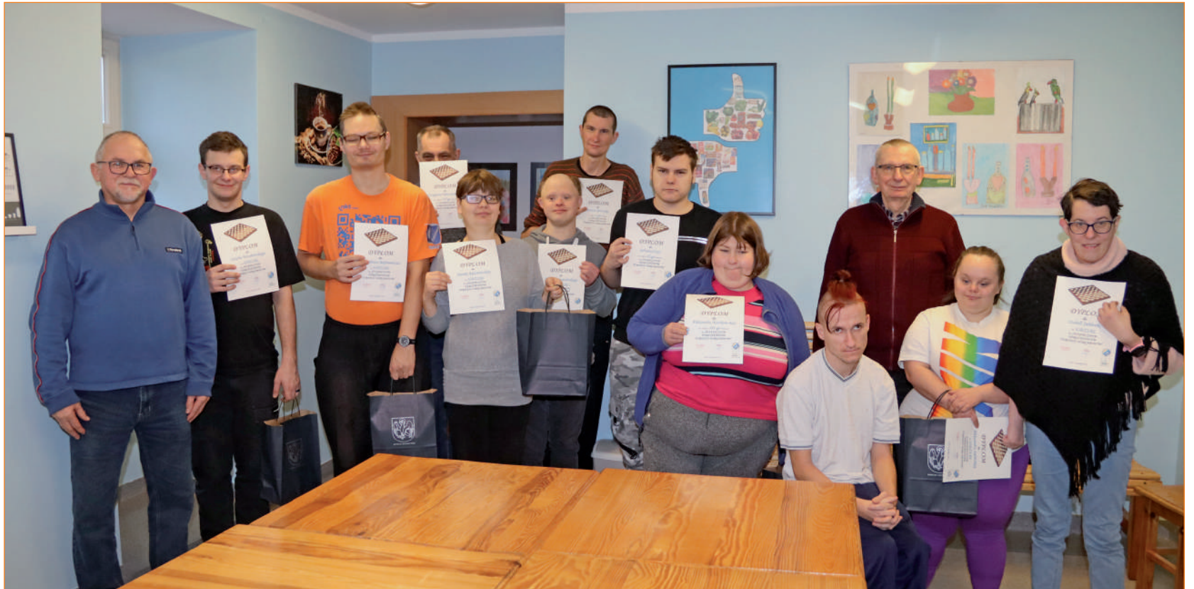
► Uczestnicy i organizatorzy Świątecznego Turnieju Warcabowego. Rywalizacja warcabistów w Warsztacie Terapii Zajęciowej, prowadzonym przez Fundację „Misericordia”, trwa już od wielu lat. Zawody organizowane są dwa razy do roku, zwykle wiosną i jesienią. Tym razem jednak okres świąteczno-karnawałowy zgromadził najbardziej zapalonych miłośników warcabów.