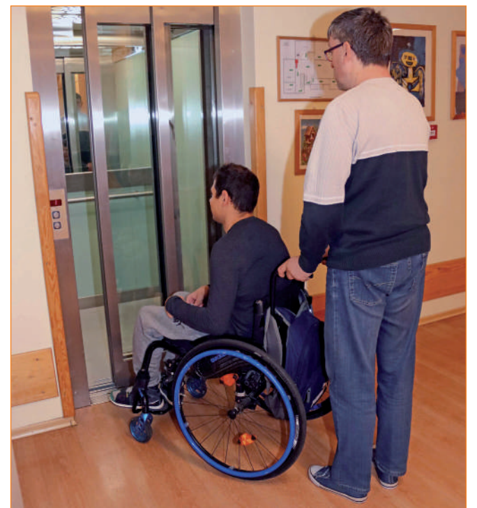
► Samorząd powiatu kwidzyńskiego podjął decyzję o przystąpieniu do realizacji Programu „Asystent osobisty osoby z niepełnosprawnością”

Asystent osobisty pomaga osobom niepełnosprawnym przy wykonywaniu codziennych czynności i funkcjonowaniu w życiu społecznym. To między innymi wyjście do kina, parku, urzędu czy dotarcie na rehabilitację. Kwota, którą samorząd powiatu otrzymał w 2023 roku na realizację programu to ponad 391 tys. zł. Program „Asystent osobisty osoby niepełnosprawnej” był realizowany także przez samorządy gminne w powiecie kwidzyńskim. W ubiegłym roku z pomocy asystenta korzystało 30 niepełnosprawnych mieszkańców powiatu kwidzyńskiego. Wśród osób, które korzystały z usługi asystenta było 15 legitymujących się orzeczeniem o znacznym stopniu niepełnosprawności, w tym niepełnosprawnością sprzężoną, 7 osób legitymujących się orzeczeniem o znacznym stopniu niepełnosprawności, bez niepełnosprawności sprzężonej, 6 osób legitymujących się orzeczeniem o umiarkowanym stopniu