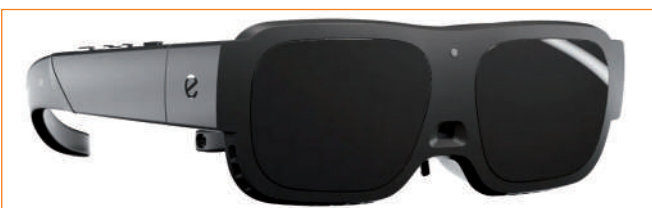
► Okulary eSight Go.