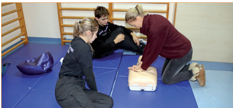
Szkolenie zostało przeprowadzone w ramach współpracy Fundacji „Misericordia” z Komendą Powiatową Państwowej Straży Pożarnej.