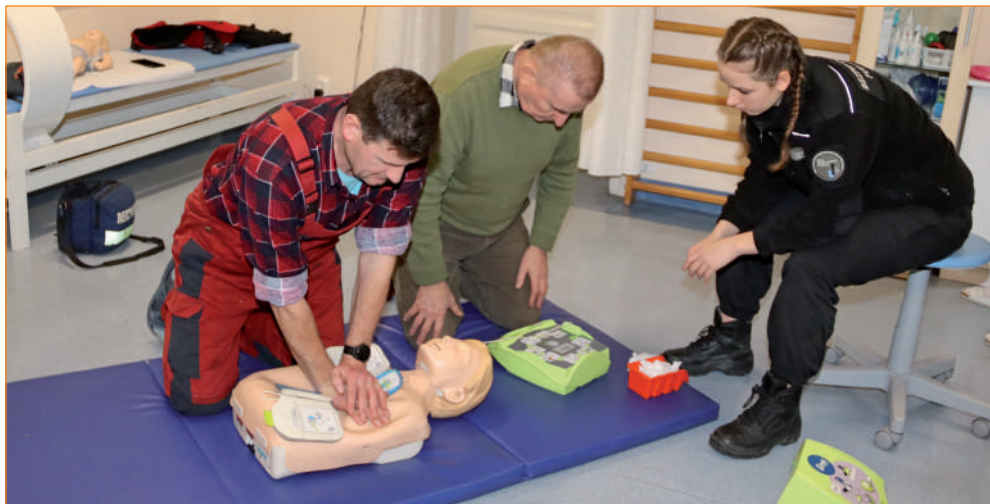
Pracownicy WTZ poznali nie tylko teorię, ale wzięli udział w zajęciach praktycznych podczas których przećwiczyli podstawowe zabiegi resuscytacyjne