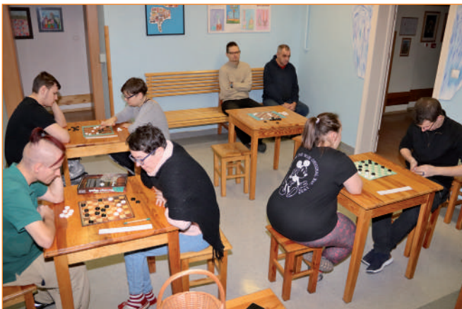
► Okres świąteczno-karnawałowy zgromadził najbardziej zapalonych warcabistów.