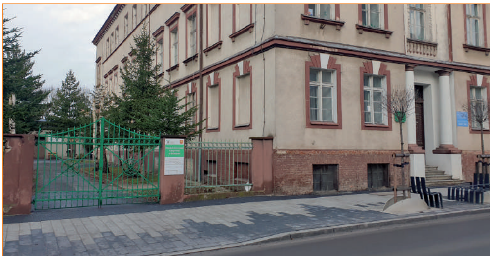
Siedziba Ośrodka Interwencji Kryzysowej mieści się w budynku przy ul. Braterstwa Narodów 59 w Kwidzynie.

Ośrodek Interwencji Kryzysowej w 2024 roku nadal będzie prowadzony przez Fundację „Życie zgodnie” im. Ks. Piotra Świtajskiego z siedzibą w Kwidzynie. Zadanie to, po rozstrzygnięciu otwartego konkursu, zlecił organizacji samorząd powiatu kwidzyńskiego.