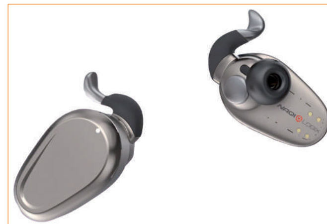
► Słuchawki neuronowe NAQI.