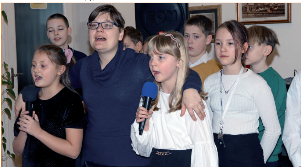
► Spotkania, podczas których będą wspólnie śpiewali uczestnicy Warsztatu Terapii Zajęciowej i uczniowie Szkoły Podstawowej w Korzeniewie, mają być kontynuowane.