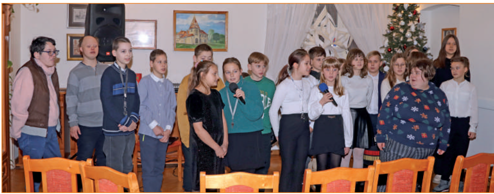
► Uczniowie wraz z uczestnikami Warsztatu Terapii Zajęciowej w Górkach zaśpiewali wiele kolęd i pastorałek.