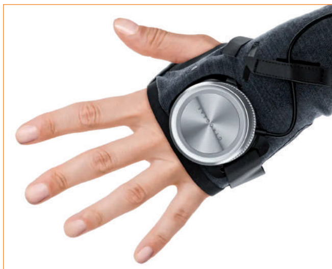
► Rękawica GyroGlove.

wózku inwalidzkim. Użytkownik musi wjechać na platformę tyłem tak, aby tylne koła wózka znalazły się na kołach na platformie i zabezpieczyć wózek – koła te będą poruszane przez koła