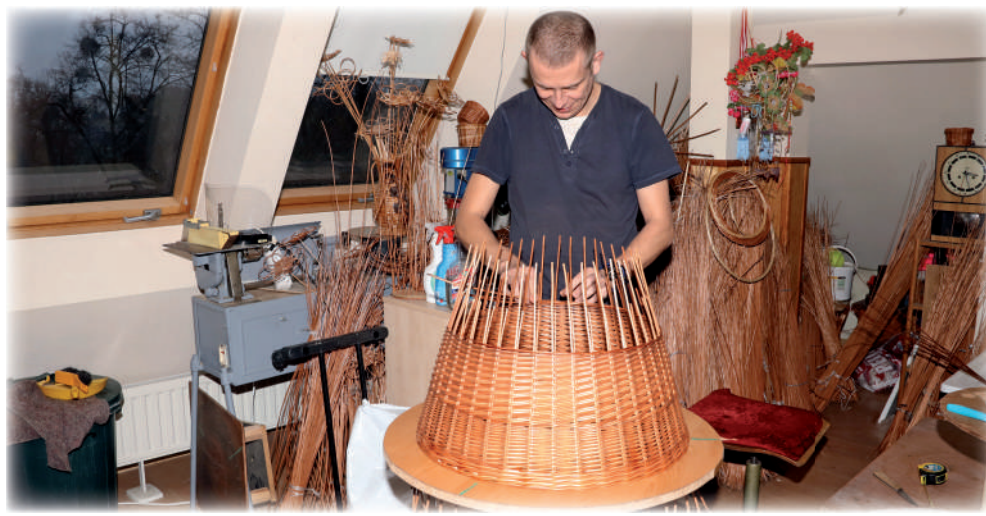
▶ Pracownia wikliniarska to możliwość zdobycia unikalnych umiejętności.

WARSZTAT TERAPII ZAJĘCIOWEJ W KWIDZYNI NIE SIDŹ W DOMU, PRZYJDŹ DO NAS