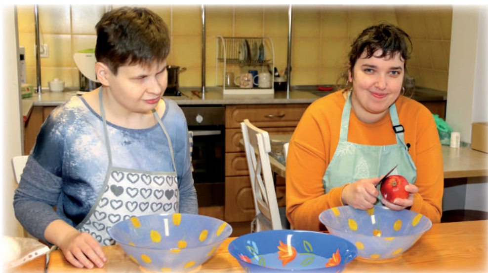
▶ Każdy dzień w pracowni życia codziennego to krok ku samodzielności.

zająć terapeutycznych stosowane są dwie formy rehabilitacji medycznej: kinezyterapia (obejmuje między innymi ćwiczenia gimnastyczne i różne formy czynnego wypoczynku i relaksu) i fizykoterapia (elektroterapia, termoterapia, światłolecznictwo i ultradźwięki, magnetoterapia, laseroterapia). Warsztat to placówka dzienna, działająca od poniedziałku do piątku,