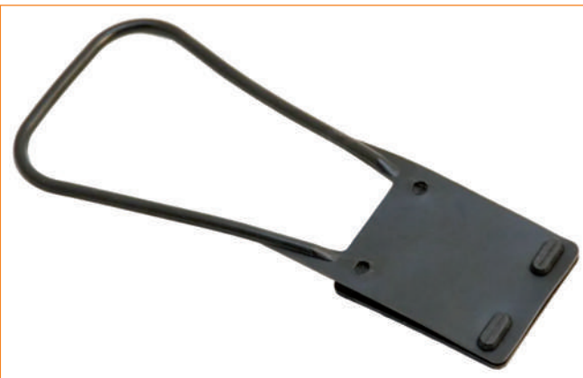
▶ Chwytnak do pasów bezpieczeństwa.