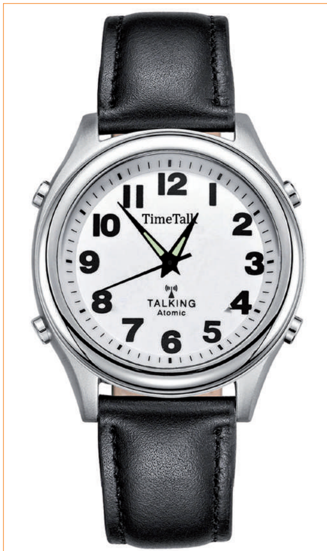
▶ Mówiący zegarek.