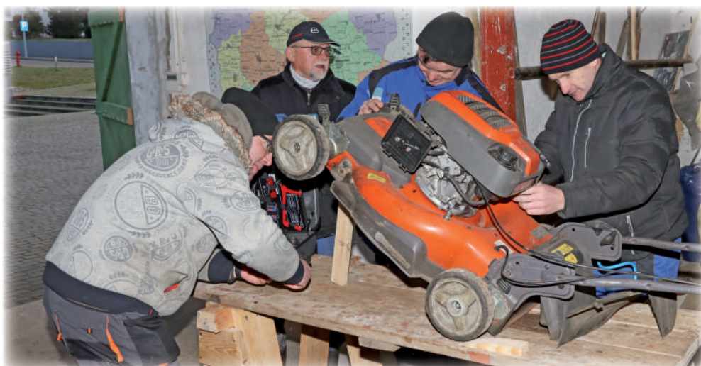
▶ Pracownia ogrodniczo-gospodarcza stwarza możliwość poznania środowiska pracy.

To miejsce dla dorosłych osób niepełnosprawnych, które chcą się usamodzielnic i zdobyć umiejętności, które ułatwią znalezienie zatrudnienia. Warsztat Terapii Zajęciowej w Górkach Fundacji „Misericordia” to placówka, w której prowadzona jest rehabilitacja społeczna i zawodowa dla niepełnosprawnych mieszkańców powiatu kwidzyńskiego. WTZ nie jest świetlicą lub placówką opiekuńczą, w której można umieścić osoby obłożnie chore lub potrzebujące ciągłej i całodobowej opieki.