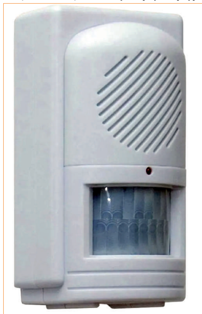
▶ Memo Minder.

ne do ściany urządzenie Memo Minder. Urządzenie jest wyposażone w głośnik i czujnik ruchu. Po wykryciu ruchu odtwarza dowolną nagraną wiadomość – może to być na przykład przypo-