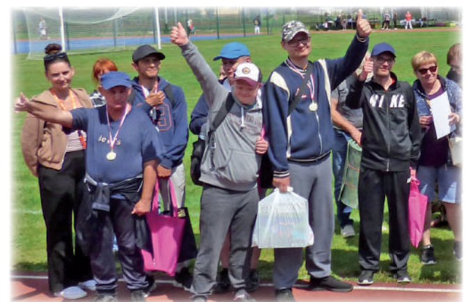
▶ Drużyna Warsztatu Terapii Zajęciowej w Górkach.