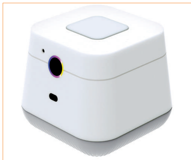
▶ Nomo Smart Care.

rzędzi składający się z lupy, latarki i kalkulatora. Dołączona stacja ładująca ułatwia ładowanie urządzenia i może służyć jako podstawka podczas wideorozmów. Wraz z tabletem otrzymujemy również rysik, który ułatwi obsługę dotykowego ekranu