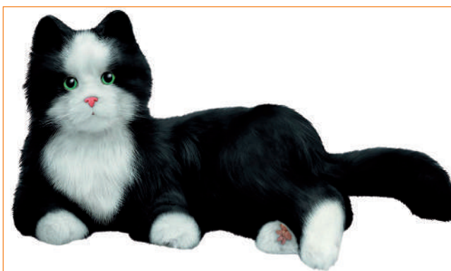
▶ Kot Joy for All.

To korzystający ze sztucznej inteligencji asystent przeznaczony głównie dla seniorów, którzy mieszkają samotnie. W przeciwieństwie do innych podobnych urządzeń ElliQ nie oczekuje biernie na polecenia, tylko samodzielnie nawiązuje kontakt z seniorem, choć komunikację może rozpocząć również senior. Obsługa urządzenia jest możliwa przy użyciu poleceń głosowych oraz dołączonego tabletu. Tablet ten służy jedynie do korzystania z funkcji ElliQ i nie oferuje funkcji znanych ze zwykłych tabletów. ElliQ uczy się na