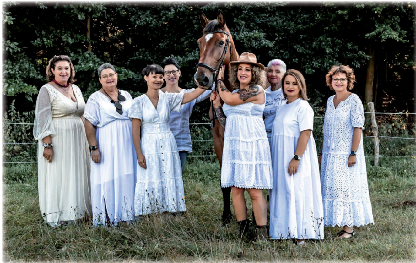
► Stowarzyszenie „Sonik” to nowa organizacja, która powstała w Kwidzynie. Tworzy ją grupa zaangażowanych rodziców dzieci z niepełnosprawnościami, pragnących stworzyć przestrzeń do wymiany doświadczeń, wzajemnego wsparcia, zrozumienia, przyjaźni oraz organizacji różnorodnych form pomocy.

Główne cele stawiane przez założycieli „Sonika” to wsparcie emocjonalne i psychologiczne dla rodziców i opiekunów, organizacja warsztatów i szkoleń dotyczących opieki nad osobami z niepełnosprawnościami, promowanie integracji społecznej osób z niepełnosprawnościami poprzez or-