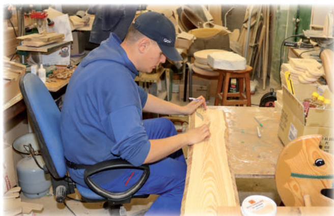
► Zajęcia w pracowni edukacyjno-stolarskiej.

Zajęcia w WTZ w Górkach, w gminie Kwidzyn, prowadzone są w pracowniach terapii życia codziennego, edukacyjno-stolarskiej, ceramicznej, plastycznej, komputerowej, wikliniarskiej, redakcyjnej, artystycznej i tradziewięki, magnetoterapia, laseroterapia). Warsztat to placówka dzienna, działająca od poniedziałku do piątku, w godz. 7.00-15.00. Obecnie w zajęciach terapeutycznych Warsztatu Terapii Zajęciowej w Górkach uczestniczy