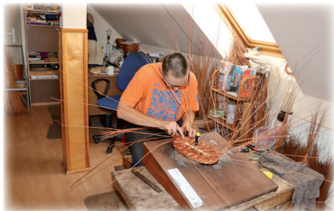
► Zajęcia w pracowni wikliniarskiej.

47 niepełnosprawnych osób. Warsztat powstał w październiku 1993 roku przy Domu Pomocy Społecznej w Kwidzynie. Od pierwszego stycznia 2004 roku prowadzi