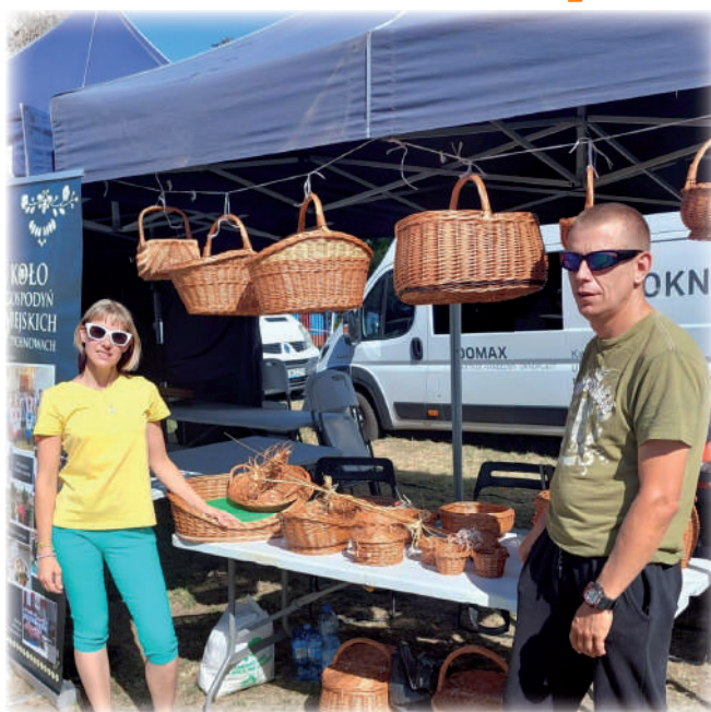
► Pracownia wikliniarska działająca w Warsztacie Terapii Zajęciowej w Górkach zaprezentowała swoje wyroby podczas Dożynek Powiatowych i Dożynek Gminy Kwidzyn.