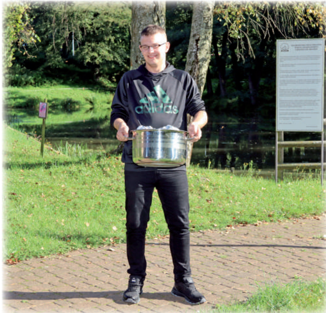
▶ Nie mogło zabraknąć ziemniaków, które trafiły do ogniska.

Były także kielbaski, które uczestnicy mogli sami upiec w ognisku. WTZ w Górkach to placówka, w której prowadzona jest rehabilitacja społeczna i zawodowa dla dorosłych niepełnosprawnych mieszkańców powiatu kwidzińskiego. To miejsce aktywnej rehabilitacji, która ma w przyszłości ułatwić znalezienie zatrudnienia, lub nauczyć samodzielności osoby niepełnosprawne posiadające znaczny lub umiarkowany stopień niepełnosprawności. W zajęciach terapeutycznych Warsztatu Terapii Zajęciowej w Górkach uczestniczy 47 niepełnosprawnych osób z całego powiatu kwidzińskiego.