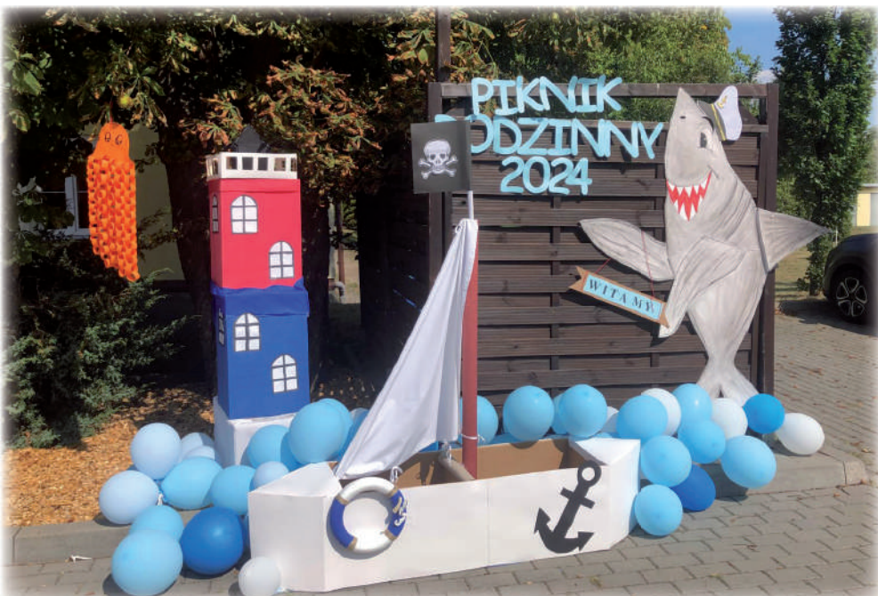
Piknik Rodzinny w Domu Pomocy Społecznej w Kwidzynie to już historia, ale po udanym spotkaniu już zdecydowano, że kolejne spotkanie odbędzie się w przyszłym roku.