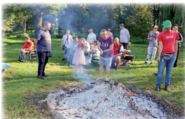
▶ W spotkaniu uczestniczyły także rodziny uczestników WTZ w Górkach.