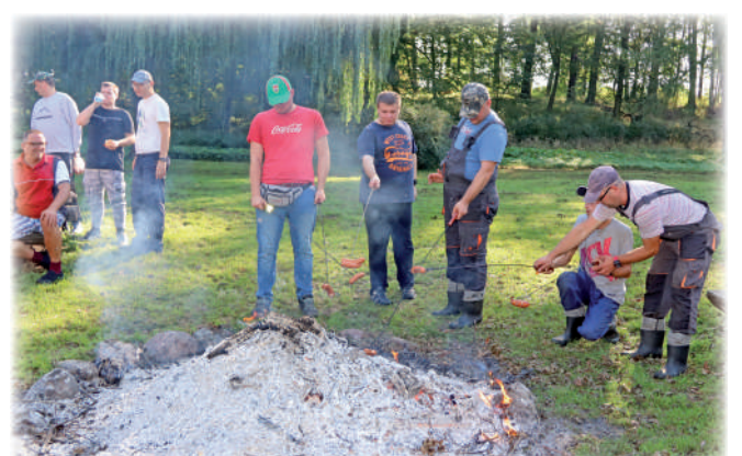
▶ Nie tylko ziemniaki, ale także kielbaski pieczono w ognisku.