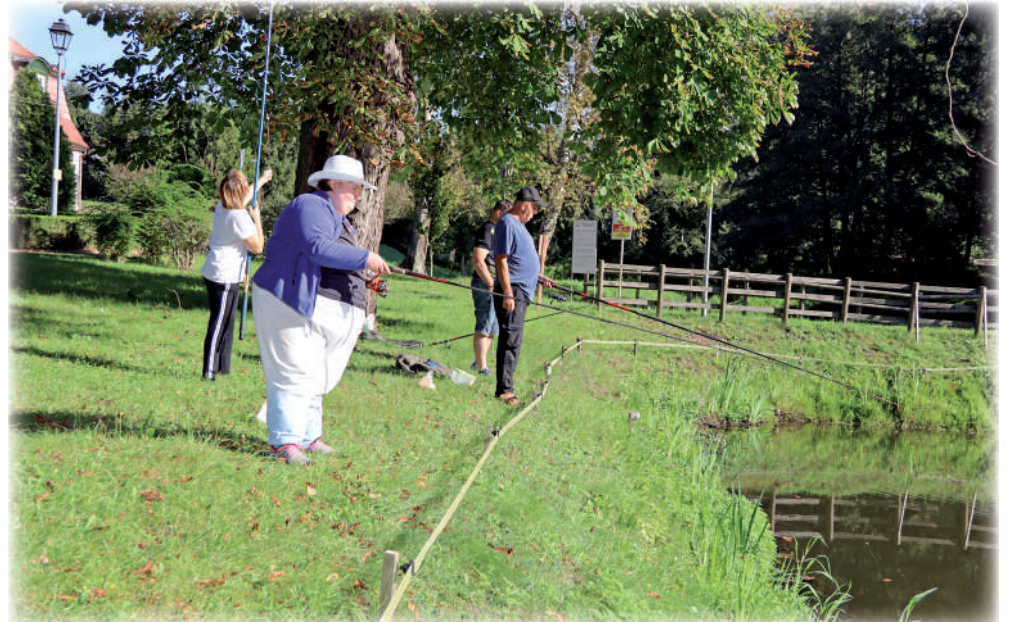
▶ Była także chwila dla wędkarzy, którzy mogli sprawdzić, czy podczas Dnia Ziemniaka ryby biorą.