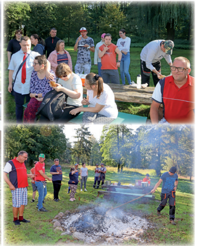
▶ Niepełnosprawni uczestnicy Warsztatu Terapii Zajęciowej w Górkach, prowadzonego przez Fundację „Misericordia”, bawili się podczas Dnia Pieczonego Ziemniaka.

Były także kielbaski, które uczestnicy mogli sami upiec w ognisku. WTZ w Górkach to placówka, w której prowadzona jest rehabilitacja społeczna i zawodowa dla dorosłych niepełnosprawnych mieszkańców powiatu kwidzińskiego. To miejsce aktywnej rehabilitacji, która ma w przyszłości ułatwić znalezienie zatrudnienia, lub nauczyć samodzielności osoby niepełnosprawne posiadające znaczny lub umiarkowany stopień niepełnosprawności. W zajęciach terapeutycznych Warsztatu Terapii Zajęciowej w Górkach uczestniczy 47 niepełnosprawnych osób z całego powiatu kwidzińskiego.