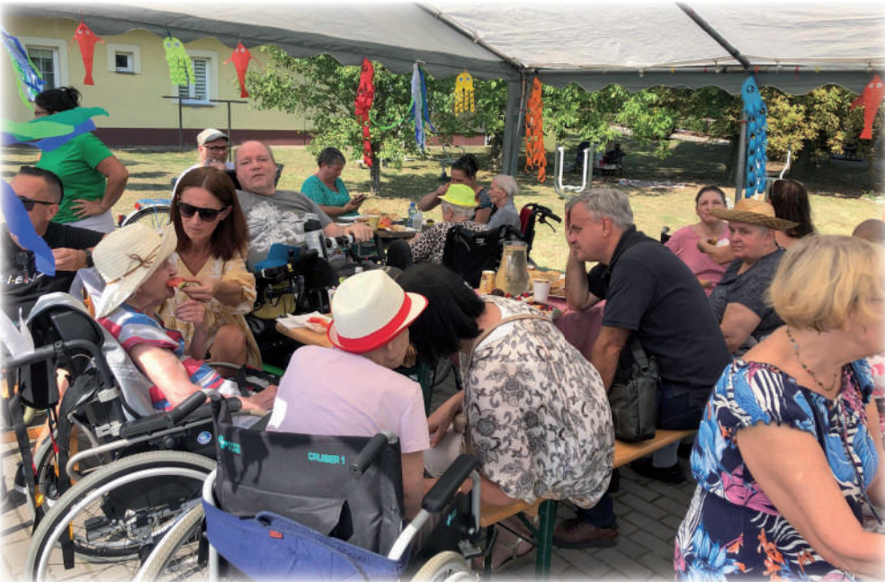
Mieszkańcy i ich bliscy spotkali się podczas Pikniku Rodzinnego zorganizowanego w Domu Pomocy Społecznej w Kwidzynie. W imprezie wzięło udział około stu gości.

Mieszkańcy i ich bliscy spotkali się podczas Pikniku Rodzinnego zorganizowanego w Domu Pomocy Społecznej w Kwidzynie. W imprezie wzięło udział ok. stu gości. Dla uczestników spotkania zorganizowano wiele różnych atrakcji.