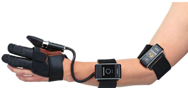
► Rękawica Neofect Neomano.

Została stworzona, aby ułatwić funkcjonowanie osobom z paraliżem dłoni. Zakłada się ją na kciuk oraz palec wskazujący i środkowy. Rękawica zawiera silniki, którymi steruje się przy użyciu pilota łączącego się z rękawicą przez Bluetooth, aby zacieśnić lub poluzować chwyt. Umożliwia chwyt z maksymalną siłą 2 kilogramów. Skórzaną powłokę rękawicy w