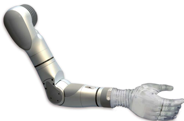
► Proteza ramienia Luke.

razie zniszczenia lub zużycia można łatwo wymienić. Za zasilanie rękawicy odpowiada mocowany na przedramieniu zasilacz, który czerpie energię z trzech baterii lub akumulatorów AA. Maksymalny czas pracy wynosi 11,5 godziny w przypadku użycia baterii lub 23,5 godziny w przypadku użycia