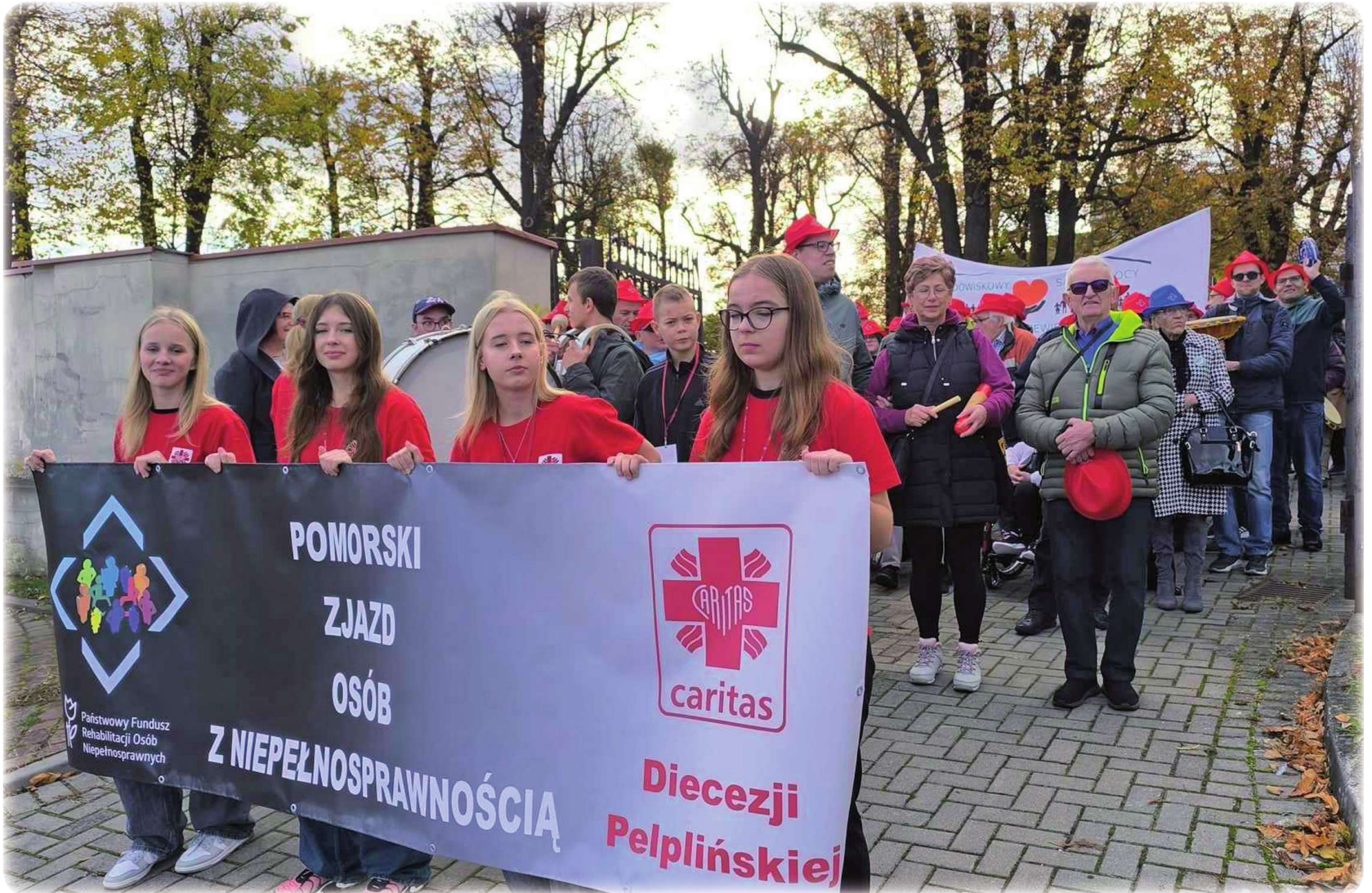
► Pomorski Zjazd Osób z Niepełnosprawnością odbył się w Tczewie. Nie zabrakło na nim przedstawicieli powiatu kwidzińskiego. W zjeździe wzięli udział niepełnosprawni uczestnicy Warsztatu Terapii Zajęciowej w Górkach, prowadzonego przez Fundację „Misericordia”.

To był pierwszy Pomorski Zjazd Osób z Niepełnosprawnością i wszystko wskazuje na to, że nie ostatni.