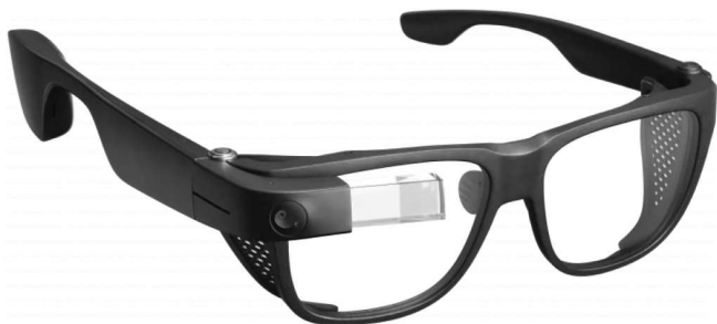
► Okulary Envision.

Inteligentne okulary Envision są narzędziem ułatwiającym codzienne funkcjonowanie osobom niewidomym i niedowidzącym. Przy użyciu kamery i sztucznej inteligencji oferują takie funkcje