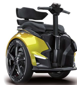
► Elektryczny wózek inwalidzki Genny Zero.

znajdujące się z tyłu otwierają się po naciśnięciu przycisku powodując jednocześnie wysunięcie rampy. Uruchomienie silnika