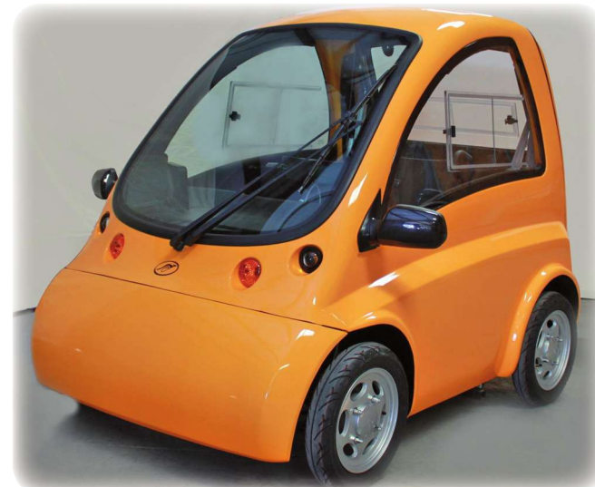
► Samochód elektryczny Kenguru.

Kenguru jest jednoosobowym samochodem elektrycznym dostosowanym do kierowania przez osoby poruszające się na wózku inwalidzkim. Pojazd ten jest odpowiednią na trudności podczas prowadzenia tradycyjnego samochodu przez te osoby. Drzwi