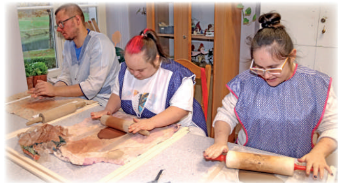
▶ Wykonywanie wyrobów ceramicznych przez osoby niepełnosprawne pozwala nie tylko na przygotowanie do zawodu, ale na kształtowanie wyobraźni i poprawę zdolności manualnych.

samodzielnej pracy. Dzięki pracowni kontynuowane są tradycje powiatu kwidzyńskiego związane z rzemiosłem wikliniarskim.