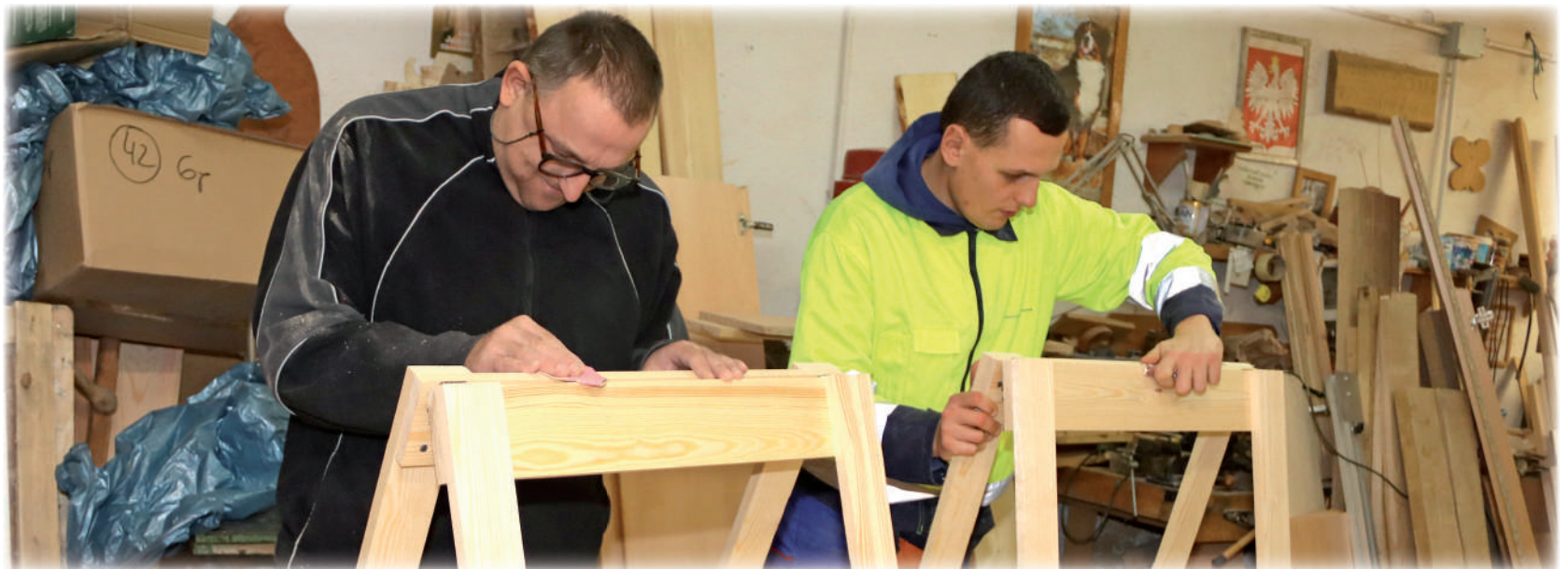
► Dni Otwarte to okazja, aby odwiedzić pracownie, w których prowadzona jest rehabilitacja zawodowa i społeczna niepełnosprawnych dorosłych mieszkańców powiatu kwidzyńskiego. Na zdjęciu: zajęcia prowadzone w pracowni edukacyjno-stolarskiej.

Dni Otwarte to okazja, aby odwiedzić pracownie, w których prowadzona jest rehabilitacja zawodowa i społeczna niepełnosprawnych dorosłych mieszkańców powiatu kwidzyńskiego. Rehabilitacja społeczna i zawodowa, prowadzona w warsztacie ma ułatwić osobom niepełnosprawnym znalezienie zatrudnienia i nauczyć samodzielności. Uczestnikiem warsztatu może zostać osoba, która ukończyła 18 lat i posiada orzeczoną znaczną lub umiarkowaną stopień niepełnosprawności. Kandydat na uczestnika musi uzyskać w orzeczeniu o niepełnosprawności wydanym przez Powiatowy Zespół ds. Orzekania o Stopniu Niepełnosprawności zapis we wskazaniach: uczestnictwo w terapii zajęciowej. Warsztat Terapii Zajęciowej to placówka dzienna, która funkcjonuje od poniedziałku do piątku w godzinach 7:00-15:00. W warsztacie funkcjonują różne pracow-