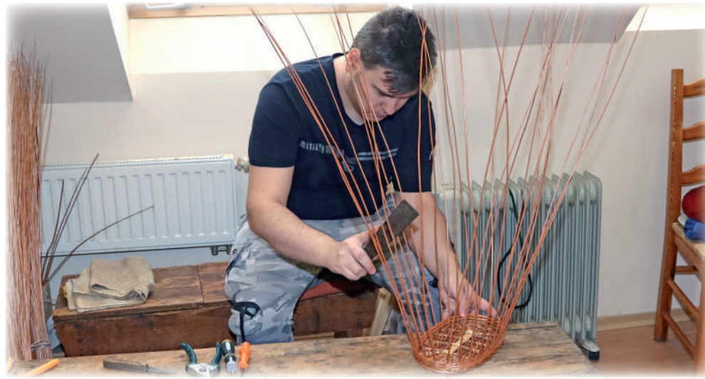
▶ Niepełnosprawni mieszkańcy powiatu mogą w pracowni poznawać trudne arka wikliniarskiego rzemiosła.

Niepełnosprawni mieszkańcy powiatu mogą w pracowni poznawać trudne arka wikliniarskiego rzemiosła. To w tej pracowni poznają podstawowe sploty stosowane w wikliniarstwie. Uczą się wyplatania koszyków, wazonów, doniczek oraz wielu innych przedmiotów. To prawdziwa nauka zawodu, który w przyszłości umożliwia podjęcie