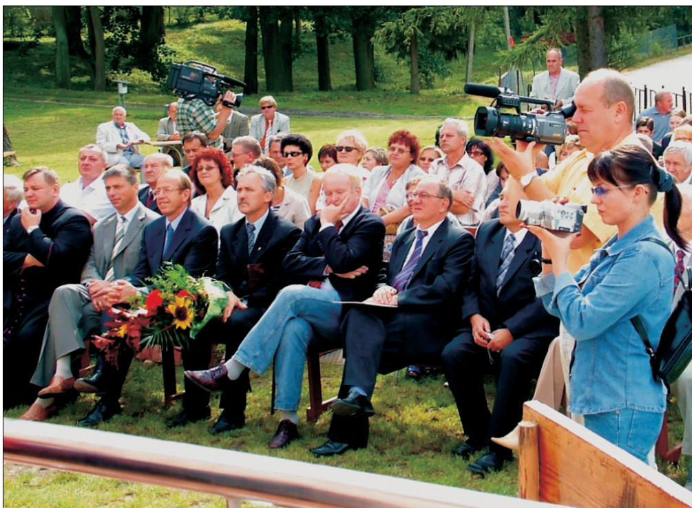
Na uroczyste otwarcie Centrum Rehabilitacji Osób Niepełnosprawnych w Górkach przybyli wszyscy, którzy wspierali inwestycję, w tym przedstawiciele Interantional Paper, władz wojewódzkich i lokalnych samorządów. Nie zabrakło lokalnych i regionalnych mediów.