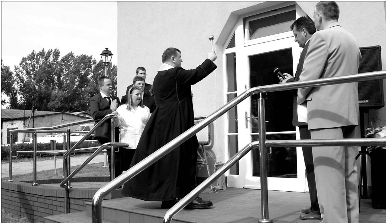
Ksiądz prałat Ignacy Najmowicz poświęcił Centrum Rehabilitacji Osób Niepełnosprawnych w Górkach.