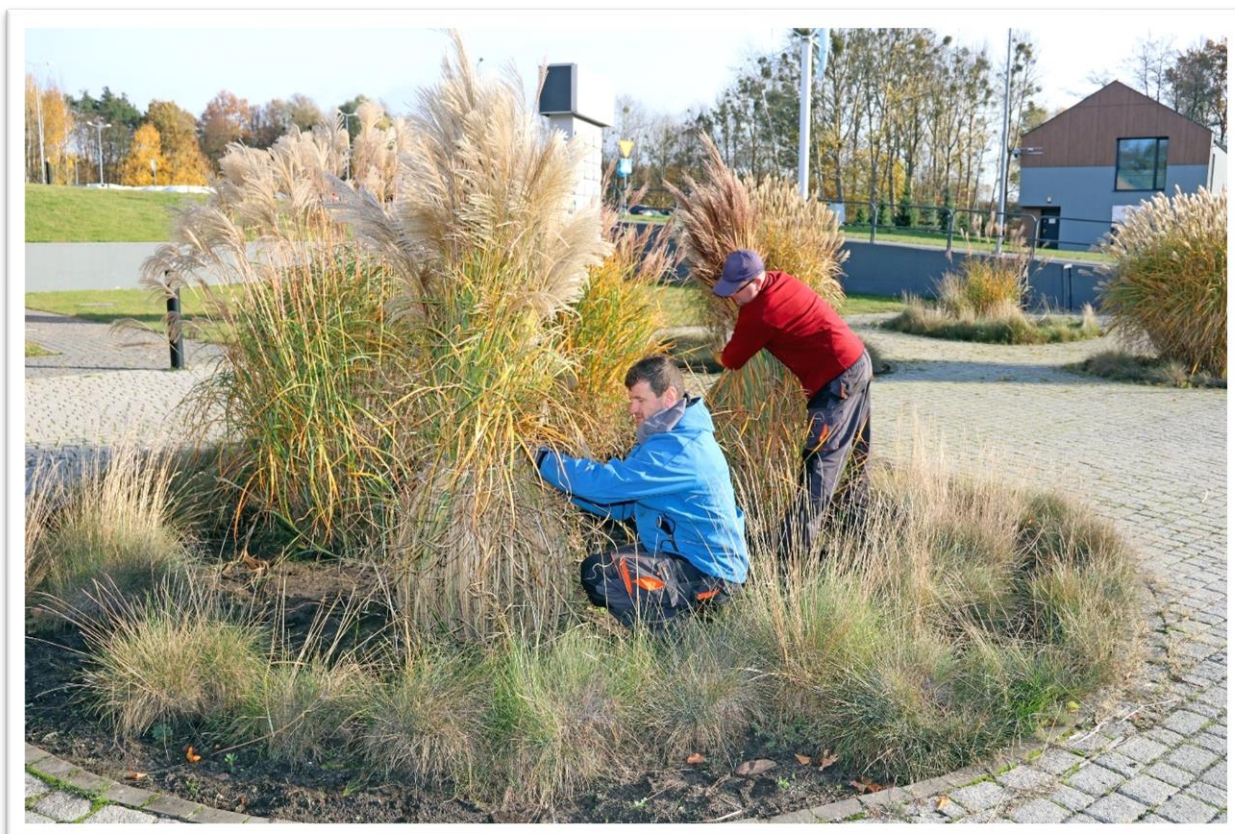
Pracownia ogrodniczo – gospodarcza