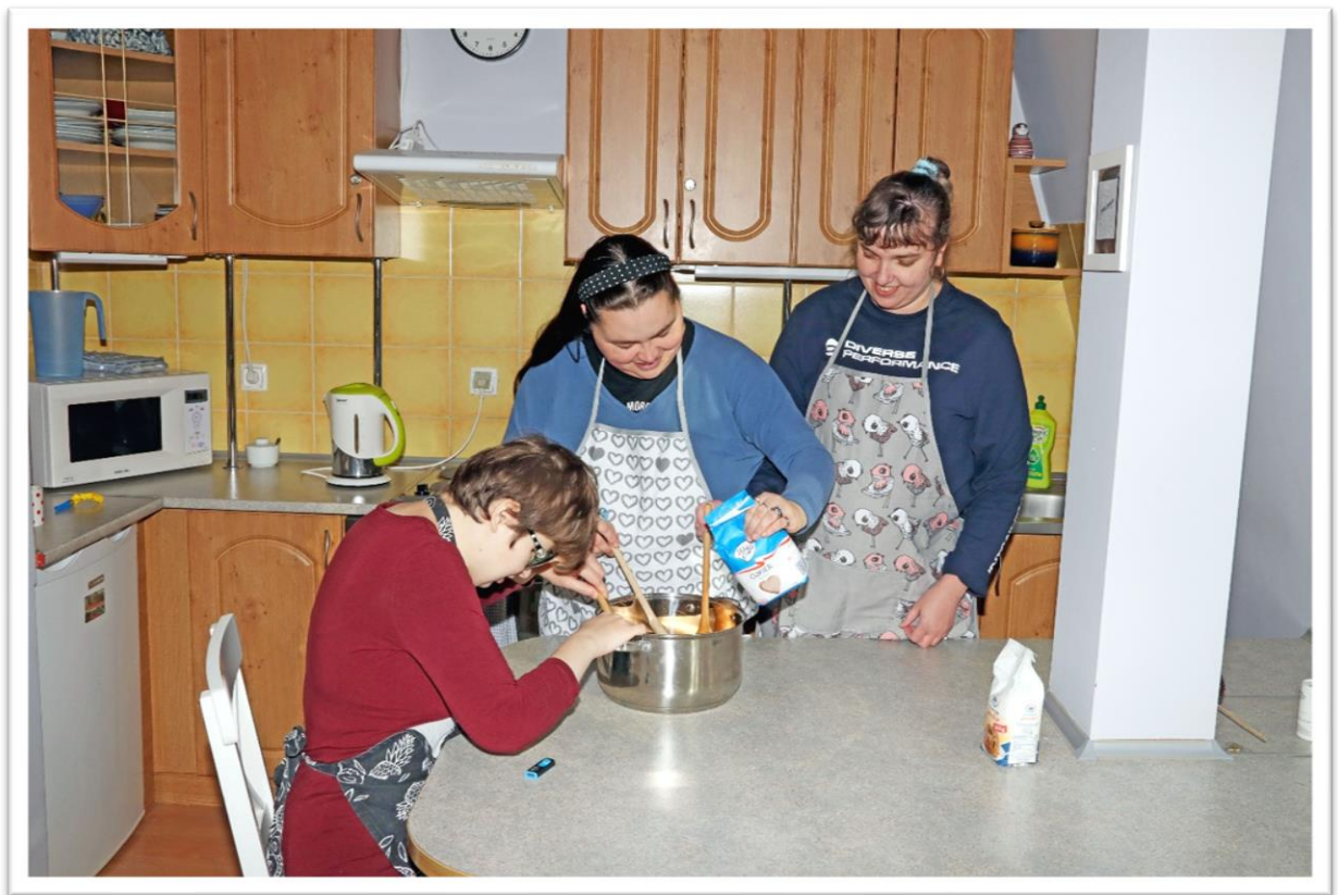
Pracownia terapii życia codziennego

Podstawą działań była terapia zajęciowa w zakresie nabywania i udoskonalania sprawności psychofizycznych, kształtowania dojrzałej osobowości, przygotowania do wykonywania zawodu oraz w konsekwencji podjęcie, w miarę możliwości, pracy na otwartym lub chronionym rynku pracy.