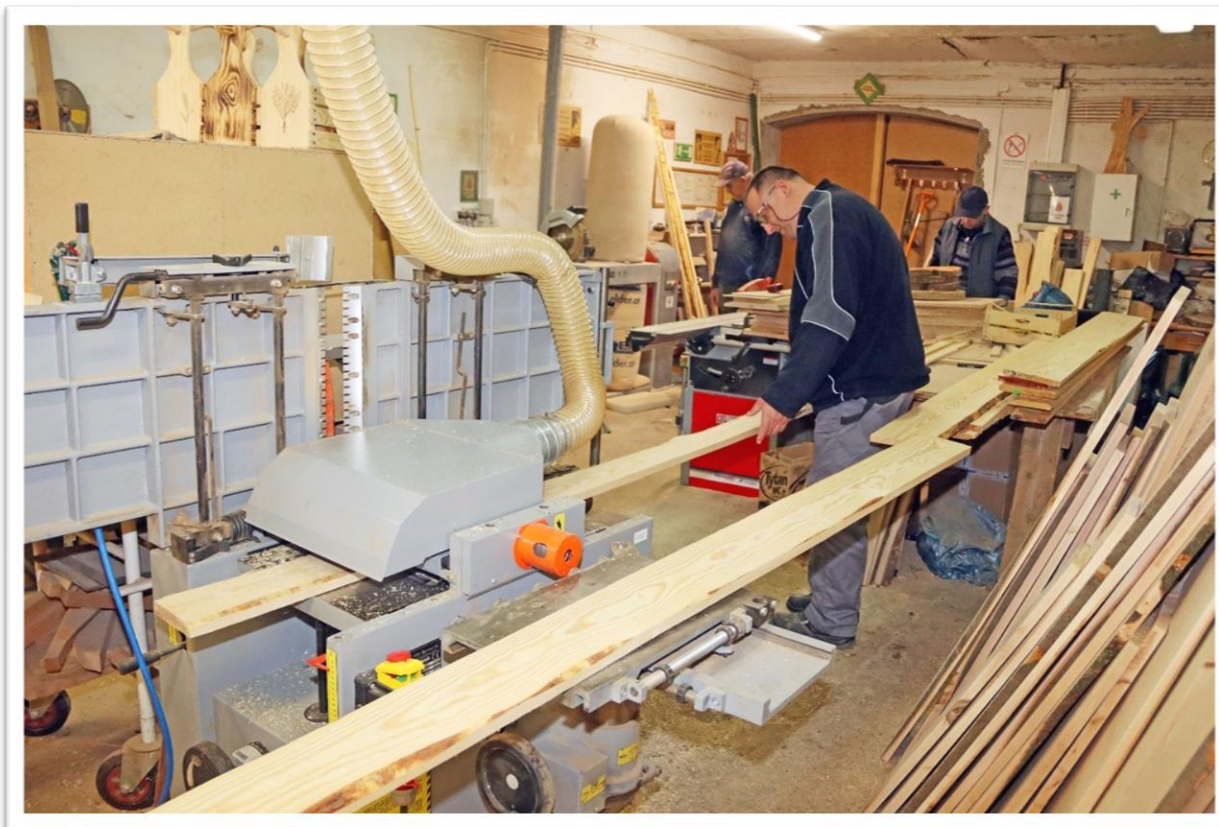
Pracownia edukacyjno – stolarska