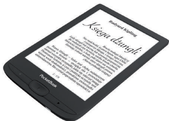
▶ Czytnik e-booków PocketBook Basic Lux 4.

od stanu rośliny (na przykład gdy konieczne jest jej podlanie) oraz