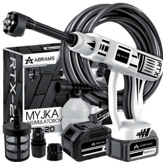
▶ Akumulatorowa myjka ciśnieniowa z akcesoriami.

zewnątrz i rozebrać się po powrocie do domu. Przykładami takich akcesoriów są przyrząd ułatwiający zakładanie i zdejmowanie skarpet (na zdjęciu), długa łyżka do butów ułatwiająca zakładanie obuwia bez potrzeby nadmiernego schylenia się oraz przyrząd do zdejmowania butów. Oprócz akcesoriów ułatwiających zakładanie i zdejmowanie butów i skarpet dostępne są akcesoria przeznaczone do innej odzieży