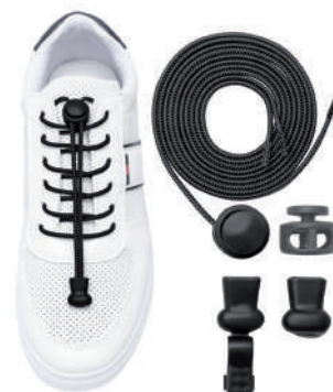
▶ Sznurowadło elastyczne.

Dla osób, które mają trudności z wiązaniem sznurowadeł, dostępne są sznurowadła elastyczne. Takie sznurowadła nie wymagają wiązania, ułatwiają zakładanie butów i nie rozwiązują się podczas noszenia jak zwykle sznurowadła. Powodują też mniejszy ucisk, co jest