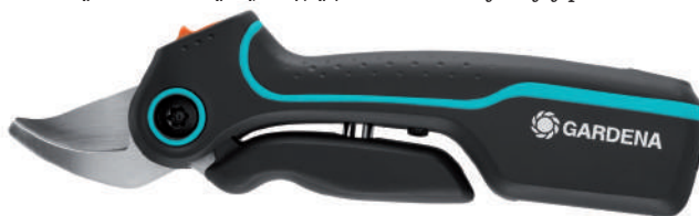
▶ Sektor akumulatorowy.

zależą od rodzaju czcionki oraz kontrastu. Niektóre czytniki pozwalają też na przetwarzanie treści książek na mowę, co pozwala na słuchanie książki podobnie jak audiobooka i jest kolejną zaletą dla osób z zaburzeniami wzroku. Wyświetlacze E Ink, w które zwykle są wyposażone czytniki e-booków, nie męczą oczu tak