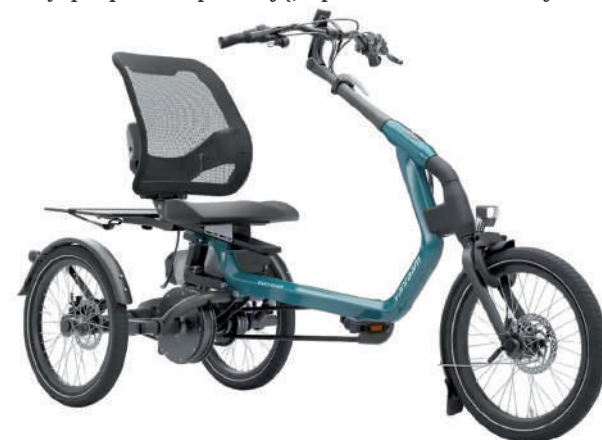
▶ Rower trójkołowy.

w odpowiedzi na dotyk i gesty. Może też wyświetlać między innymi informacje o stanie rośliny, zegar lub minutnik Pomodoro. PlantsIO Ivy współpracuje z aplikacją mobilną, która pozwala na zdalne monitorowanie stanu rośliny i wysyła alarmy oraz przypomnienia. Jest zasilana przy użyciu wbudowanego akumulatora o pojemności 2000 mAh, który pozwala na maksymalnie 9 godzin pracy przy wyłączonych trybach nocnych i oszczędzania energii – producent zaleca podłączenie doniczki do stałego źródła zasilania. Do ładowania akumulatora służy przewód USB typu C.