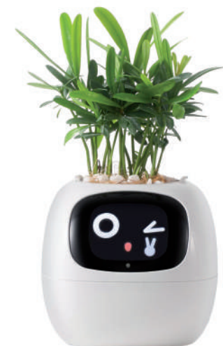
▶ Inteligentna doniczka PlantsIO Ivy.

czych prac. Niektóre mogą pełnić funkcję tradycyjnego sekatora, pozwalając na ręczne cięcie bez