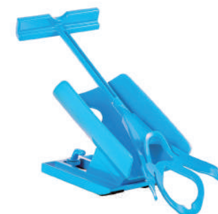
▶ Przyrząd ułatwiający zakładanie i zdejmowanie skarpet.