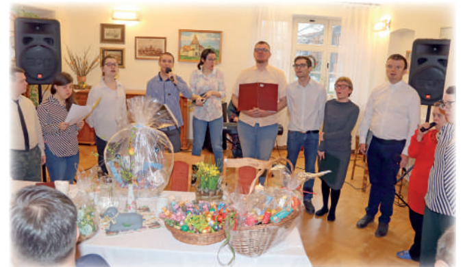
► Spotkanie uświetnił występ zespołu, który tworzą uczestnicy warsztatu, w tym także biorący udział w zajęciach prowadzonych w pracowni artystycznej.