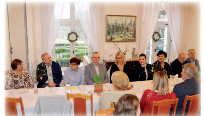
► W przedświątecznym spotkaniu nie zabrakło gości, którzy zasiedli przy wspólnym stole z uczestnikami i pracownikami warsztatu.