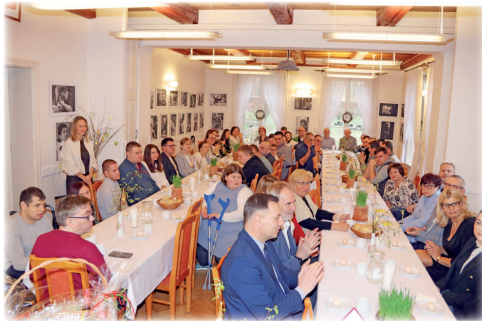
► Uczestnicy i pracownicy Warsztatu Terapii Zajęciowej w Górkach, prowadzonego przez Fundację „Misericordia”, a także zaproszeni goście wzięli udział w spotkaniu zorganizowanym z okazji Świąt Wielkanocnych. Wielkopostne spotkanie odbyło się w zabytkowym dworku w gminie Kwidzyn, który jest siedzibą warsztatu.