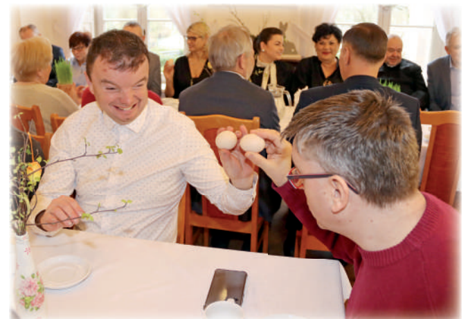
► Nie mogło zabraknąć wielkanocnego stukania się jajkami.