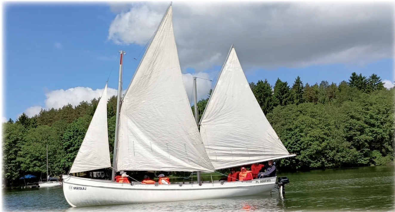
▶ Pierwsze tym roku Warsztaty Żeglarskie i Motorowodne Dla Osób Niepełnosprawnych rozpoczęły się w Ry- nie. Ich organizatorem jest Pomorskie Stowarzyszenie Żeglarzy Niepełnosprawnych w Kwidzynie. Na zdjęciu poniżej pierwsza grupa uczestników warsztatów.

Pierwsze tym roku Warsztaty Żeglarskie i Motorowodne Dla Osób Niepełnosprawnych rozpoczęły się w Ry- nie. Ich organizatorem jest Pomorskie Stowarzyszenie Żeglarzy Niepełnosprawnych w Kwidzynie. W ramach projektu realizowanego dzięki finansowemu wsparciu Państwowego Funduszu Rehabilitacji Osób Niepełno- sprawnych odbędzie się w tym roku sześć warsztatów żeglarskich i motorowodnych.