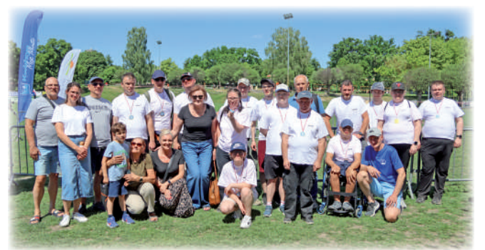
► Reprezentacja Warsztatu Terapii Zajęciowej w Górkach, prowadzonego przez Fundację „Misericordia” wraz z opiekunami oraz najwierniejszymi kibicami, czyli rodzinami.