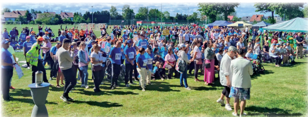
▶ W Żuławskiej Olimpiadzie Osób z Niepełnosprawnościami uczestniczyło ponad 400 zawodników.