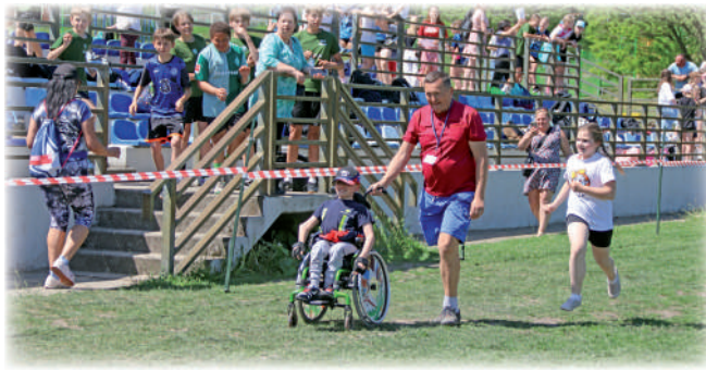
► Uczestnicy biegu mieli do pokonania 500 m.