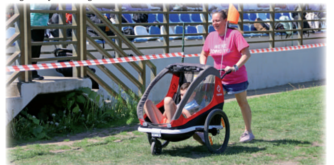
► Pokonanie 500 metrów wymagało dużego wysiłku, ale bieg ukończyli wszyscy.