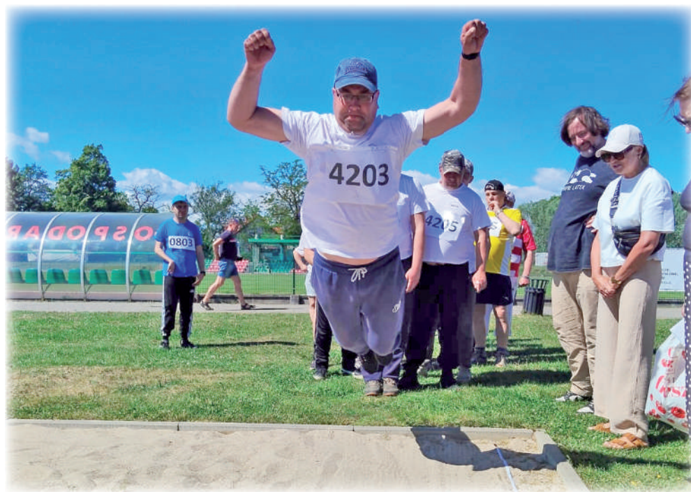
▶ Uczestnicy Warsztatu Terapii Zajęciowej w Górkach, prowadzonego przez Fundację „Misericordia” wzięli udział w Żuławskiej Olimpiadzie Osób z Niepełnosprawnościami.

Sygnalem do rozpoczęcia zmagania było uroczyste zapalenie olimpijskiego znicza. Zawodnicy rywalizowali w dwadzieściu konkurencjach drużynowych i sześciu konkurencjach indywidualnych.