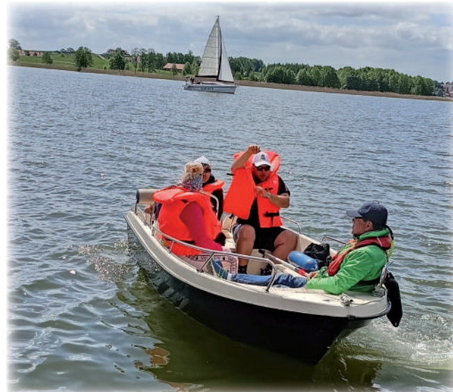
▶ W ramach projektu realizowanego dzięki finansowemu wsparciu Państwowego Funduszu Rehabilitacji Osób Niepełnosprawnych odbędzie się w tym roku sześć warsztatów żeglarskich i motorowodnych.

Niepełnosprawne osoby nie tylko będą poznawać żeglarskie arkana na jeziorze, ale także na morzu. 15