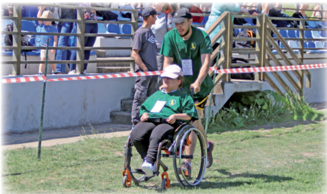
► W biegu brały udział osoby poruszające się na wózkach ręcznych.