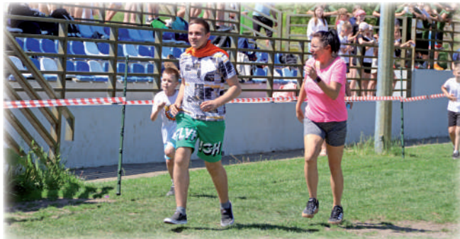
► Wszyscy, którzy ukończyli bieg, otrzymali pamiątkowe medale.