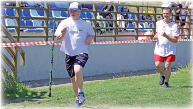
► Najważniejsze było pokonanie całego dystansu.